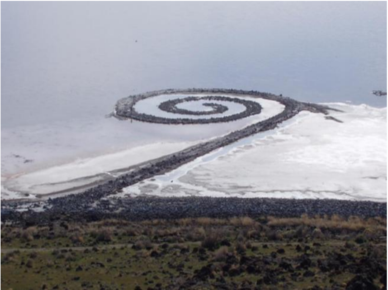
Robert Smithson, Spiral Jetty , 1970

Tutto questo per dire che l'altro giorno Creative Application (il miglior magazine culturale, serio, su quello che succede intorno alla tecnologia applicata alla creatività) pubblica questo progetto . Un programma scritto in Python che progetta pezzi di terra con agricolture diversificate, disegnando sulla terra lembi di biocosmo come dipinti della natura. Il tutto, con una funzione, sia agricola che "formale".