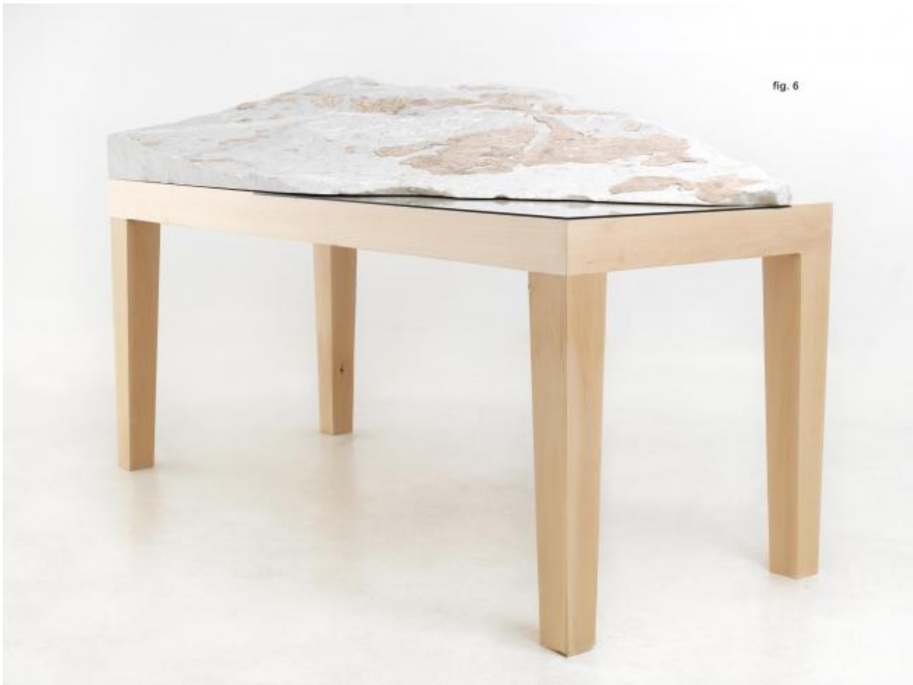
Margherita Moscardini, Maquette con difetti sentimentali , 2013

Quel che è immaginato come un percorso didattico diventa così un excursus tra le possibilità della forma e della materia, del loro essere e del loro negarsi, dal cemento puro dei bunker, all'irregolarità dell'asfalto e del marmo, cercati, trovati, affiancati, incorporati, trasformati, studiati e restituiti.