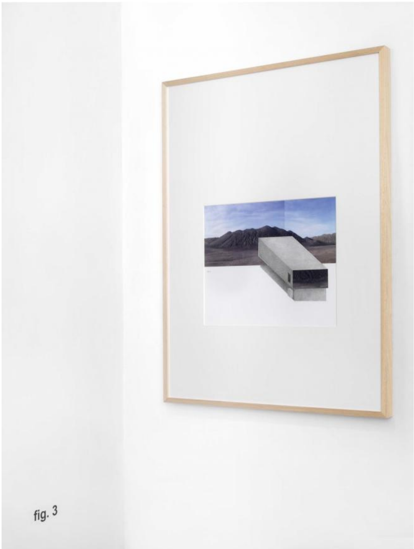
Margherita Moscardini, Fig. a , 2013

Alla premessa segue poi lo studio grafico e progettuale dei disegni; collage in cui si traduce visivamente lo spostamento dei volumi terreni potenzialmente estraibili dalla montagna, dalla cava o dalla riserva, e successivamente destinati alla costruzione delle architetture ( Figg. a-b, Elogio del Condizionamento ,