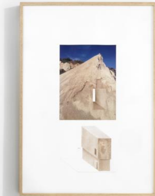
Margherita Moscardini, Fig. b , 2013

Queste sono poi inquadrate in un sistema geografico spaziale astratto che, mettendo in evidenza le griglie strutturali di una prospettiva sfuggente in cui sono inseriti ritagli fotografici e disegni, strizza l'occhio ai progetti utopici di Superstudio, citati dalla stessa artista.