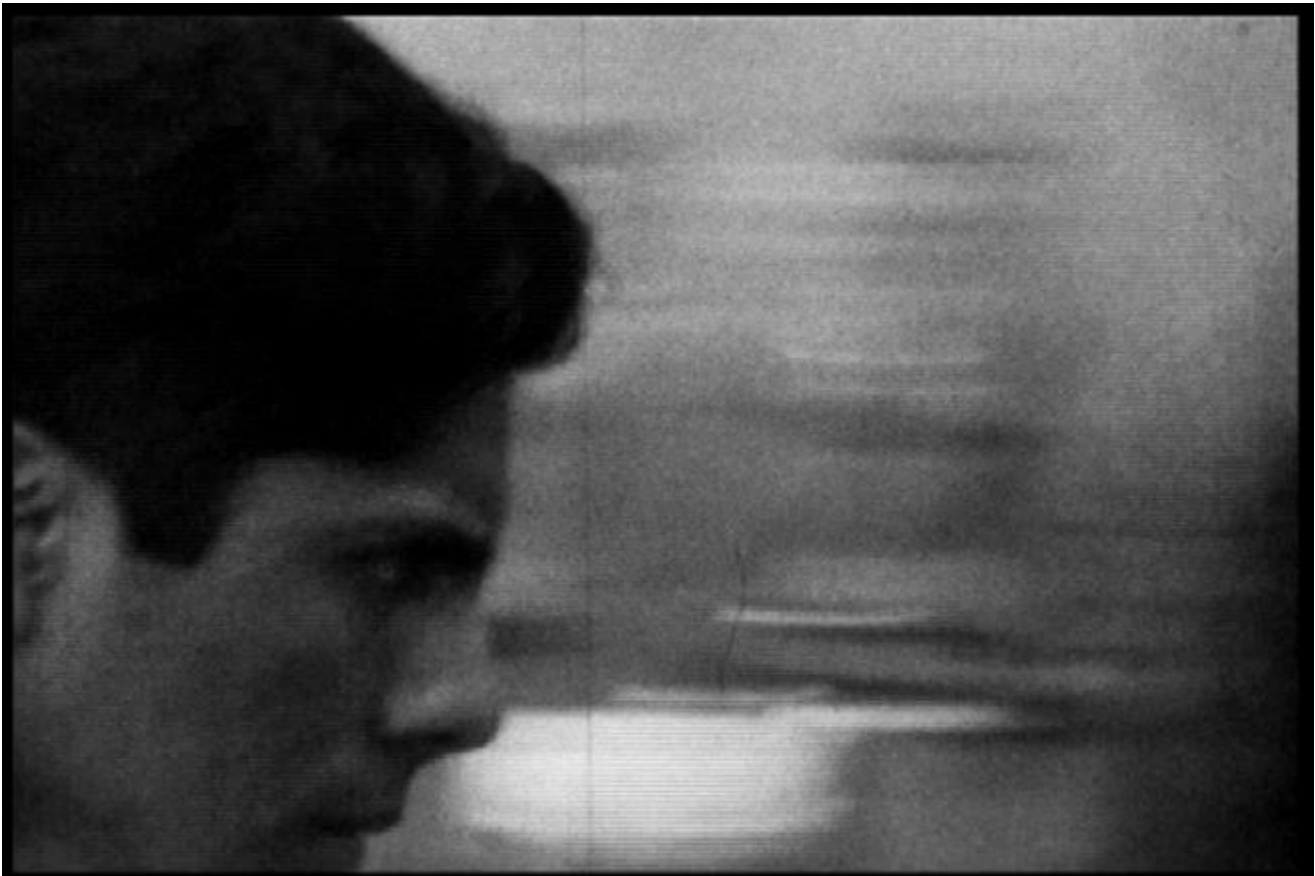
Jonathas de Andrade, 4000 desparos , 2010