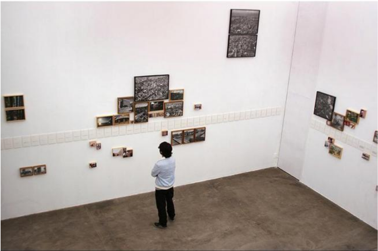
Jonathas de Andrade, Ressaca tropical , 2009

In altri lavori l'artista interroga direttamente la possibilità sociale e politica dell'esperienza artistica. Educação para adultos (2011) riprende la tecnica di alfabetizzazione ideata da Paulo Freire negli anni Sessanta. Per l'artista non si tratta solo di confrontarsi con un gruppo di analfabeti e produrre nuove schede fotografiche in cui associare immagini e parole, ma di misurarsi con una metodologia che coniugava l'insegnamento alla presa di coscienza politica del sottoproletariato. L'artista constata l'impossibilità di assumere una postura analoga di fronte alla crisi attuale delle ideologie e la necessità di accettare le contraddizioni e i paradossi della contemporaneità: “sapere e non sapere, aver coscienza della completa verità nell'esprimere menzogne accuratamente architettate, difendere simultaneamente due opinioni opposte, sapendole contraddittorie e anche così credendo in entrambe; usare la logica contro la logica, indossare la moralità per ripudiare la propria moralità; credere nell'impossibilità della Democrazia, agendo in difesa della stessa Democrazia... Semplicemente, quello che poco tempo prima era inteso come una consegna al cinismo, emerge ora come la struttura di una nuova relazione con il mondo, una curiosa politica dell'etereo” ( O gatilho , Jonathas de Andrade, 2010).