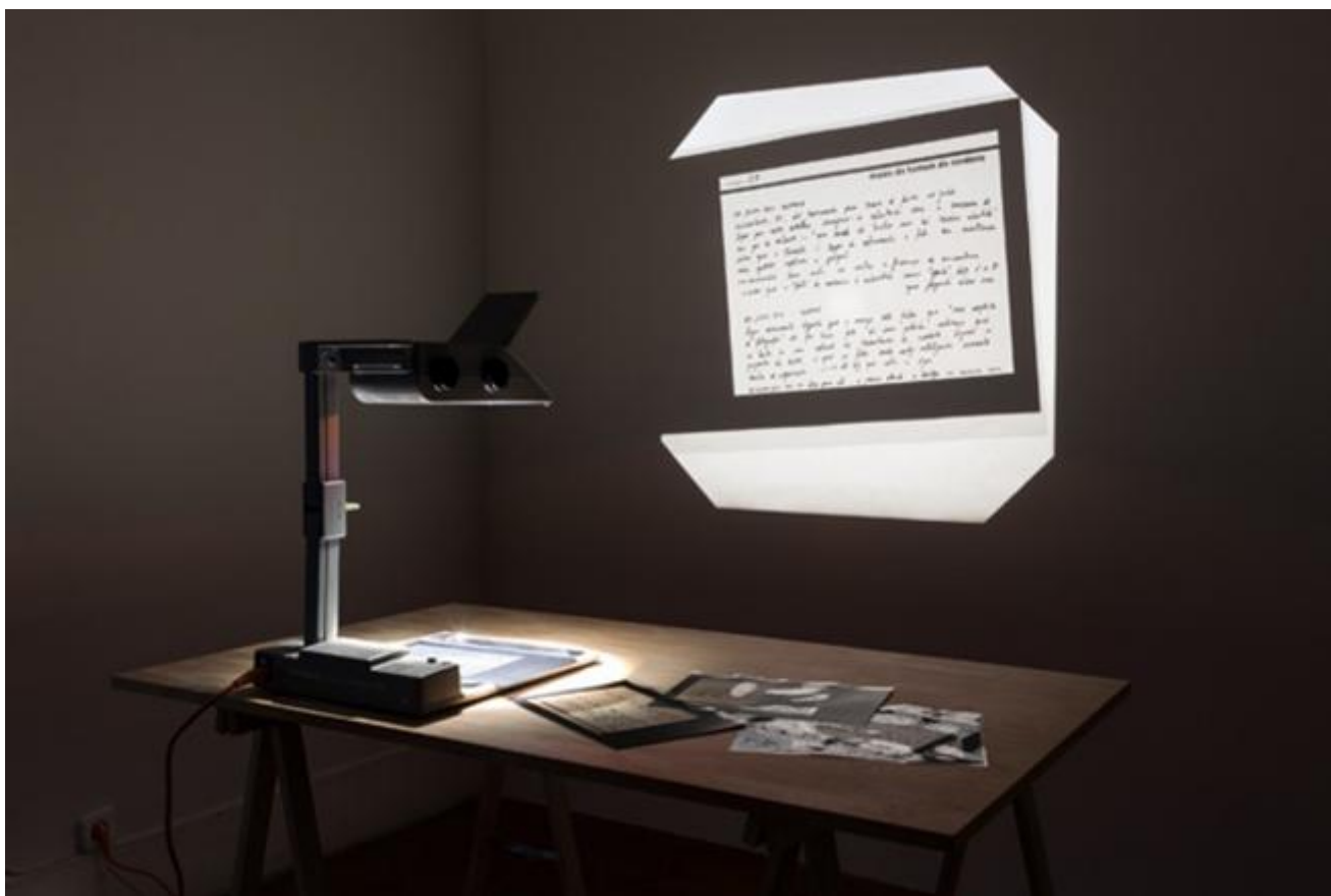
Jonathas de Andrade, Cartazes para o museu do homem do nordeste , Kunsthalle Lissabon, 2013

la tensione dell'abisso e la sua crudeltà per inventare azioni, immagini, narrazioni” (in Jonathas de Andrade, 4000 Disparos , 2011).