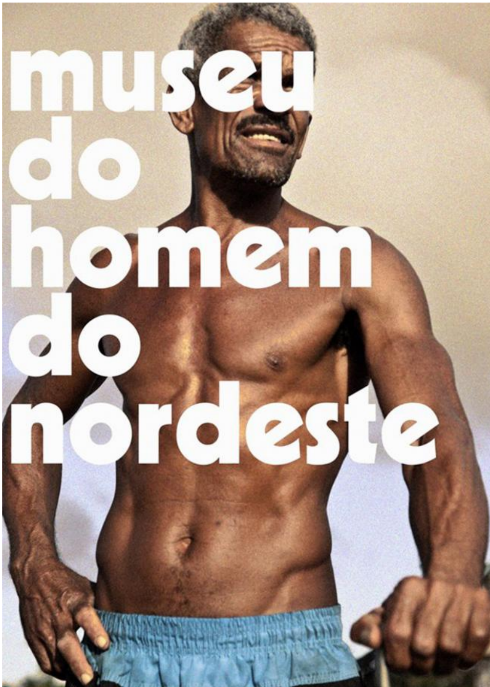
Jonathas de Andrade, Cartazes para o museu do homem do nordeste , 2013

Le immagini che ne risultano sono sottilmente ambigue, sempre controllate: mostrano la naturale vanità del farsi fotografare, la delicata malizia dello sguardo dell'artista e si liberano di qualsiasi cliché etno-turistico senza concedere nulla a banalizzazioni erotiche. La scritta Museu do homem do nordeste compare ironica in ogni poster e la sua grafica muta di volta in volta: le parole sottolineano le figure, danzano attorno ai volti, li coprono. Quella che dovrebbe essere un'indicazione, l'affermazione di una definizione culturale, è variamente spaziata e ingrandita, a volte stampata in diagonale: sembrano altrettante prove grafiche di una campagna pubblicitaria per un prodotto di consumo. È l'unicità della nozione di "uomo del nordest" che si scompone, si disfa nei ritratti dei manifesti: lo stereotipo, definito, avvilito e venduto ora deve essere distrutto, divorato, digerito, perché possa di nuovo manifestarsi nella sua vitalità.