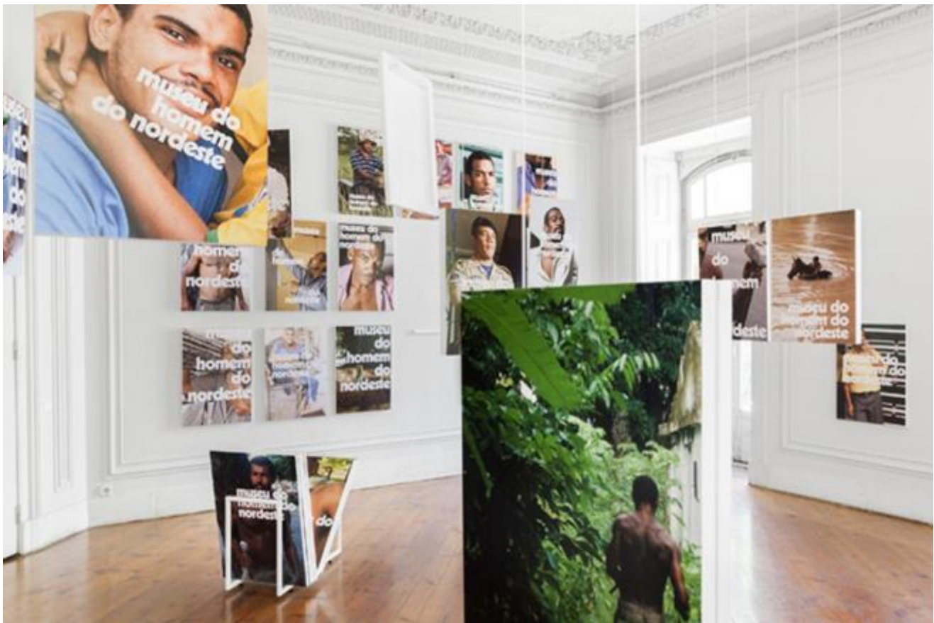
Jonathas de Andrade, Cartazes para o museu do homem do nordeste , Kunsthalle Lissabon, 2013

Tutti i manifesti possono essere spostati, aggiunti o riposti dal pubblico che partecipa a comporre l'allestimento che l'artista ha predisposto. Jonathas de Andrade presenta molte immagini di operai, mendicanti, contadini, portieri, studenti fotografati in un ambiente vagamente “nordestino” ma senza particolare enfasi sulle professioni dei soggetti. In un altro lavoro, 4000 desparos (2010), aveva già presentato una collezione di ritratti di uomini, costruendo un immaginario completamente diverso: l'inquadratura fotografica - e non quella grafica del manifesto - isola centinaia di uomini incontrati a Buenos Aires, durante un lungo viaggio attraverso il Sud America. La serie, realizzata in bianco e nero, con pellicola Super8, costruisce un immaginario documentale che si richiama esteticamente agli anni Settanta e alla cieca violenza delle dittature, mostrando una selezione di volti anonimi, ignari e vulnerabili.