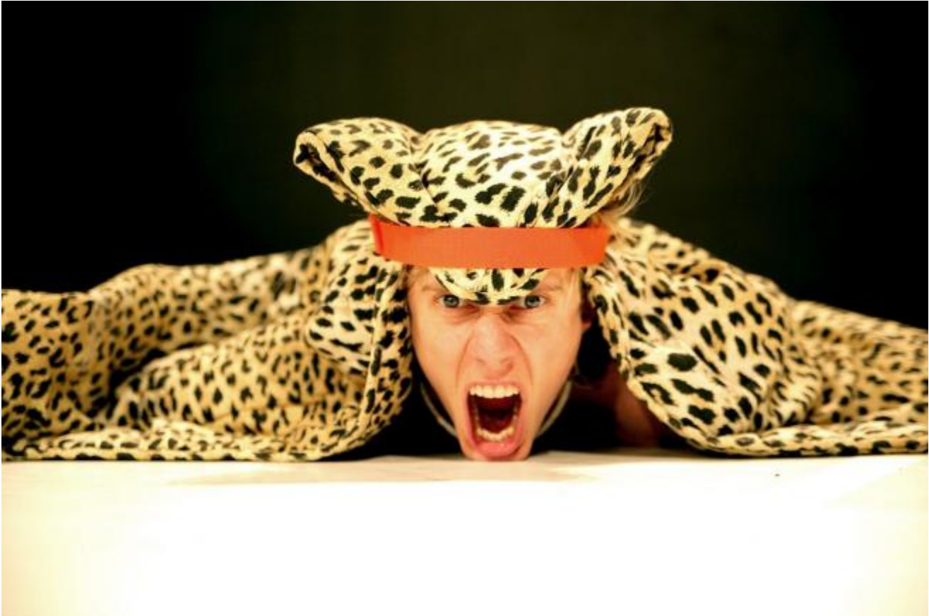
Nella Tempesta, Motus.