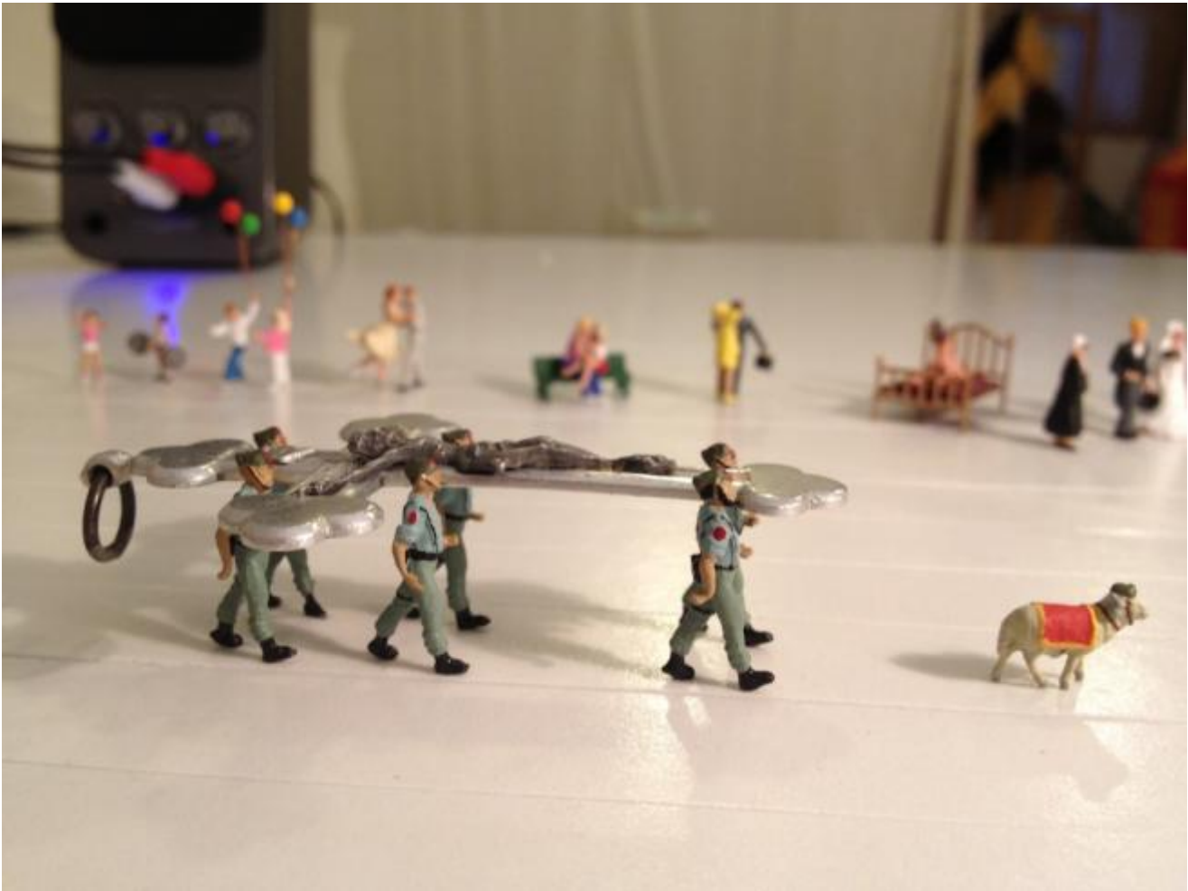
Gran Obra di David Espinosa