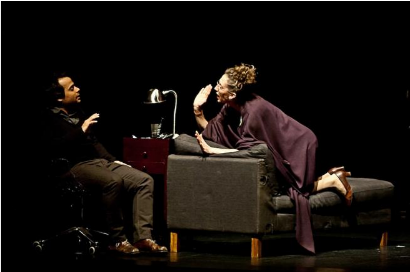
El viento en un violin regia di Claudio Tolcachir

funzionare. Tutto il rimosso, nascosto nelle case o nei cuori, sarà riversato nella piazza dove si incrociano i diversi destini. Il ritmo è avvolgente, i suicidi e le scelleratezze celate nelle pieghe della normalità si susseguono, con i morti che rimangono in scena, sulle spalle dei vivi, trasformati in scheletri grotteschi o semplicemente imbiaccati, a esigere i loro tributi, mentre si infoltisce la tribù degli spazzini, segnati da qualche stigma, da qualche segno di differenza inconciliabile. Si passa dai toni della moralità medievale ai grandi affreschi alla Bosch carichi di particolari e di ripetizioni, a un surrealismo belga dove le palandrane nere e le bombette alla Magritte sono state sostituite da tute fosforescenti e abiti da ipermercato, con bravi padri di famiglia che sequestrano e stuprano, madri che si dichiarano puttane, un concerto sullo sfondo di un palco zattera pieno di pesci salvagente di plastica, confessioni strazianti e neviccate che tutto coprono, anche la voglia di morire di chi immobilizzato su una sedia a rotelle sa di non potere più avere quella merce rara che è l'amore. La piccola comunità viene scorticata.