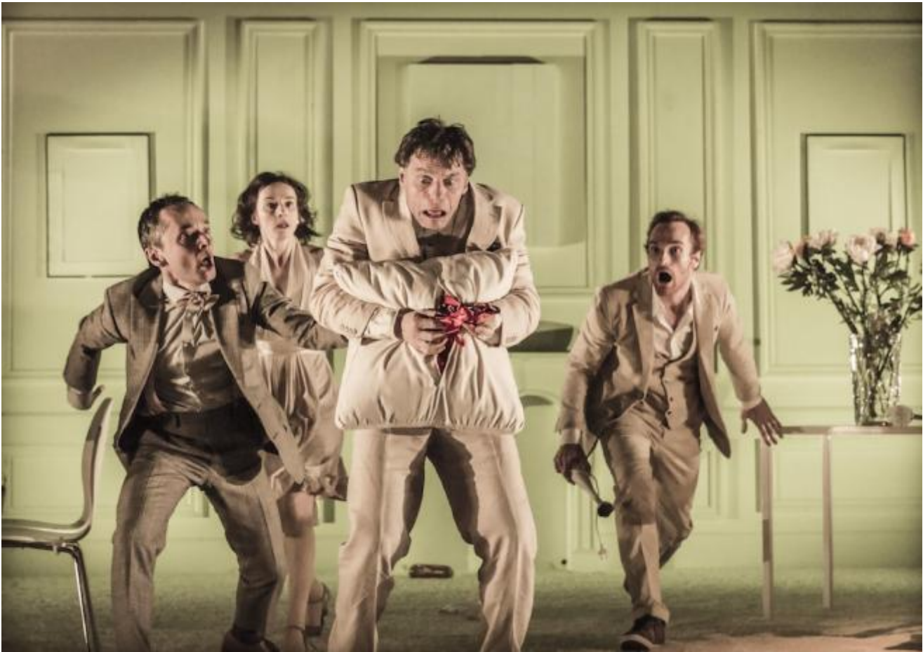
Ubu roi regia di Declan Donellan