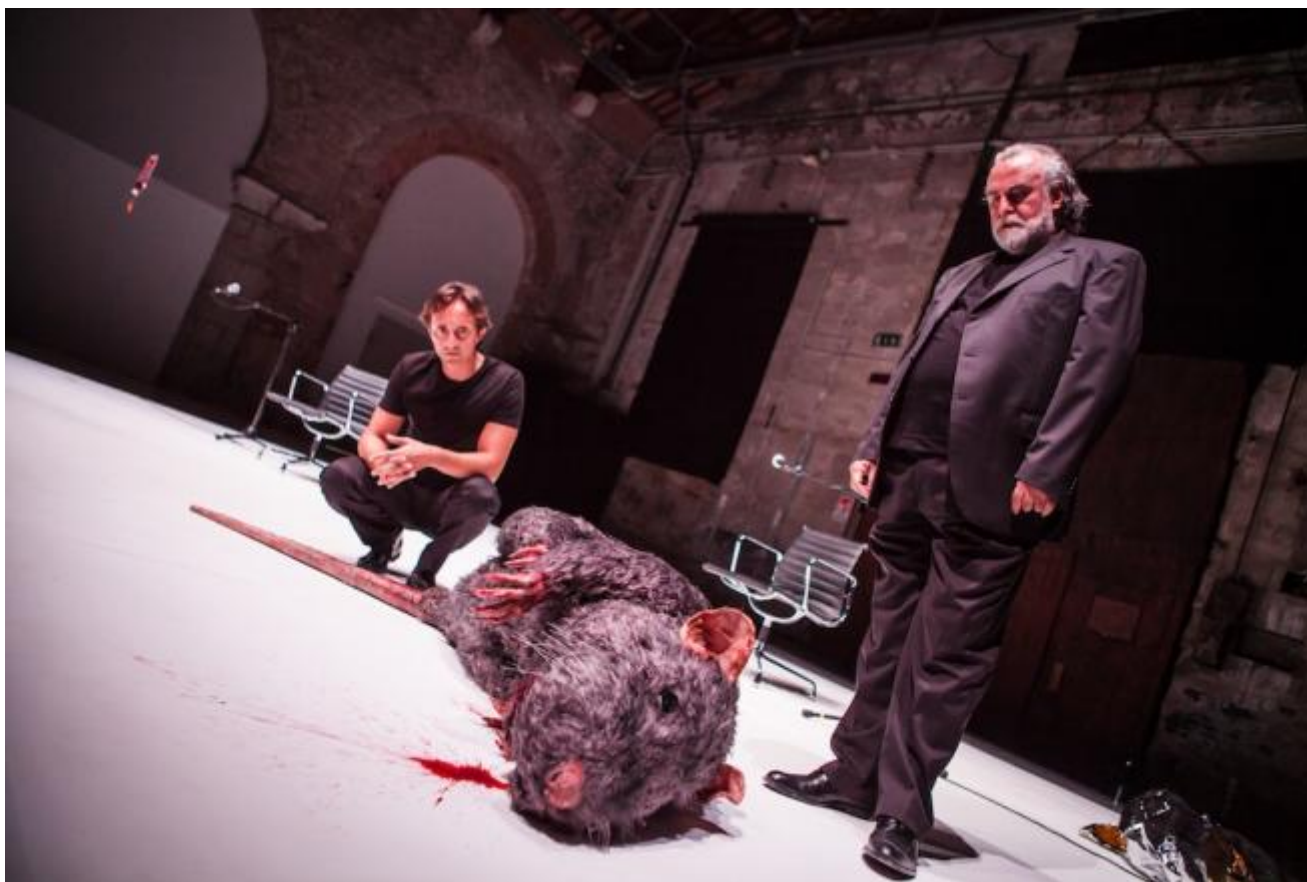
El policia de las ratas

festival, e quello che giustifica in parte la scelta del periodo, sono i molti laboratori , affidati ai migliori nomi della scena internazionale, a radunare (anche) un pubblico sicuro per gli spettacoli di circa trecento partecipanti, in molti casi attori o aspiranti tali, che in altre zone dell'anno avrebbero maggiori difficoltà ad accorrere qui.