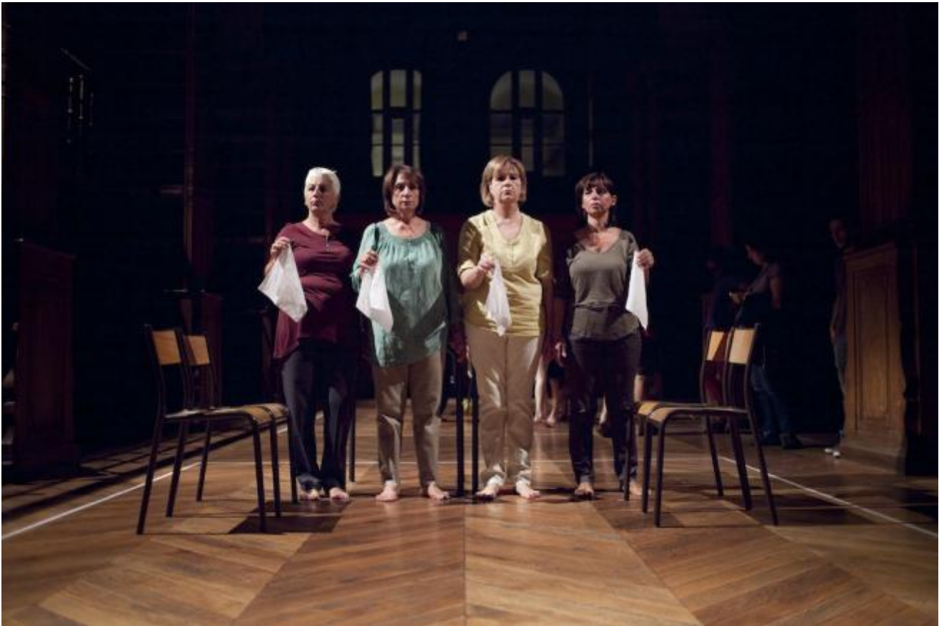
Virgilio Sieni

Le immagini sono continue, sfumate, risucchiate nelle corse del gruppo, con qualcuno che arranca ansimando, e viene aspettato, riassorbito, fino al sogno del gruppo di Santarcangelo, delicato, inquietante con levità, e una cieca o sonnambula che misura lo spazio, una palla in equilibrio sul naso, ali, cappelli a cono... Il gruppo si ricrea e dissolve come mosso continuamente da un vento, che mette in mostra goffaggini e meraviglie, rendendo l'arte della danza domestica e stellare. Un uomo e una donna, tra sfide e movimenti di popoli con materassi, sedie, tavoli, in cerca di luoghi dove poter sedimentare, si costruiscono un rifugio, fatto di niente: fragile casa, mentre la luce del sole, che penetrava radente nel grande salone, è sfumata in illuminazione di lampade che creano lunghe ombre.