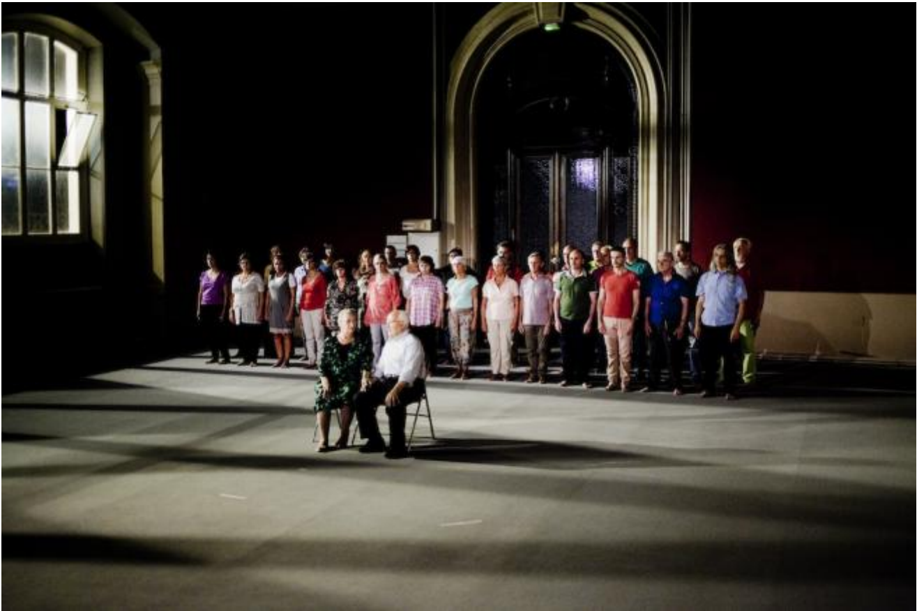
Virgilio Sieni

La sera lo spettacolo si snoda in vari luoghi: inizia con il Coro Savani di Carpi, protagonista, con varie persone che avevano vissuto il terremoto del 2012, del memorabile Home_quattro case visto per il festival Vie di Modena. I coristi, con i loro vocalizzi pop che penetrano nella pelle e arrivano fino in fondo dentro, compongono sipari che rivelano due anziani contadini che avanzano con fatica di gambe ultraottantenni, raccontando brevi squarci di lavoro e vita; oppure giovani danzatori non vedenti che avanzano aiutati da un cane e poi da soli cercando di trovare un senso allo spazio siderale. E loro stessi, i coristi, diventano suono che danza, spirali, mentre questa comunità procede verso qualche abisso, e cinque persone di Carpi inscenano un rito di assenza e scongiuro, una processione-via crucis con una grondaia, resto di casa abbattute dal terremoto.