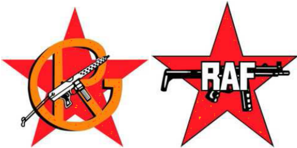
08 A e B. GRUPOS DE RESISTENCIA ANTIFASCISTA P.125