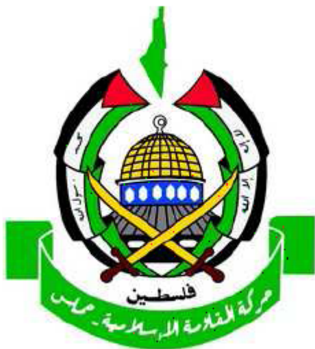
09. HAMAS P. 131

Il branding è uno strumento senza coscienza o moralità; può essere usato a scopi sia positivi sia negativi, a volte in contemporanea”. E così come ogni brand lavora per eliminare ogni possibile divario fra l’identità di sé che tende a veicolare e l’immagine che ne viene percepita dal pubblico, analogamente i terroristi devono saper usare, coi kalashnikov, un po’ di Illustrator e di Photoshop per gestire la comunicazione visiva del proprio gruppuscolo armato. Lo fanno bene, male, un po’ e un po’? Vista l’estrema povertà del repertorio figurativo, cromatico e formale messo in gioco in questi logo (stelle, bandiere, falci e martello, pistole, fucili che s’incrociano, fari, scritte... pochissimo altro) si direbbe abbastanza male. Spiccano, a mo’ di controesempio, i tedeschi della Baader Meinhof , banali nella scelta dei simboli e tuttavia eccellenti nella loro resa grafica.