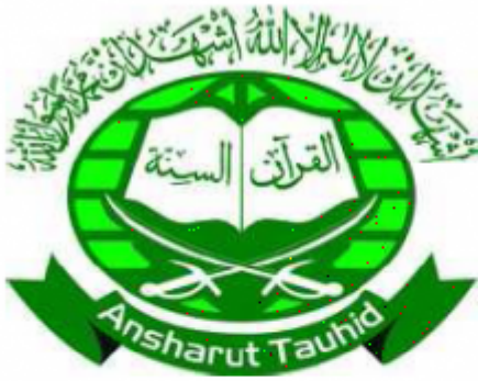
12. JEMMAH ANSHORUT TAUHID (JAT) P. 187