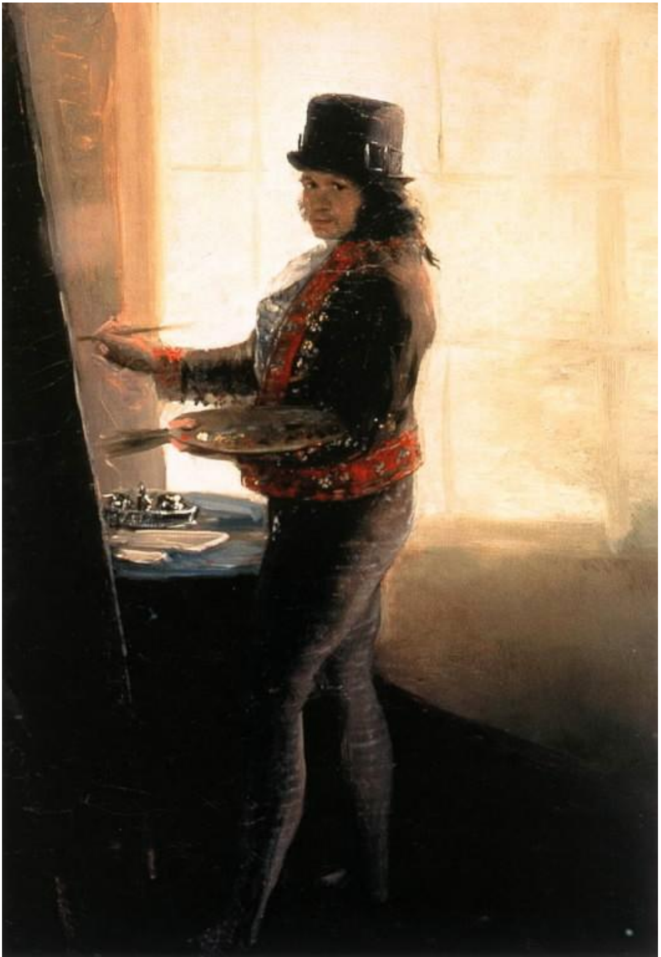
Goya, Autoritratto in piedi