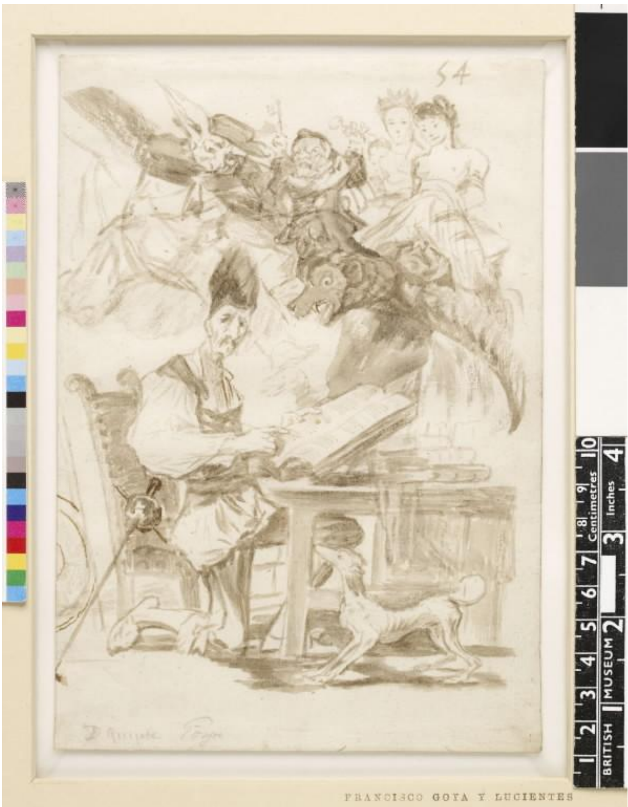
Goya, Don Chisciotte

La sua prima notte d'avventura, che don Chisciotte trascorre insonne, è una veglia d'armi nell'attesa dell'investitura a cavaliere. E se questa vigilia è destinata a concludersi solo verso l'alba, in un precipitare improvviso del tempo della