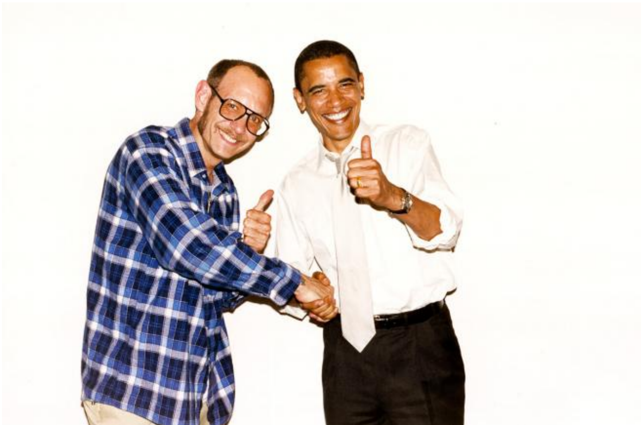
Terry Richardson e Barack Obama.

Cos'hanno in comune Barack Obama, Yoko Ono, Courtney Love, Catherine Deneuve, Paris Hilton e Miley Cyrus? Tutti loro hanno fatto una foto accanto a Terry Richardson, un uomo di mezza età che al loro fianco appare sempre sorridente e con il pollice alzato quasi a dire: "Eccomi qui! Ce l'ho fatta un'altra volta!" Chi è Terry Richardson? Sicuramente un fotografo, un blogger, un ex punk rocker, una figura di punta della cosiddetta scena alternative statunitense.