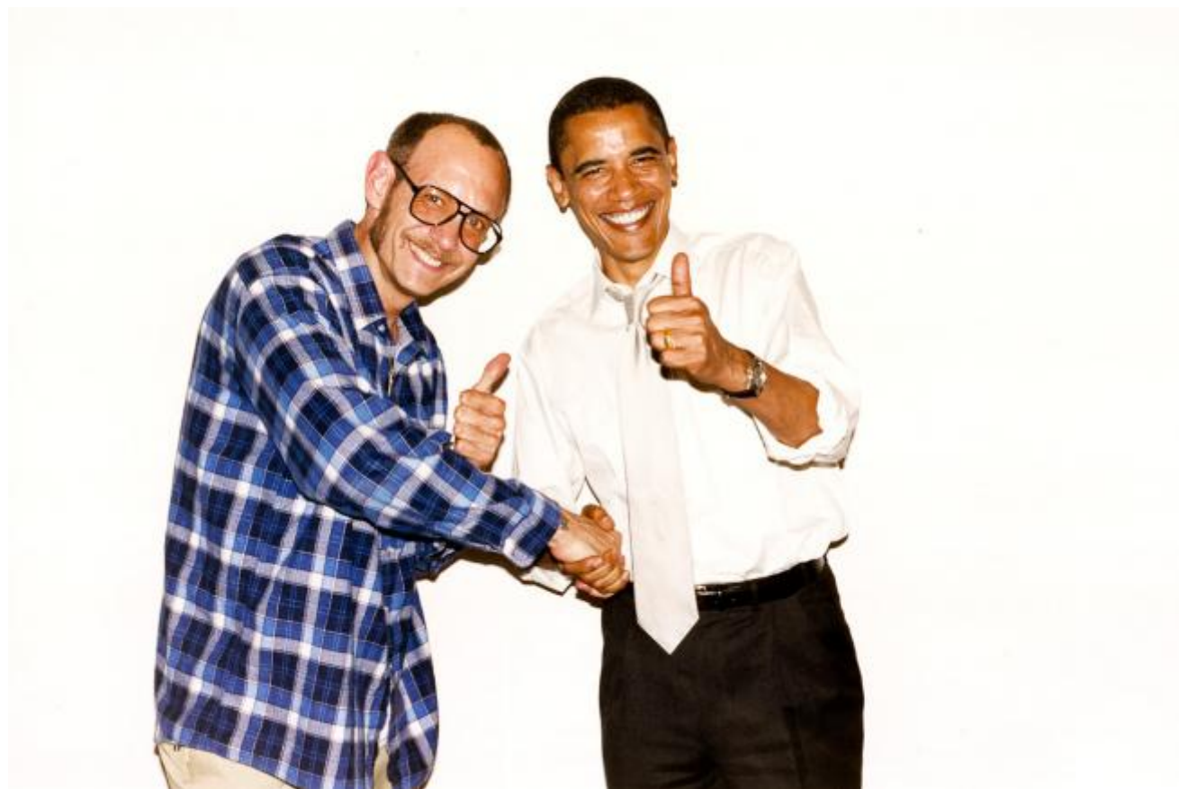
Terry Richardson e Barack Obama.

Cos'hanno in comune Barack Obama, Yoko Ono, Courtney Love, Catherine Deneuve, Paris Hilton e Miley Cyrus? Tutti loro hanno fatto una foto accanto a Terry Richardson, un uomo di mezza età che al loro fianco appare sempre sorridente e con il pollice alzato quasi a dire: "Eccomi qui! Ce l'ho fatta un'altra volta!" Chi è Terry Richardson? Sicuramente un fotografo, un blogger, un ex punk rocker, una figura di punta della cosiddetta scena alternative statunitense.