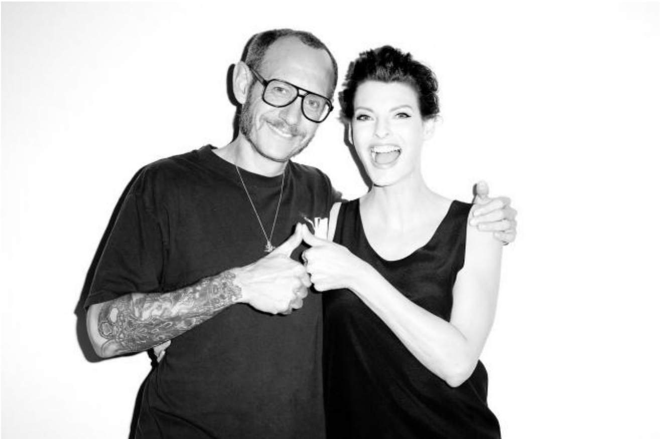
Linda Evangelisti e Terry Richardson.

Cos'è per l'esattezza il mondo di Terry? E' forse il mondo visto dagli occhi disincantati di un teenager? Forse sì. Lui di fatto si comporta in ogni scatto come un teenager che incontra la sua star preferita nei camerini dopo un concerto. Questa sensazione di foto rubata alla star di turno è molto forte nonostante la consapevolezza che Terry Richardson è anch'egli una celebrità.