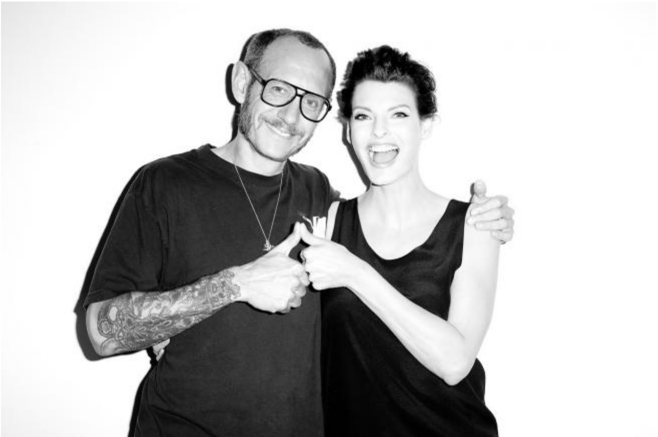
Linda Evangelisti e Terry Richardson.

Cos'è per l'esattezza il mondo di Terry? E' forse il mondo visto dagli occhi disincantati di un teenager? Forse sì. Lui di fatto si comporta in ogni scatto come un teenager che incontra la sua star preferita nei camerini dopo un concerto. Questa sensazione di foto rubata alla star di turno è molto forte nonostante la consapevolezza che Terry Richardson è anch'egli una celebrità.