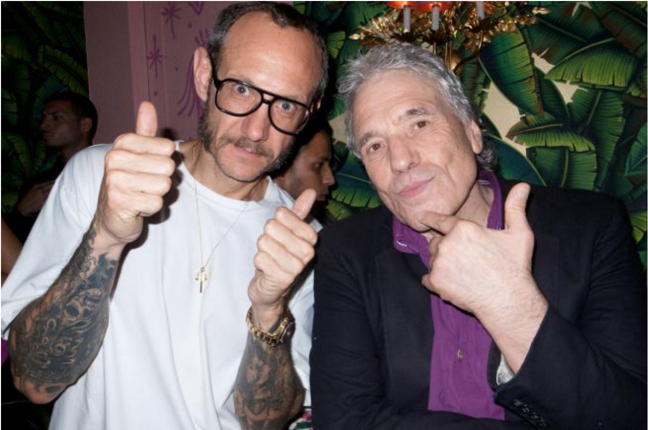
Terry Richardson e Abel Ferrara.

Nei giorni in cui guardavo il suo blog era la volta di Abel Ferrara, Linda Evangelista e Jared Leto. Per tutti e tre abbiamo la stessa sequenza. Prima gli scatti canonici, sostanzialmente delle foto di moda, poi delle foto buffe, quelle che di solito si fanno ai compagni di liceo nelle gite scolastiche, ed infine la solita foto a due, abbracciati e sorridenti coi pollici alzati. Perché questa foto, sempre uguale, ripetuta all'infinito all'interno del blog? Se scorriamo il diario a ritroso nel tempo, si viene presi da una sorta di vertigine.