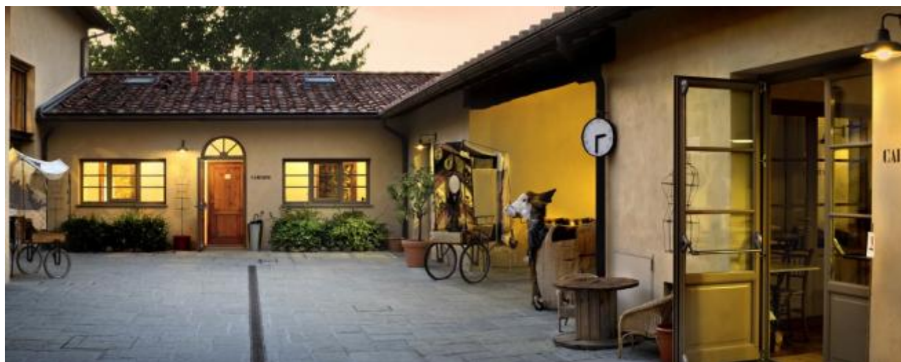
Il Funaro.

Quasi totalmente autofinanziato, il Funaro corre sul doppio binario di progetti internazionali (fra i motivi del conferimento del Premio Speciale Ubu 2012) e di un'intensa attività culturale per la città di Pistoia e il territorio toscano, declinando la sua vocazione “glocale” nella programmazione di spettacoli, di workshop professionali con Maestri internazionali, di attività di residenza teatrale e di produzione, di corsi e laboratori per adulti e bambini.