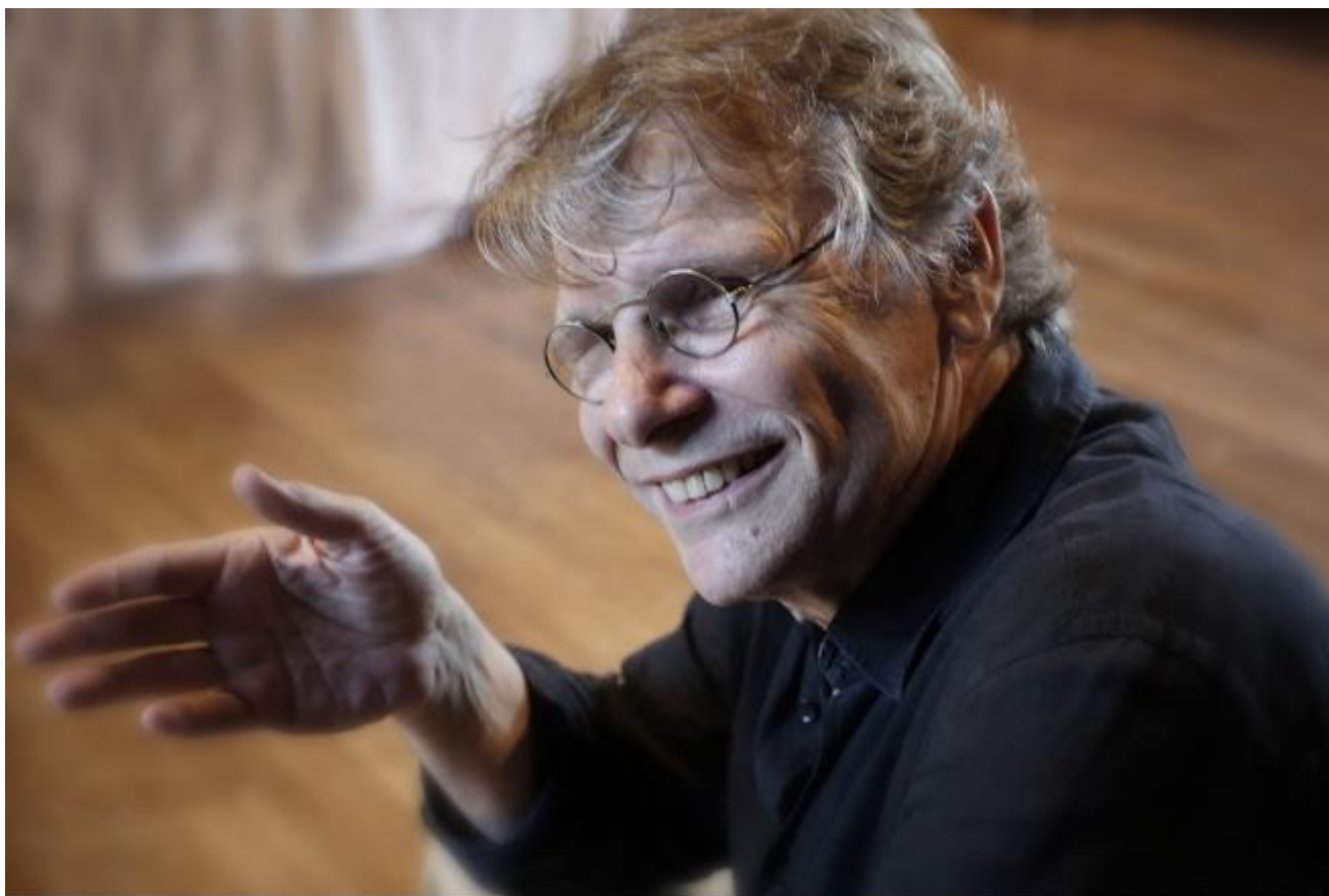
Daniel Pennac.