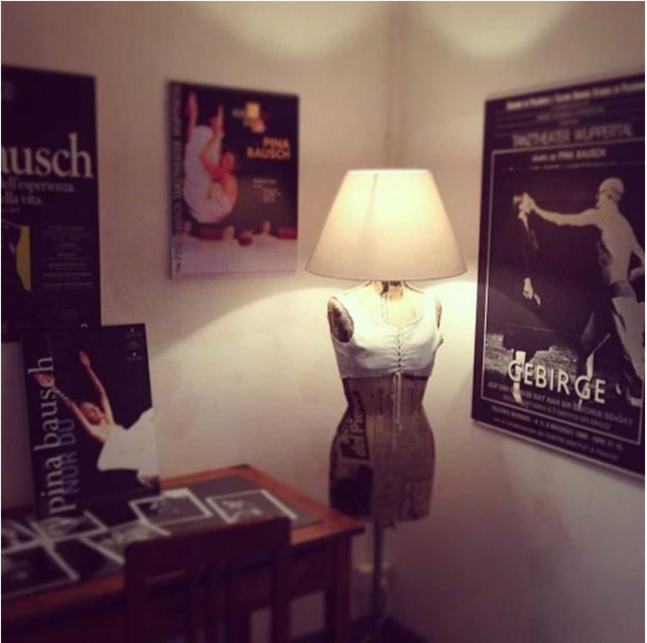
Il Funaro Fondo Andres Neumann.

stato – afferma Massimiliano – adesso sembra che la biblioteca esista dagli anni Settanta. Non è vero, certo, ma è come se lo fosse”.