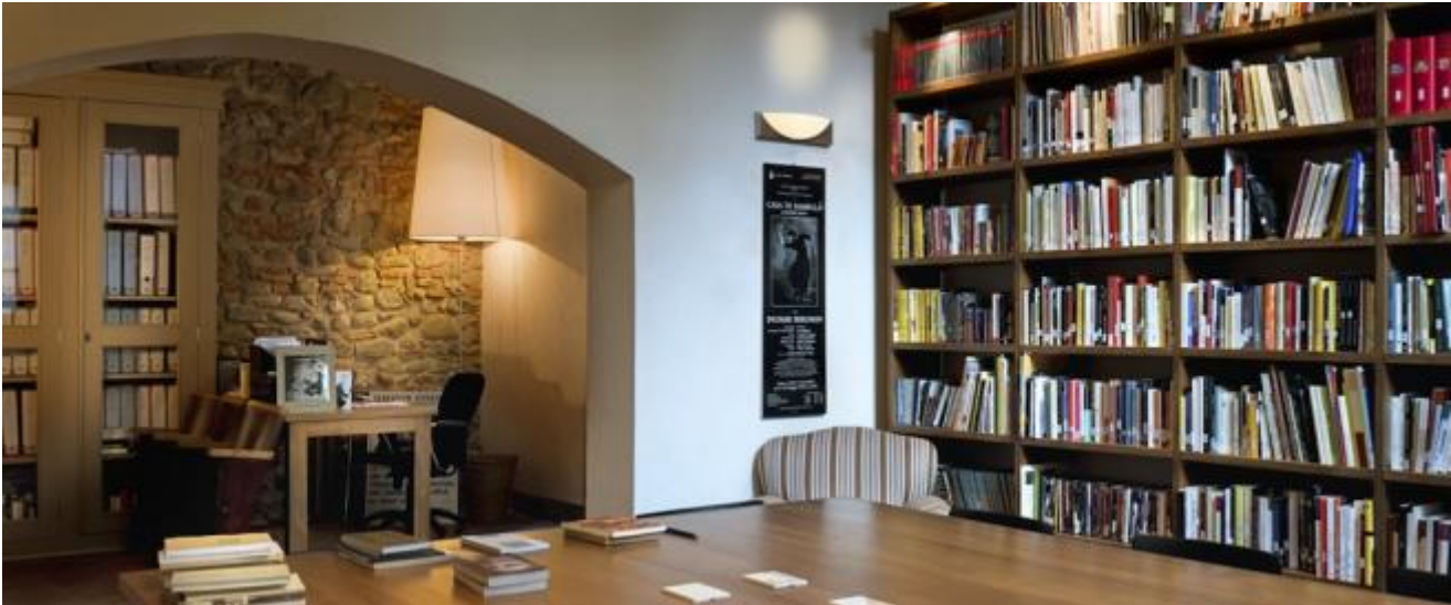
Il Funaro, Biblioteca.