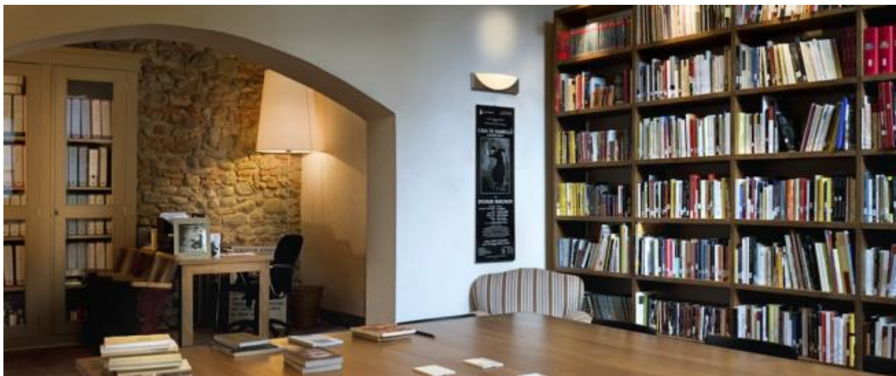
Il Funaro, Biblioteca.