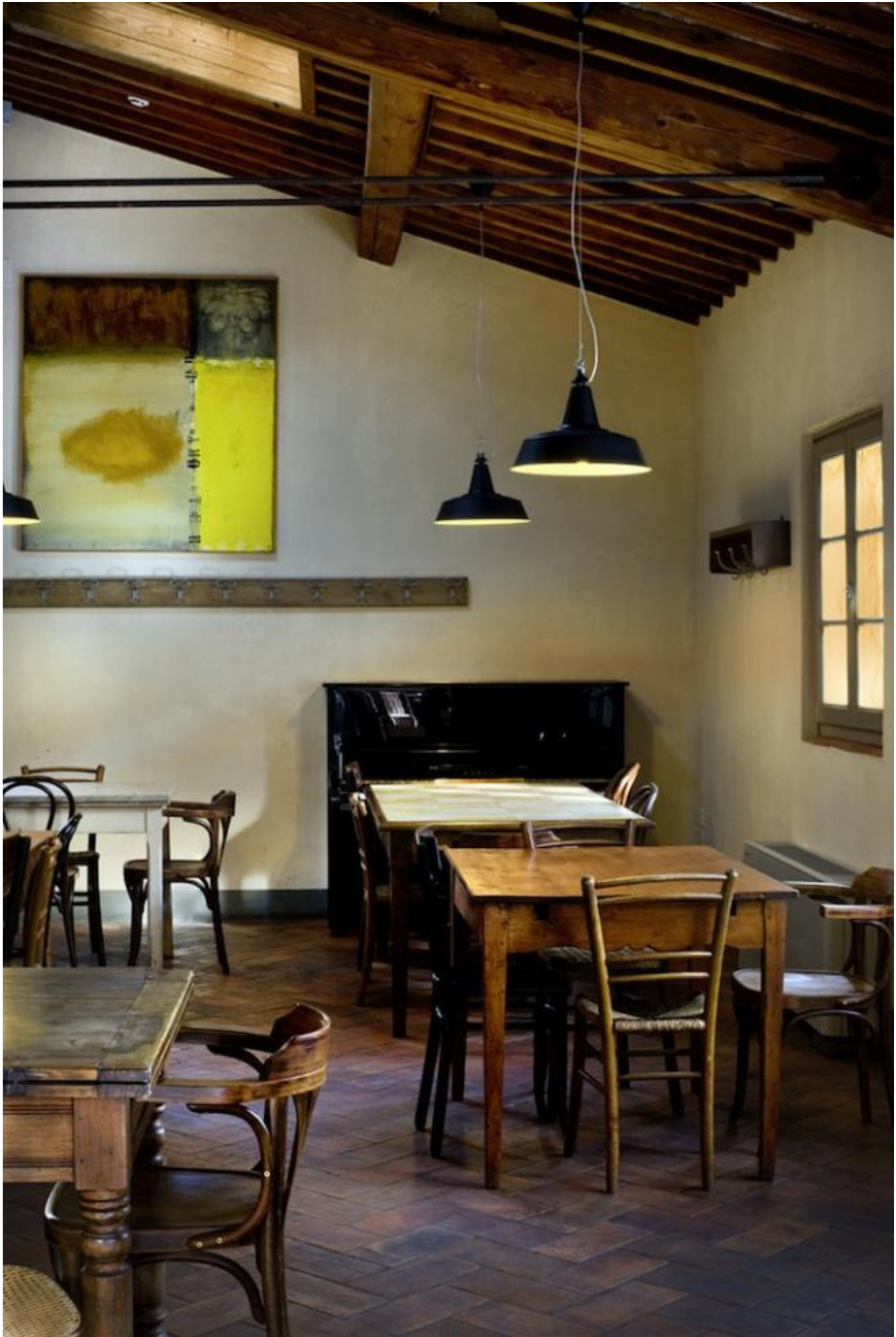
Il Funaro, Caffetteria.