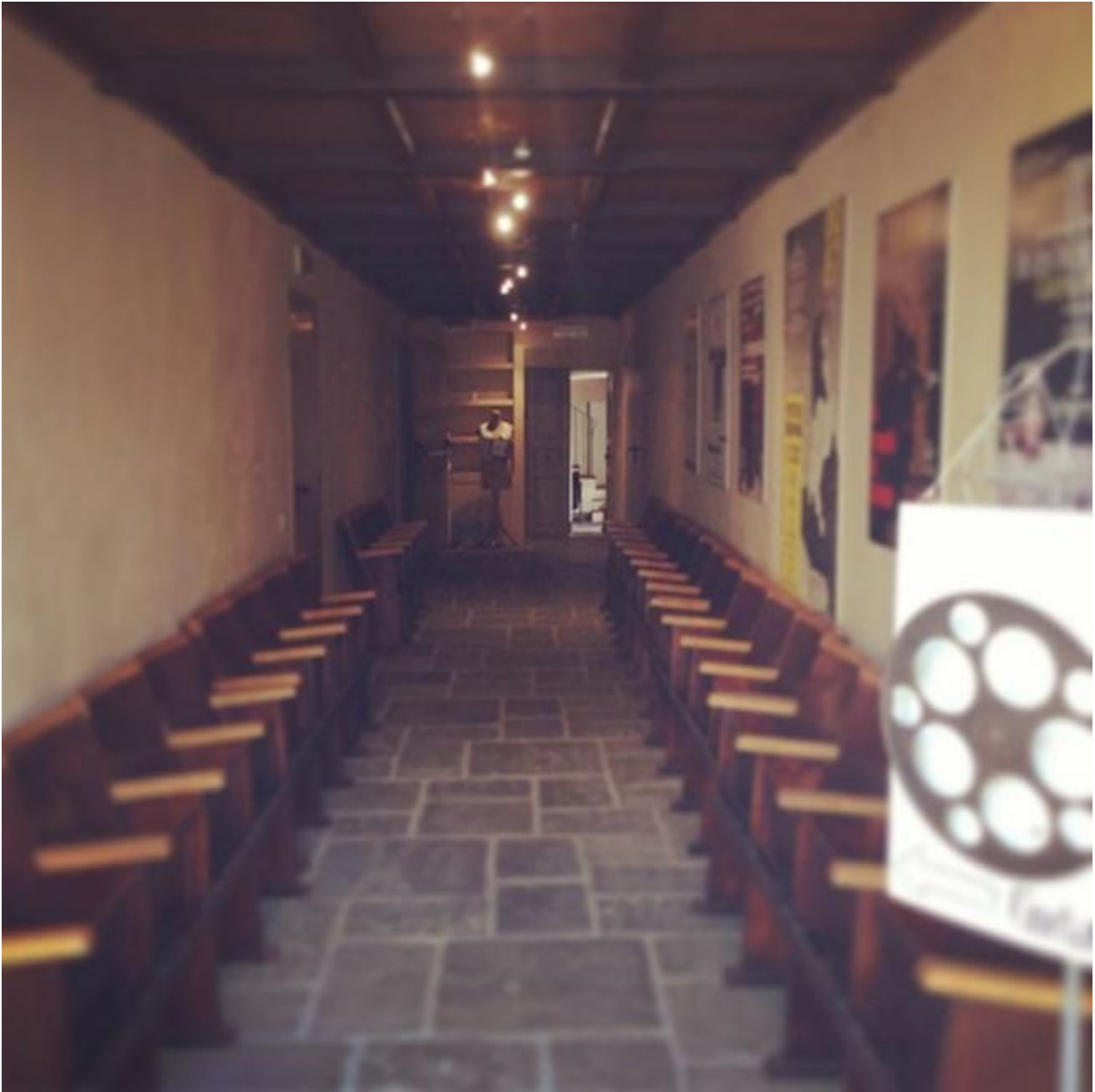
Il Funaro, Foyer.