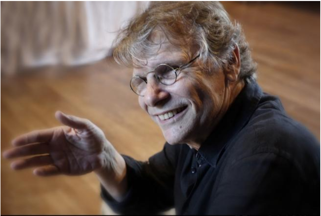
Daniel Pennac.