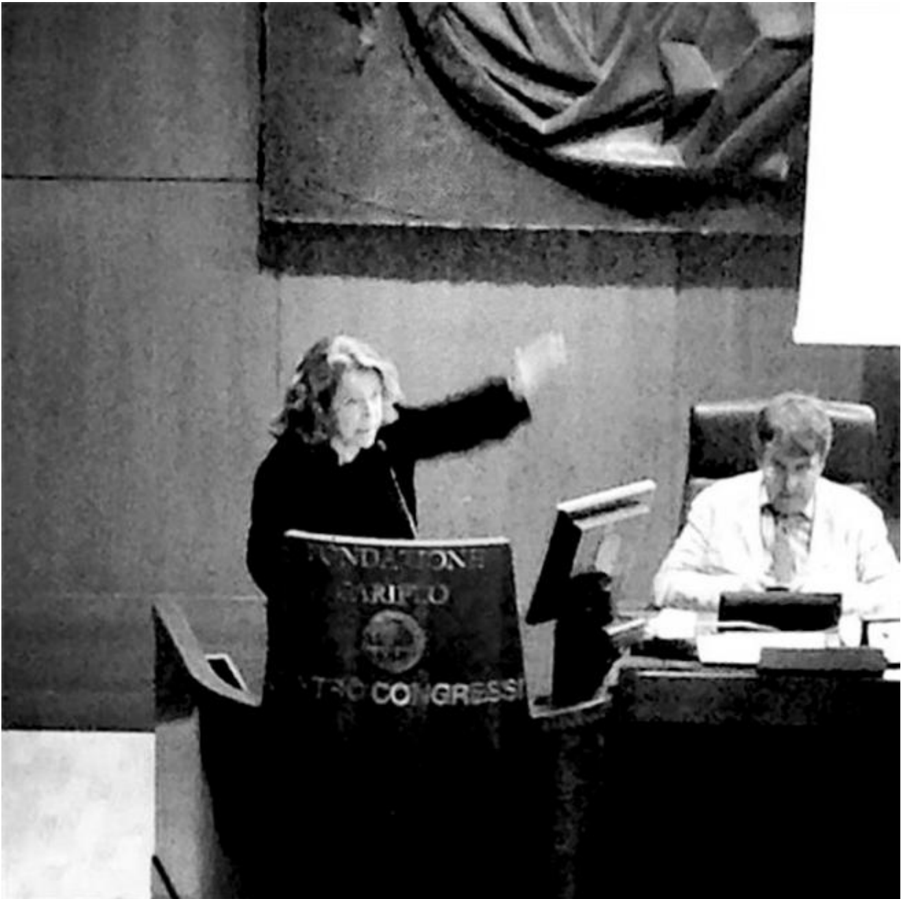
Andrée Ruth Shammah

La parola d'ordine è, ovviamente, trasparenza; ma ancora non viene chiarito come un simile auspicio possa diventare realtà concreta. Tra le buone intenzioni vanno menzionati anche la volontà di rendere più semplice l'accesso ai finanziamenti per le nuove compagnie e l'incentivo previsto per chi ospita artisti sotto i 35 anni. E ancora: la messa in rete dei circuiti regionali; l'apertura alle residenze; un incoraggiamento concreto all'internazionalizzazione e alla mobilità artistica.