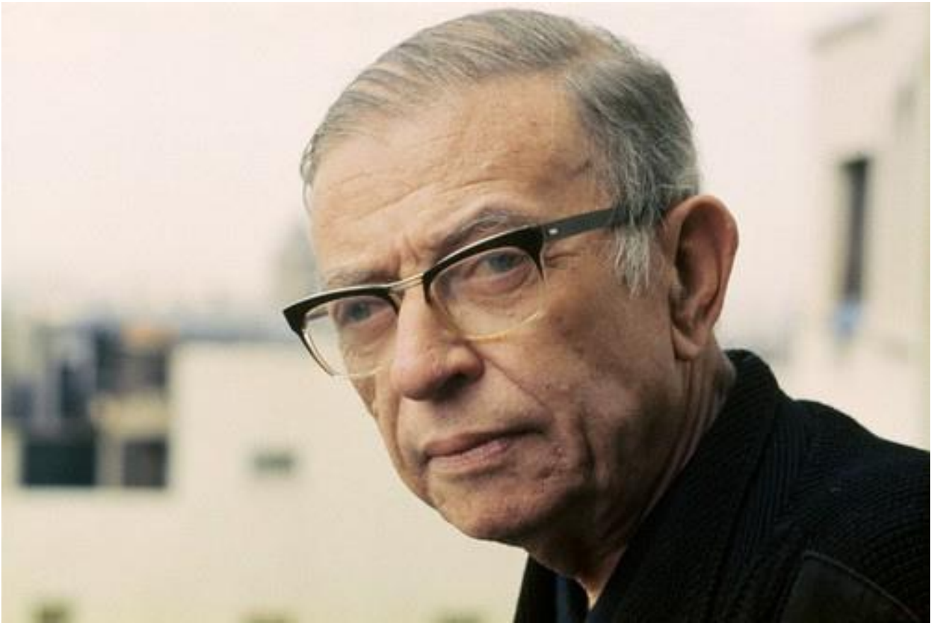
Jean Paul Sartre

Nella rilettura kojèviana della Fenomenologia , la dialettica della storia si fonda sul desiderio di riconoscimento. Il desiderio è desiderio dell'altro, di ciò che l'altro desidera ed insieme desiderio che l'altro ci desideri: "umano è desiderare quel che desiderano gli altri", ad anticipare il desiderio mimetico di Girard. Da Marx Kojève trae un'antropologia secolarizzata in cui, attraverso la Lotta ed il Lavoro, si compie la trasformazione che, liberando il Servo dalla natura, lo libera dalla sua natura di Servo. Si tratta (lo noterà Derrida) di rifondare in senso non metafisico la "realtà umana", come farà Sartre: L'Essere e il nulla (1943) accoglie la lezione di Kojève per cui la relazione con la mera oggettività rischia di annullare l'uomo nelle cose, di sprofondarlo nella "nausea". La coscienza scopre la propria autenticità solo quando è vista dall'Altro, come nelle famose pagine de L'essere e il nulla dedicate alla vergogna.