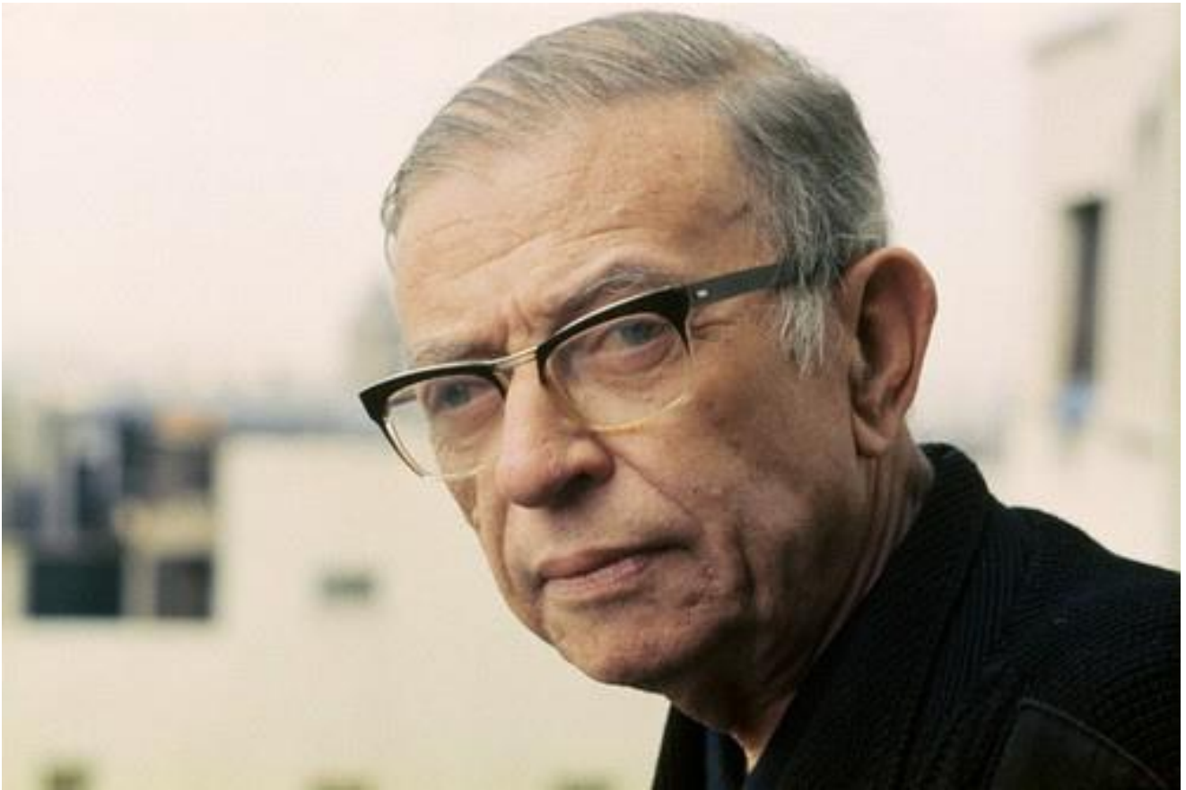
Jean Paul Sartre

Nella rilettura kojèviana della Fenomenologia , la dialettica della storia si fonda sul desiderio di riconoscimento. Il desiderio è desiderio dell'altro, di ciò che l'altro desidera ed insieme desiderio che l'altro ci desideri: "umano è desiderare quel che desiderano gli altri", ad anticipare il desiderio mimetico di Girard. Da Marx Kojève trae un'antropologia secolarizzata in cui, attraverso la Lotta ed il Lavoro, si compie la trasformazione che, liberando il Servo dalla natura, lo libera dalla sua natura di Servo. Si tratta (lo noterà Derrida) di rifondare in senso non metafisico la "realtà umana", come farà Sartre: L'Essere e il nulla (1943) accoglie la lezione di Kojève per cui la relazione con la mera oggettività rischia di annullare l'uomo nelle cose, di sprofondarlo nella "nausea". La coscienza scopre la propria autenticità solo quando è vista dall'Altro, come nelle famose pagine de L'essere e il nulla dedicate alla vergogna.