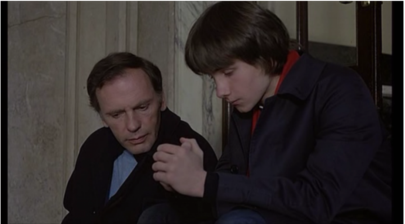
da Colpire al Cuore di Gianni Amelio