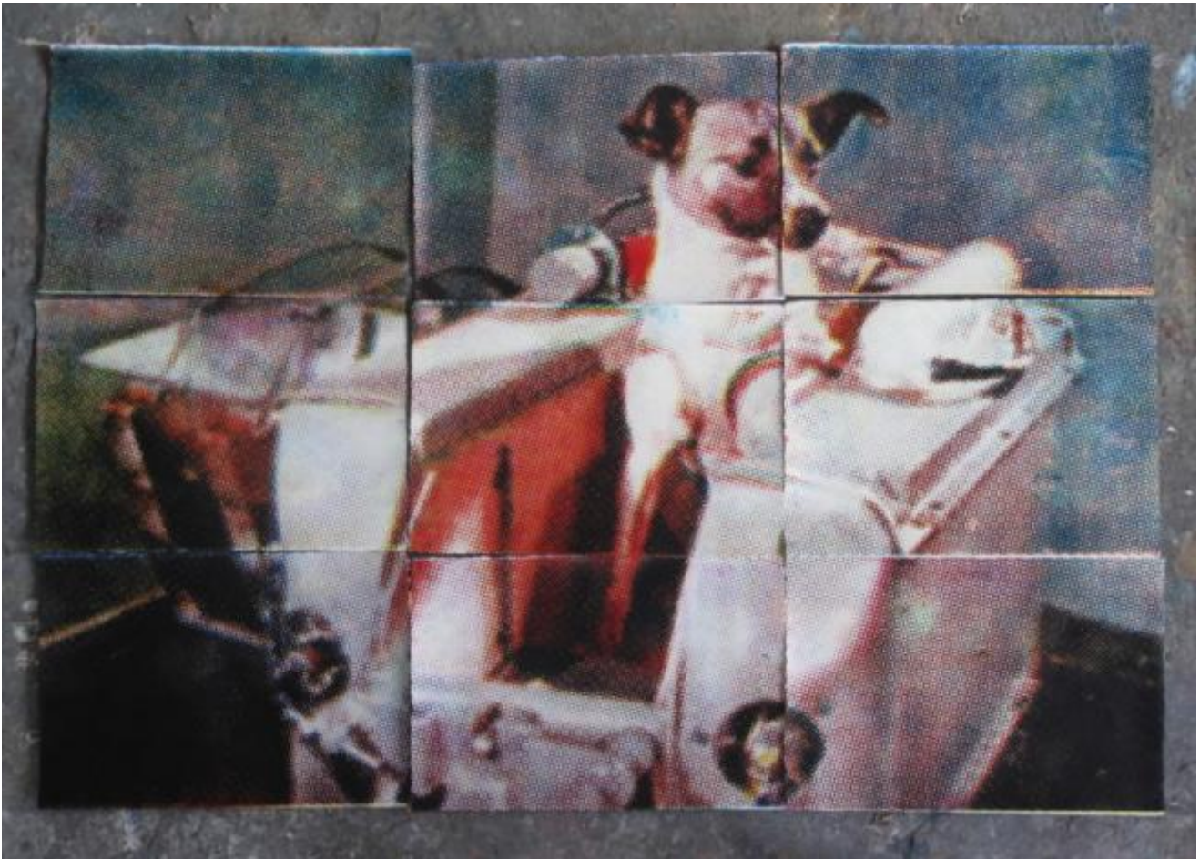
Stefano Minzi, Leika

Un approccio utopico, se ci affidiamo a un passo straordinario di Ernst Bloch: “La coscienza utopica vuole spingere lo sguardo molto in là, ma in ultima analisi solo al fine di penetrare la vicinissima oscurità dell’attimo appena vissuto, in cui tutto ciò che è, è tanto operante quanto nascosto a se stesso. In altre parole si ha bisogno del cannocchiale più potente, quello della coscienza utopica levigata, per penetrare proprio la prossimità più vicina” ( Il principio speranza ).