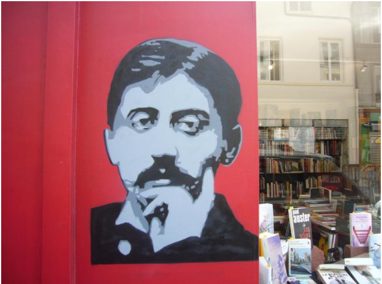
Una libreria di Parigi (11 ième arrondissement)

Agli occhi di uno straniero, soprattutto di un italiano che si è rassegnato da tempo alla scomparsa della letteratura dalla tv, questa forte mediatizzazione di un classico su cui si è già detto tutto e il contrario di tutto fa uno strano effetto. Sta di fatto che Du côté de chez Swann , il primo dei sette tomi che compongono questa "gigantesca miniatura" che è À la recherche du temps perdu , ha compiuto 100 anni lo scorso 14 novembre 2013, ed è impossibile non rendersene conto. Le edicole parigine sono invase da numeri speciali ( hors-série ) dedicati all'autore ed è raro trovare delle librerie che non espongano tutte le pubblicazioni uscite quest'anno in occasione del centenario: le lettere inedite alla sua vicina di casa, una riedizione di Un amour de Swann illustrata da Pierre Alechinsky , un libro che illustra il rapporto (talvolta complicato) tra lo scrittore e il suo nemico/amico Jean Cocteau e addirittura un saggio sulle sue ultime ore di vita.