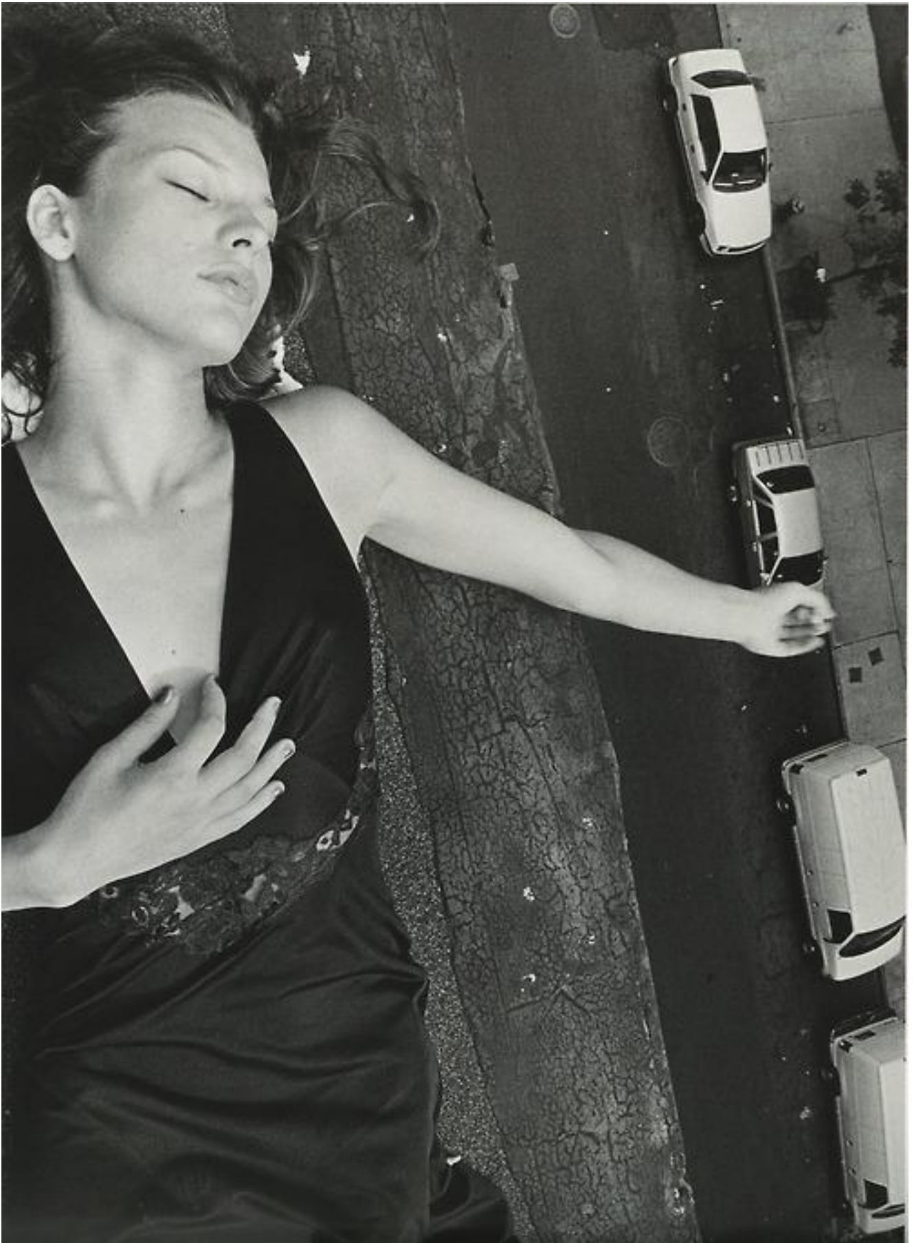
Milla Jovovich.