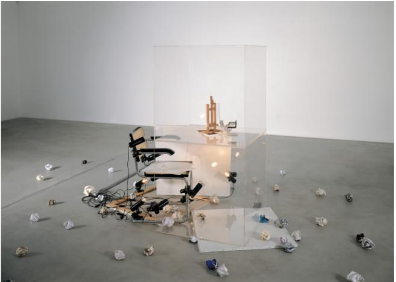
Giulio Paolini Big Bang , 1997-98 Allestimento Kunstmuseum Winterthur, Winterthur, 2005 Foto Paolo Mussat Sartor Giulio Paolini

Delfo IV e Big Bang sono le due facce della stessa medaglia. Entrambi ritratti e autoritratti. Sintesi dell'idea della creazione artistica, eccedono l'identità del singolo.