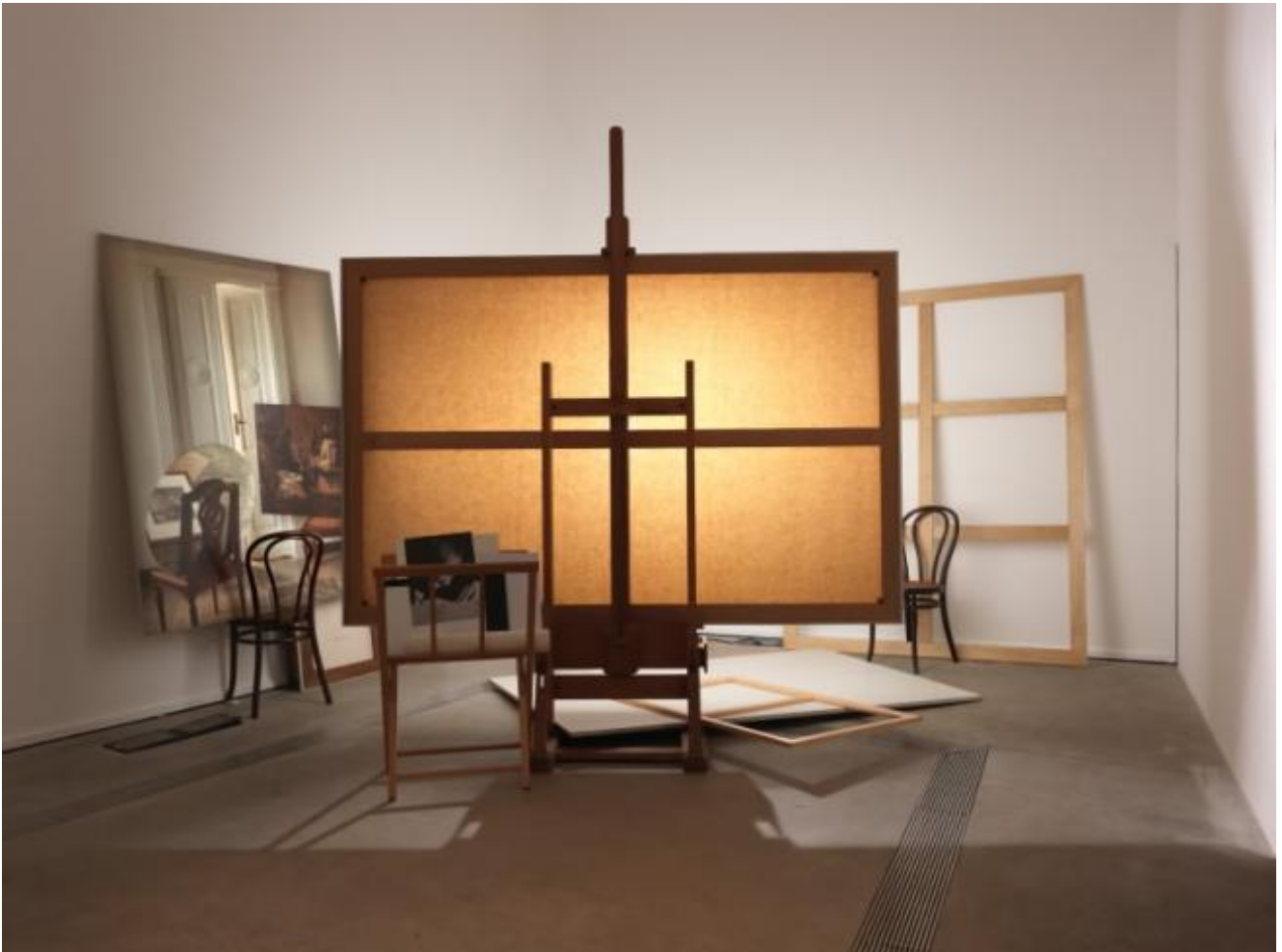
Giulio Paolini L'ospite , 1999 Allestimento della mostra Essere o non essere , MACRO, Roma 2013

Nel ragionamento di Paolini dunque se l'originalità non afferisce all'autore, compie un passo indietro e la creazione è al di fuori del sé: qualcosa che colpisce l'artista e che l'artista rivela. Come dobbiamo allora intendere qui l' Essere o non essere , il dilemma che immobilizza Amleto di fronte alla scelta tra l'agire e il non agire - vivere o morire -, titolo di un'opera e della mostra stessa?