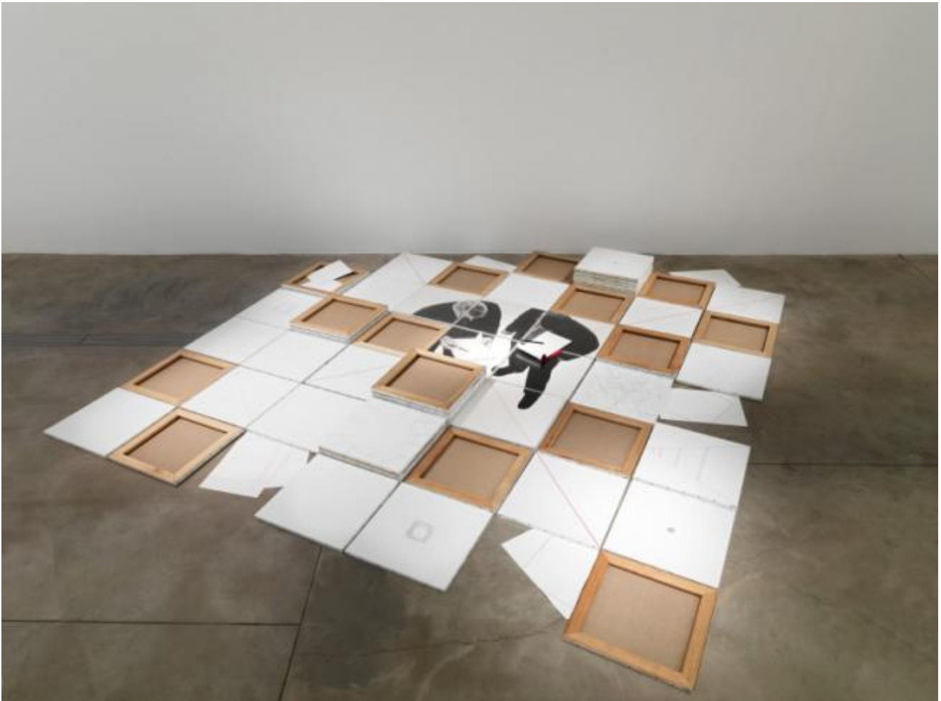
Giulio Paolini Essere o non essere, 1994-95 Allestimento della mostra Essere o non essere, MACRO, Roma 2013

Essere o non essere (1994/95), è una composizione di tele quadrate, disposta in terra. L'immagine è a volte visibile, altre celata. La tela è rivolta sul pavimento o assente. Si intravedono due uomini, ripresi dall'alto, intenti forse a progettare qualcosa. Guardano entrambi un foglio bianco. Due linee ortogonali si diramano verso l'esterno e fuori dalla tela un vero blocco di carta con una matita irrompe nella sfera del reale.