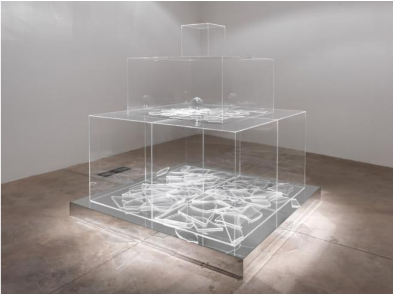
Giulio Paolini Immacolata Concezione. Senza titolo / Senza autore, 2007-08 Allestimento della mostra Essere o non essere , MACRO, Roma 2013

Ribadiscono il concetto le altre opere. Tutte declinano in forme diverse l'oscillazione tra l'ordine geometrico dell'immagine e il disordine del reale, il ruolo dell'artista, silente strumento, sguardo sulla realtà e una creazione che si fa da sé. Così i parallelepipedi trasparenti, disposti uno sopra all'altro come in una piramide, di Immacolata Concezione, senza titolo / senza autore (2007-2008), traducono il passaggio divino dal caos all'ordine. Contemplator enim (osservatore infatti), elabora l'immagine dell'artista valletto, portatore di una visione che non compare, sempre riqualificabile. L'Ospite (1999), opera ispirata a Las Meniñas (1656) di Velázquez, come quest'ultima contiene il suo centro fuori dallo spazio dell'opera, sovrapponendo, per dirla con Michel Foucault, "lo sguardo del modello [...] dello spettatore [...] del pittore". Parallelismo già usato da Jörg Heiser (2010) in riferimento all'opera di Paolini L'ultimo quadro di Velázquez del 1968.