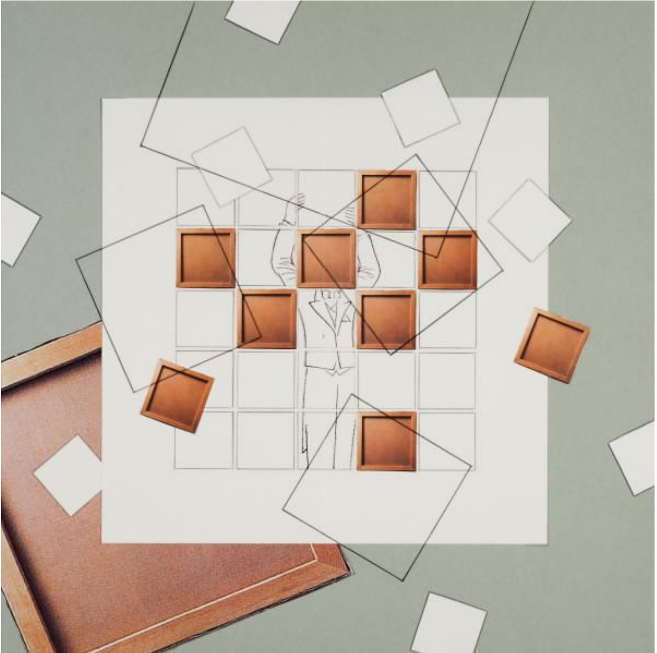
Giulio Paolini Segni particolari, 1996-2013