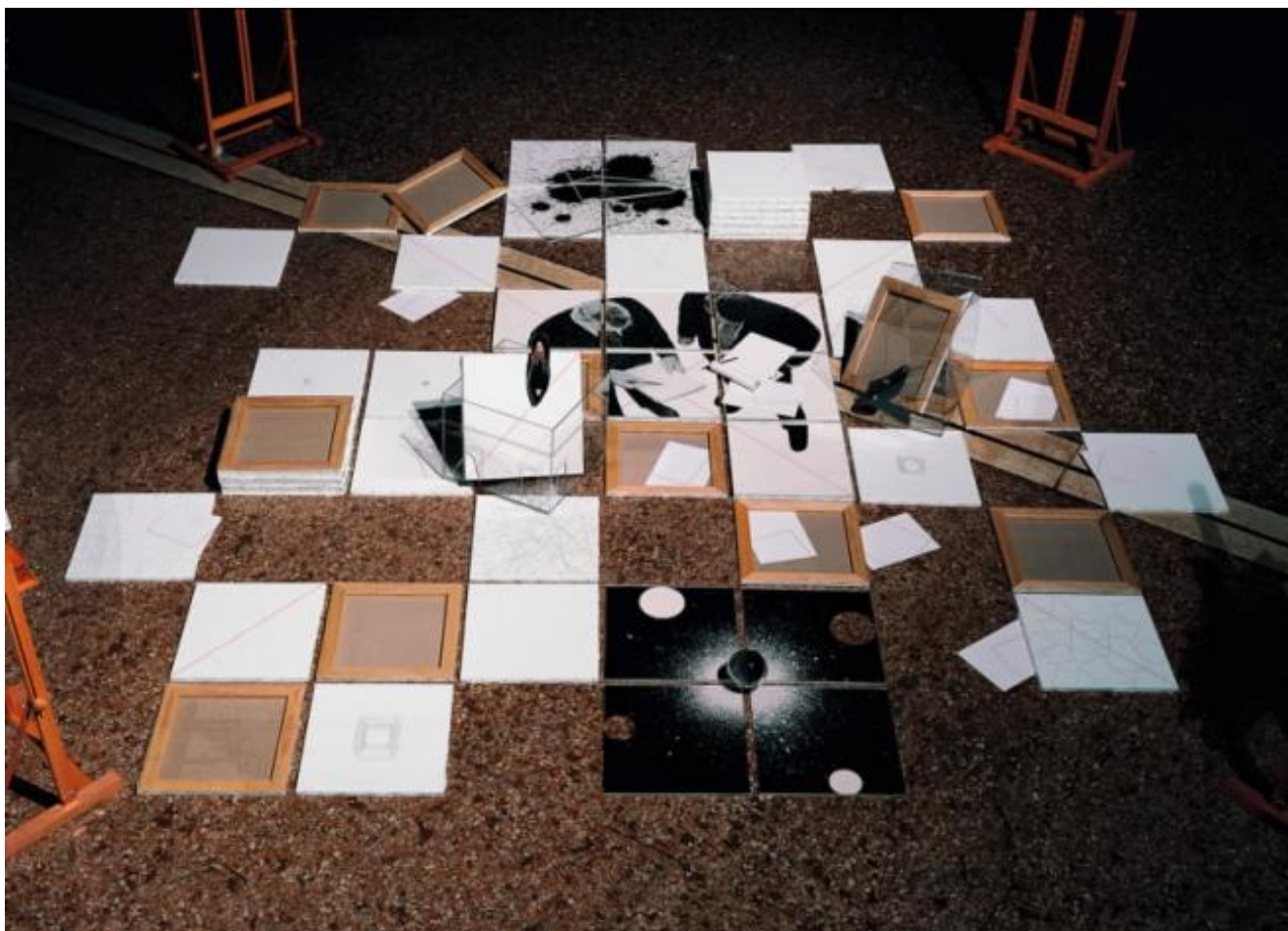
Giulio Paolini Essere o non essere, 1994-95 Allestimento Salone della Ragione, Padova, 1995

C'è una foto. Un uomo è affacciato alla ringhiera di un balcone. Il parapetto è in ferro battuto. L'uomo è distante. Se ne scorgono appena le sembianze. L'artista fotografa se stesso, poi, nello stesso punto, la sua immagine. La porta finestra è così chiusa e impedisce lo sguardo sull'interno: lo studio d'artista.