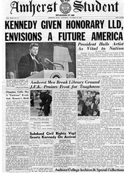
John F. Kennedy all'Amherst College

Insomma, se quella di Obama è solo una battuta, tradisce nondimeno il disco rotto del capitalismo finanziario, secondo cui una buona educazione – come gran parte delle attività umane – si misura esclusivamente col suo rendiconto economico. E' la stessa logica che porta a considerare il patrimonio artistico come un bene da sfruttare economicamente piuttosto che come elemento identitario di una comunità.