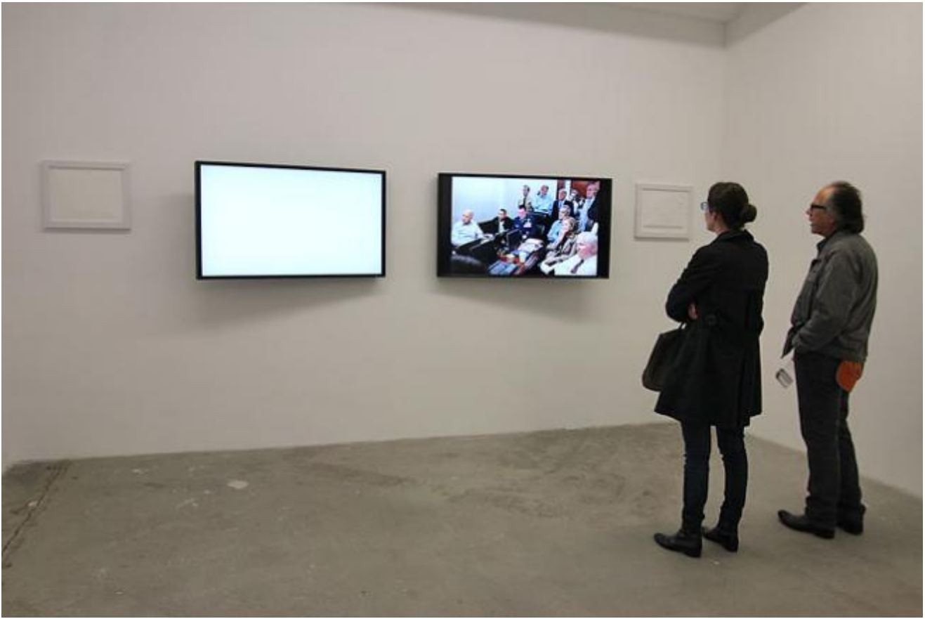
May 1, 2011, Alfredo Jaar