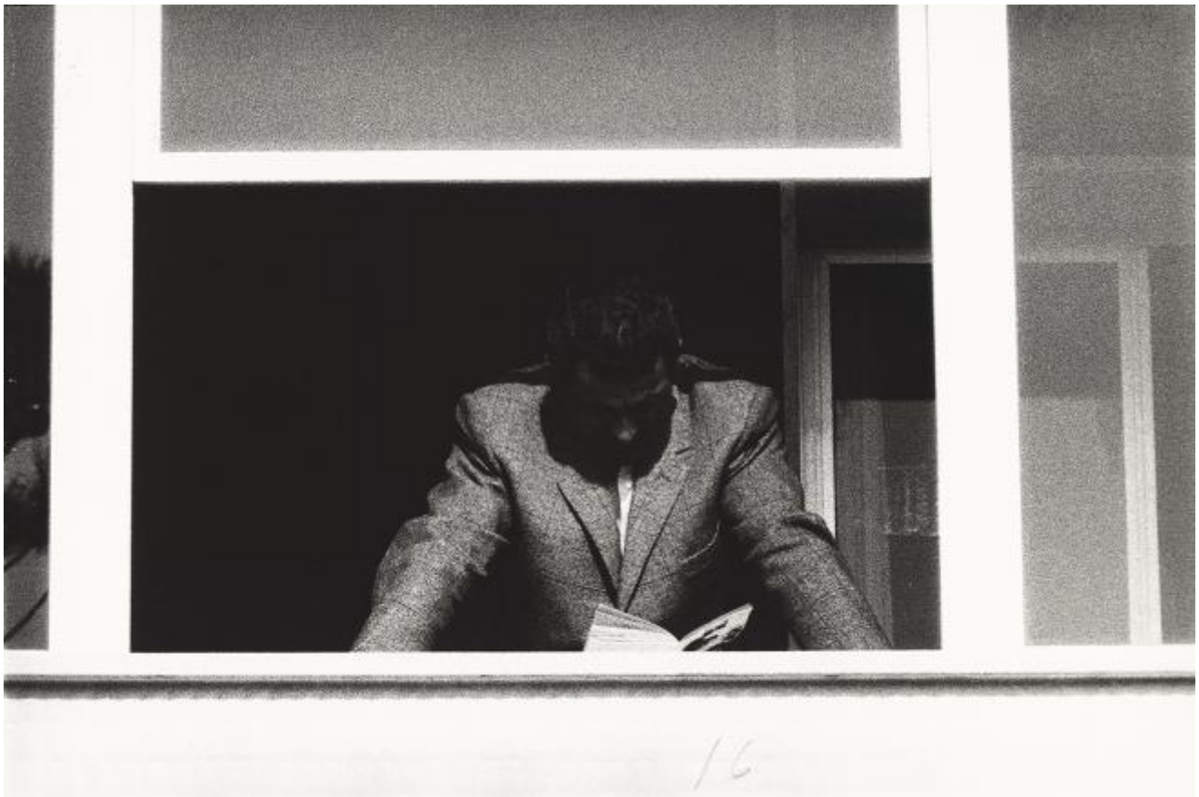
Appunti per una lezione

«Alla fine degli anni Sessanta ho iniziato a fotografare gli amici, le case, i luoghi dove sono nato, e dall'inverno del 1983, dopo essermi costruito una rudimentale camera per pellicole 8x10 pollici, ho lavorato ad alcuni progetti. Credo che non avrei iniziato nessuno di questi lavori se lì non avessi trovato almeno un sasso.»