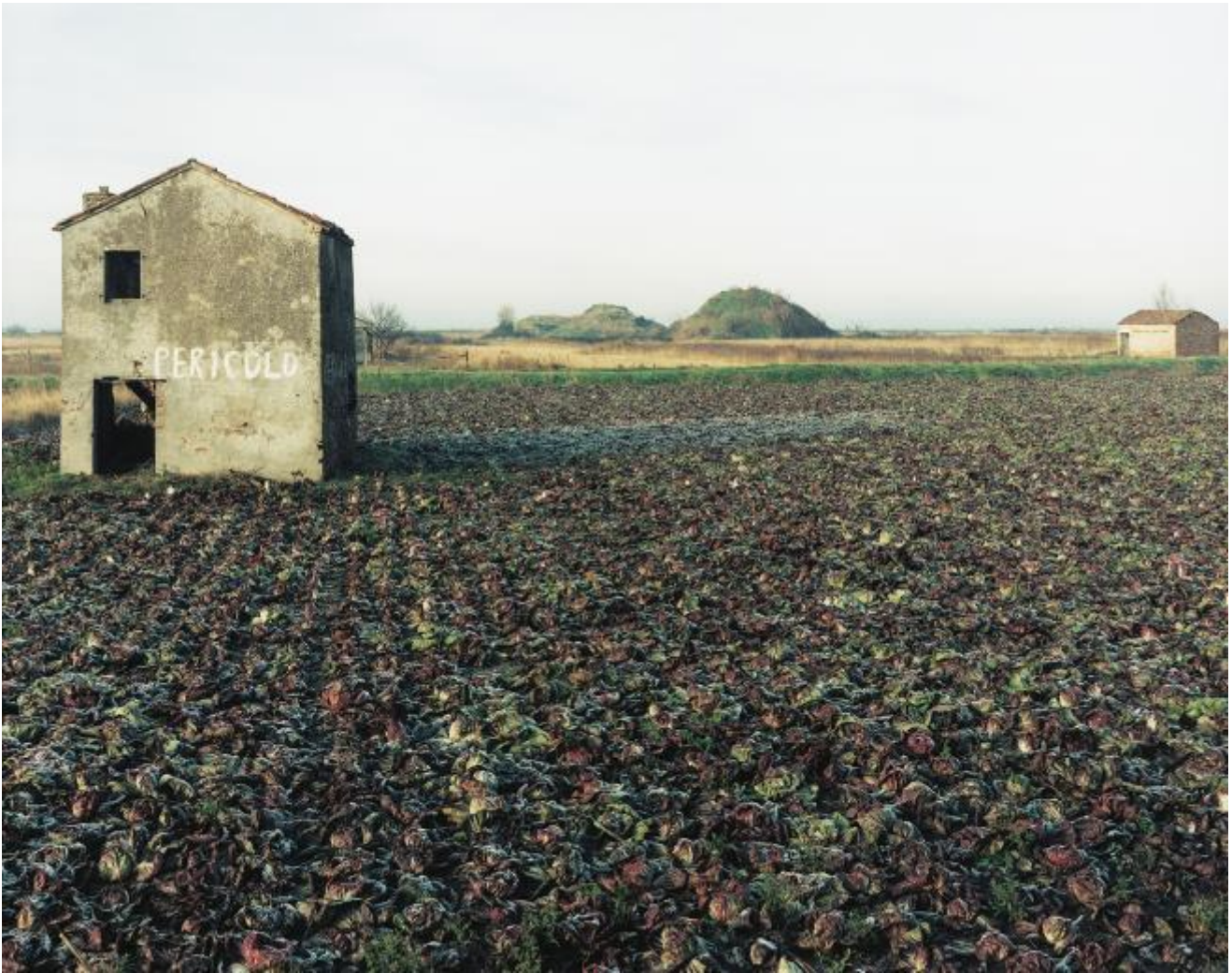
Via Romea, vicino a Chioggia, 1987