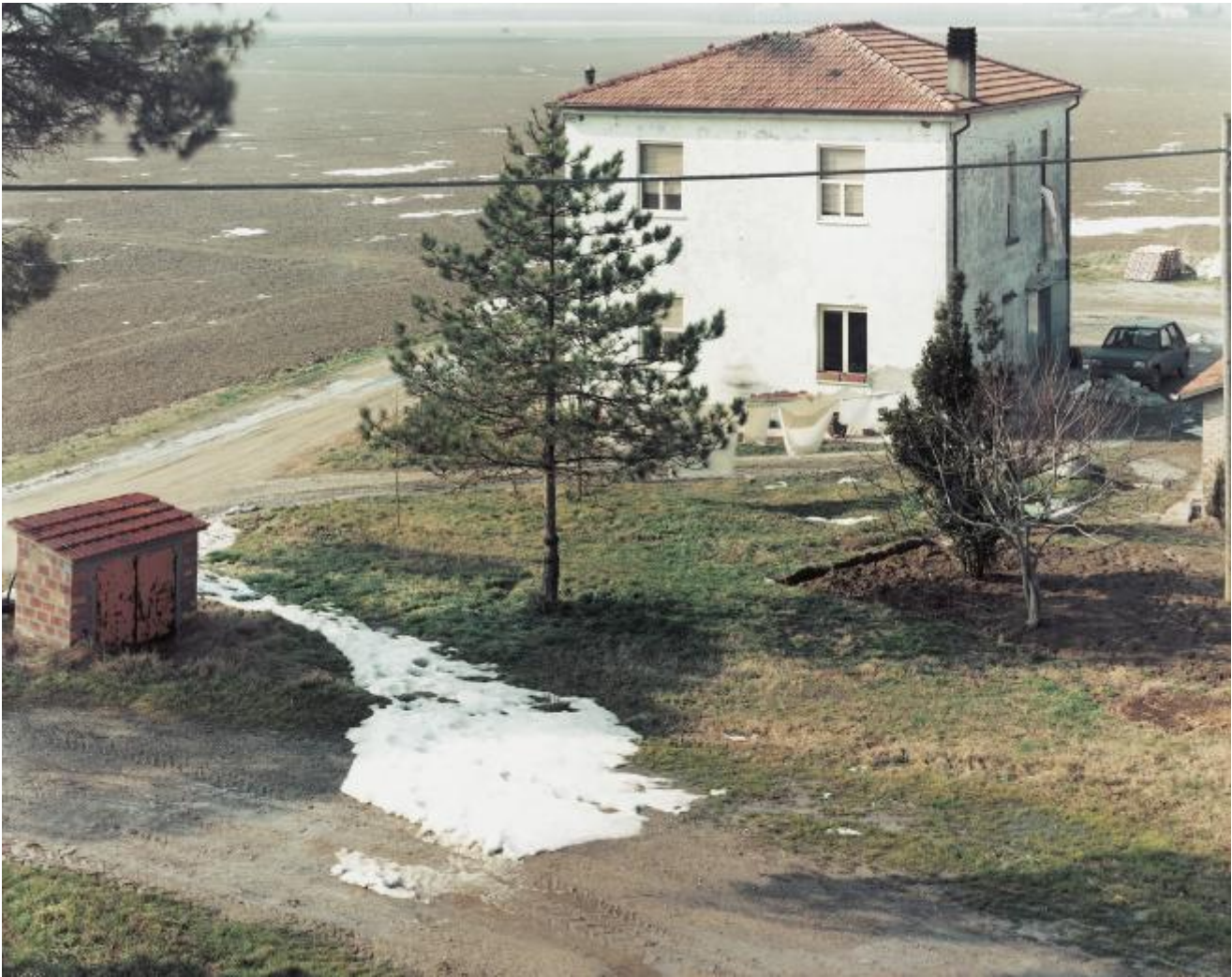
Via Romea, Km. 246,700, vicino a Borgo Faina, Ravenna 1991

Quella di Guidi è una ricerca condotta in 'luoghi imprecisi' che tracimano costantemente in luoghi esperienziali, come sosteneva Nabokov: «L'individuazione di questi sviluppi tematici che corrono nella vita di un individuo dovrebbe essere, a parere mio, il vero scopo dell'autobiografia.» Il mondo come lo conosciamo sta passando. Il paesaggio rurale, lineare, industriale, la densità storica e perfino quella dell'urbanizzazione diffusa.