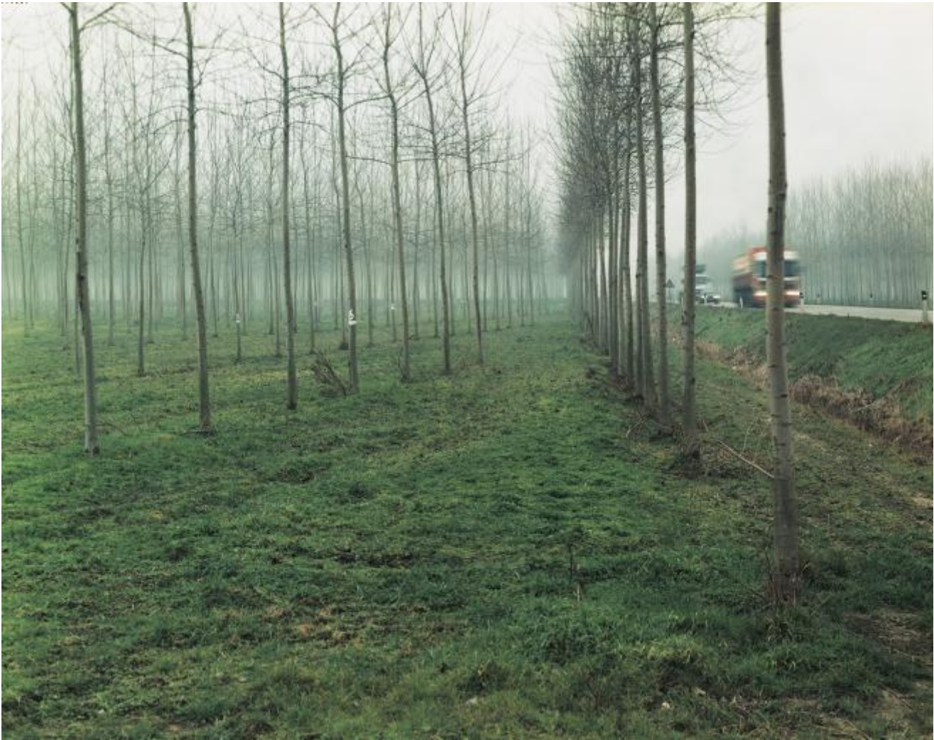
Via Romea, Mesola, Parco Regionale del Delta del Po, 1985

Ha inteso bene questo elemento dell'opera di Guidi lo scrittore Giorgio Falco, che scrive (su Repubblica, il 9 agosto 2011) una definizione quanto mai precisa: «Possiamo dire che l'opera di Guidi sia la sommatoria di due sottrazioni: gli avanzi del mondo contadino e le scorie del mondo industriale. Due sparizioni restano nella materia residuale, declinante, e sono l'Italia, il brulicare sommerso, l'intersecarsi dei segni, nei luoghi dell'abbandono.»