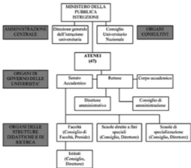
Fig. 2 – Schema dell'organizzazione del sistema universitario 1979 vs 2007

Maran, Laura, Economia e management dell'università . La governance interna tra efficienza e legittimazione. FrancoAngeli, 2009 - Business & Economics.