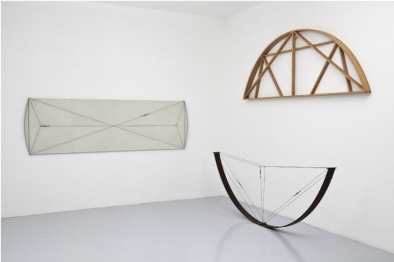
Gianfranco Pardi, Sistema , 1976

tracce della costruzione geometrica e una scultura che segue ancora la costruzione del pentagono. Nelle intenzioni dell'artista, si configurava come un tentativo di analisi della rappresentazione di un sistema costruttivo in rapporto alle specificità del disegno, della pittura e della scultura.