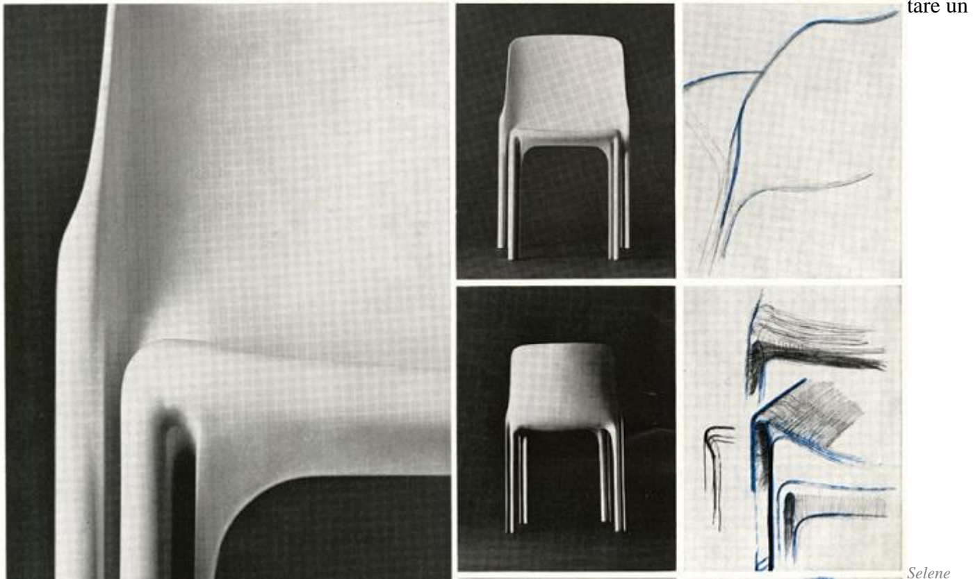
1968 Vico Magistretti Artemide, Heller

I casi selezionati da Cini Boeri sono tutti oggetti positivi, intelligenti, felici, che rimandano a una stagione vissuta dentro un sogno condiviso da un'intera collettività: il sogno di vivere dentro un miracolo. Un evento prodigioso calato in una società avviata verso un grande futuro.