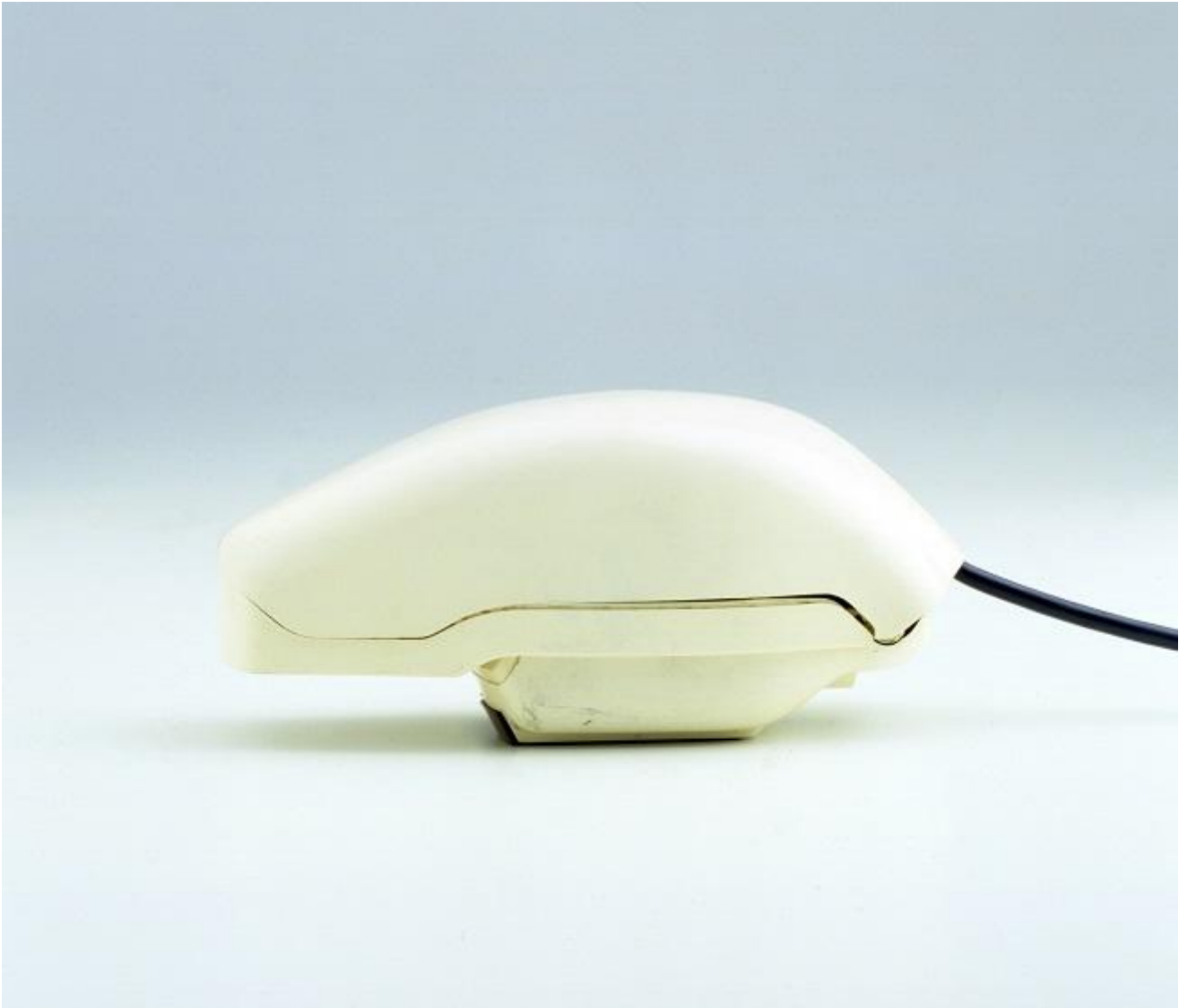
Grillo, 1967, Marco Zanuso - Sit Siemens

tipologia corrente del telefono, all'epoca ancora piuttosto recente. La forma compatta, minuta, il guscio chiuso a misura della mano, l'apertura a scatto al momento dell'uso lo proiettano nell'universo dei telefoni cellulari con straordinario anticipo.