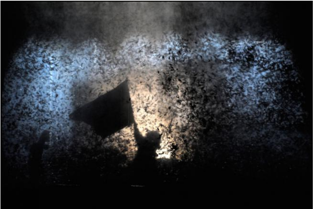
ph. Christian Berthelot