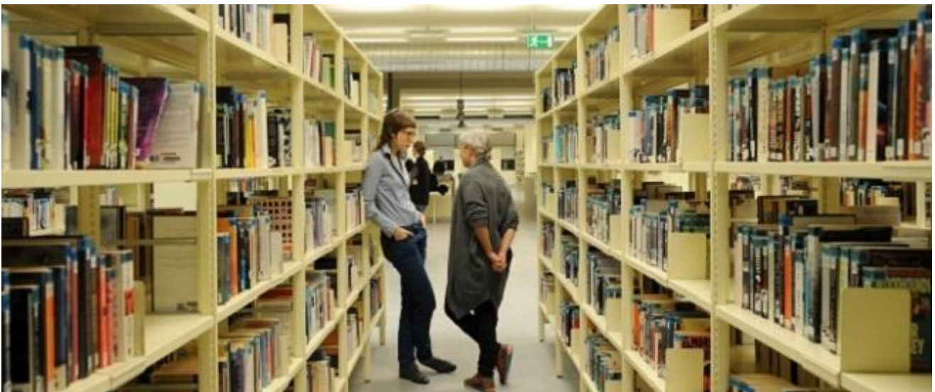
Fallen Asleep In The Afternoon Sunshine, Mette Edvardsen

La ricerca della Edvardsen coinvolge però anche il testo letterario, la parola scritta. La performer da un po' di anni gira l'Europa con Time has fallen asleep in an afternoon sunshine , un lavoro che abita le biblioteche, come luogo prediletto per l'atto d'immersione nella lettura, come tempio del sapere scritto accessibile a tutti. La Biblioteca di Sala Borsa è, a Bologna, proprio il simbolo di questa doppia valenza: la solitudine dell'approccio al testo, ma al contempo anche l'agorà cittadina, il luogo di ritrovo e scambio. Ed è lì che abbiamo potuto ascoltare alcuni libri viventi e, come nella performance, estraniarci dal contesto e immergerci completamente in un mondo altro, un'utopia parallela. Grazie ad un minimalismo volutamente rigoroso, la scoperta è di quanto spazio e tempo riusciamo a concedere a concentrazione e immaginazione nonostante le distrazioni esterne, privilegiando invece l'incontro tra le nostre percezioni e la memoria riprodotta attraverso il linguaggio verbale.