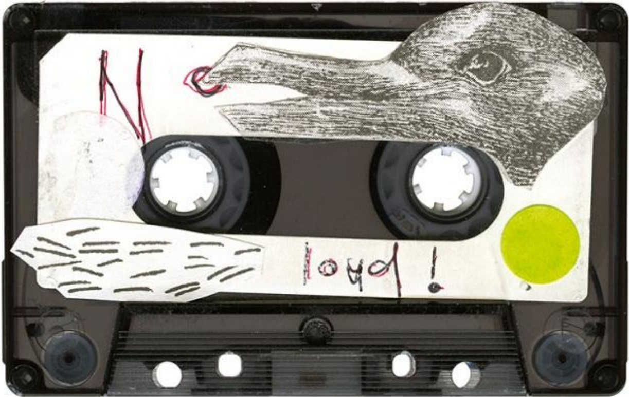
Cassette Spectacle, Aki Onda

significativo solo per l'autore stesso. Viceversa, la scelta dell'elemento performativo e della location "ad hoc" aprono all'autore stesso e ai presenti la possibilità di ripercorrere uno o infiniti ricordi attraverso il suono, le cui potenzialità evocative sono amplificate, o annullate, o anche solo distorte attraverso l'uso della luce, dello spazio, del movimento, dello sguardo.