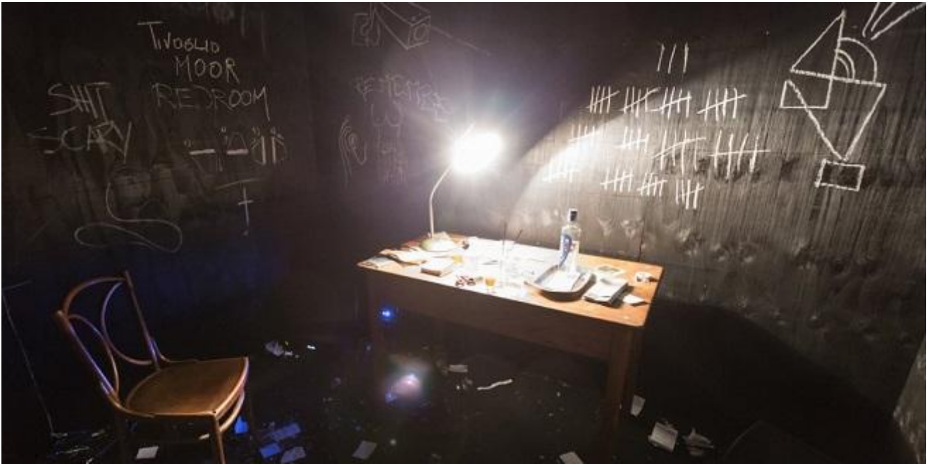
Waiting Room, Daniel Löwenbrück

A monte pare non esserci un progetto sulla piega che questi momenti debbano, o possano, prendere. Una volta che la porta si chiude alle nostre spalle quello che avviene è completamente indirizzato dalla complicità (o meno) tra l'artista e il partecipante. Pura esperienza del presente, seppur circoscritto spazio fuori dal tempo. Paradosso di un utopia che si manifesta nella sua realtà più violenta e perversa.