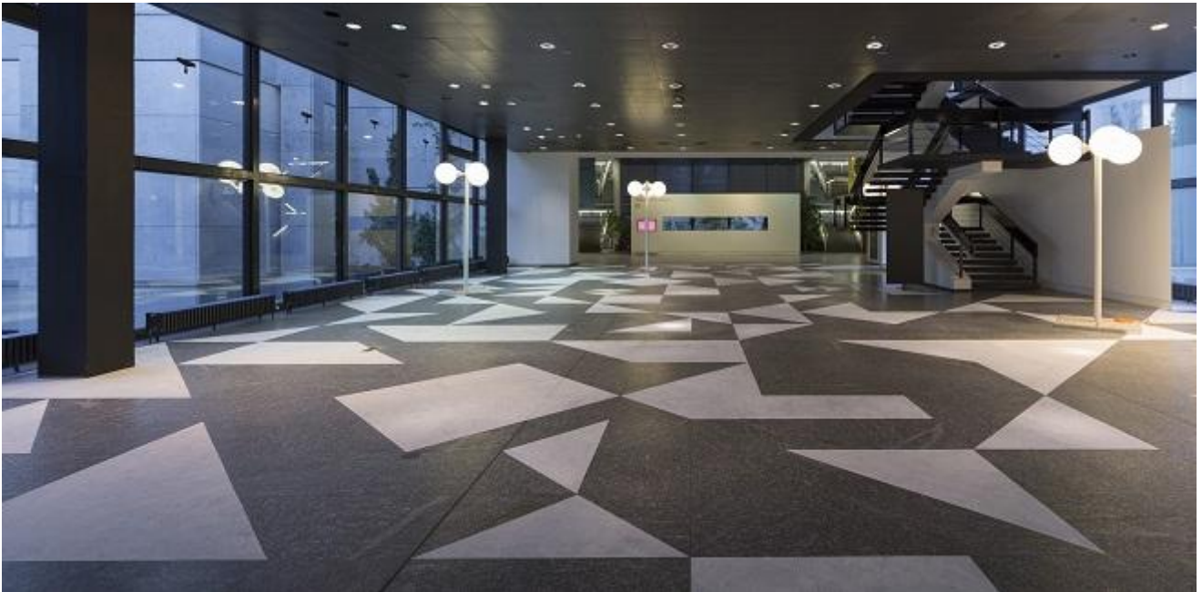
Olaf Nicolai, Szondi/Eden . 8th Berlin Biennale.

Più avanti Carlos Amorales, con The man who did all Things forbidden (2014), ci chiude in un sogno popolato di figure fragili e violente, dove la forte vicinanza con l'estetica visiva del film di Jarmush, Dead Man (1995) è oltremisura evidente.