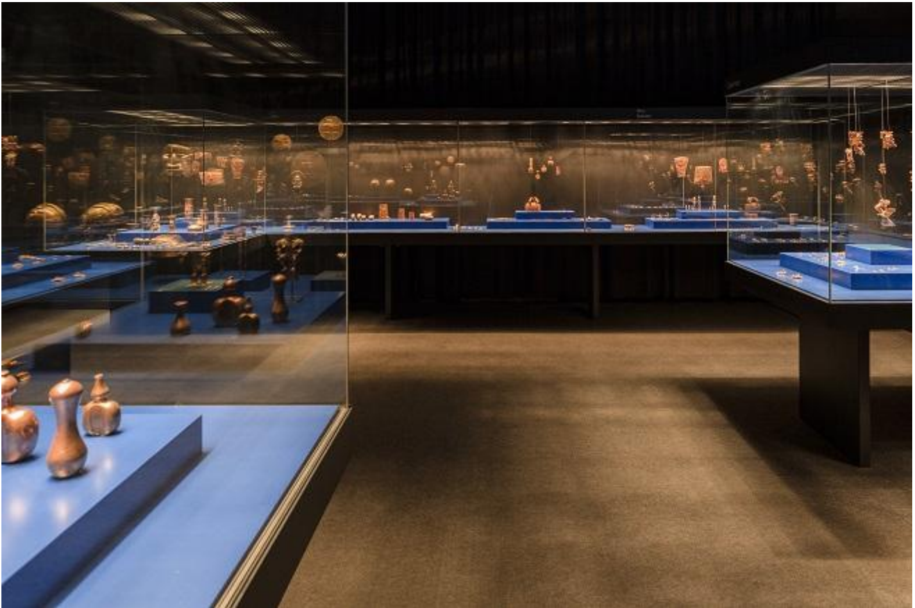
Carsten Höller, Color of Gold. 8th Berlin Biennale.

Diversamente nel Museo di Dahlem, una delle intenzioni di questa sezione è sottolineare “l’incongruità tra l’approccio scientifico e quello empirico della conoscenza, o tra gli studi sulle società attraverso ciò che fanno, e gli scambi culturali che hanno luogo attraverso le culture materiali e la produzione culturale”. Qui le steli precolombiane e le ceramiche cinesi fanno da filtro alle diverse aree della mostra. Szondi/ Eden (2014) è l’installazione di Olaf Nicolai che riempie interamente la hall con un disegno geometrico bianco e irregolare stagliato sul fondo grigio del pavimento, riprendendo i motivi della sede di un centro commerciale abbandonato.