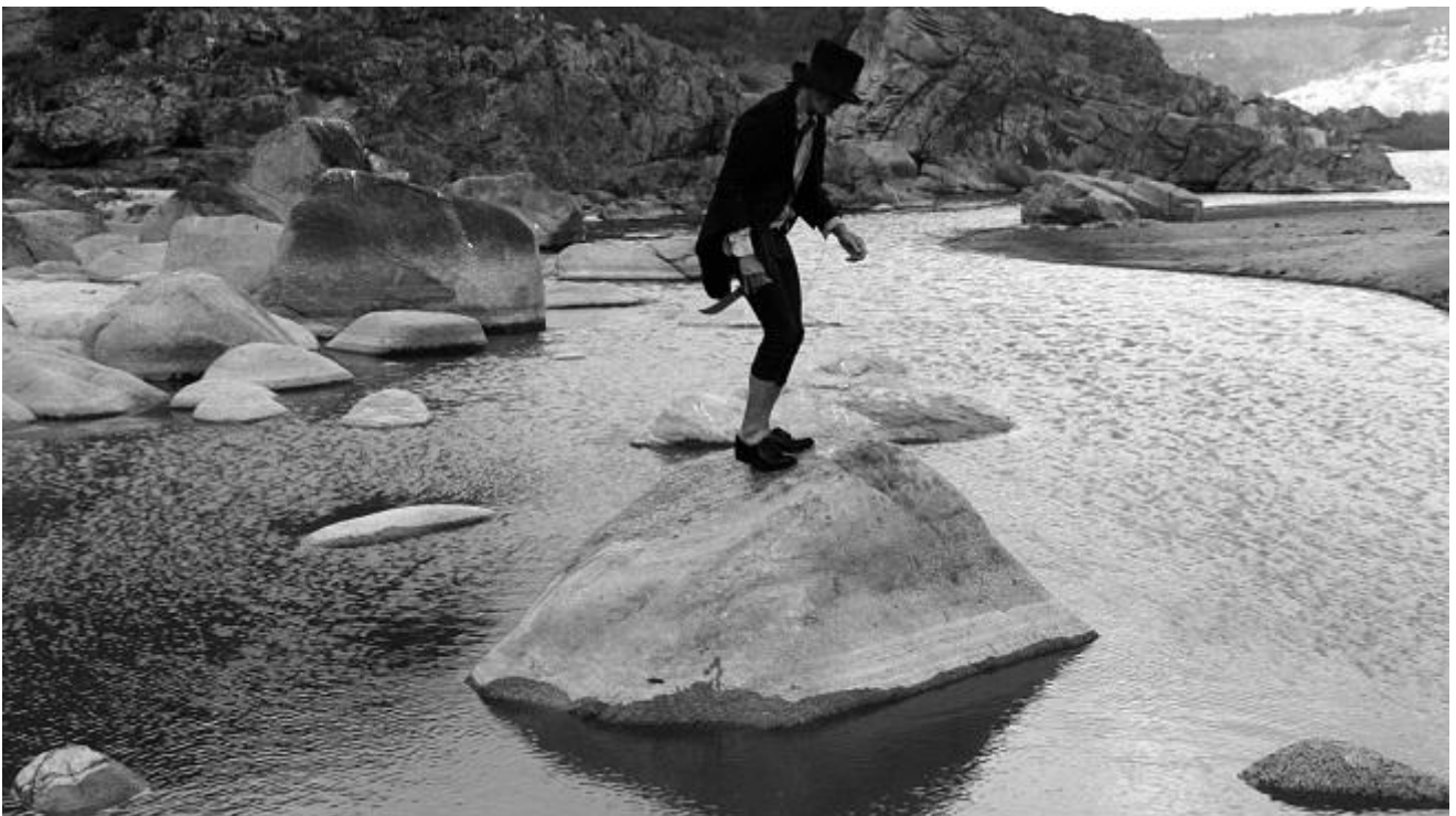
Carlos Amorales, The Man Who Did All Things Forbidden . 8th Berlin Biennale

Più avanti Carlos Amorales, con The man who did all Things forbidden (2014), ci chiude in un sogno popolato di figure fragili e violente, dove la forte vicinanza con l'estetica visiva del film di Jarmush, Dead Man (1995) è oltremisura evidente.