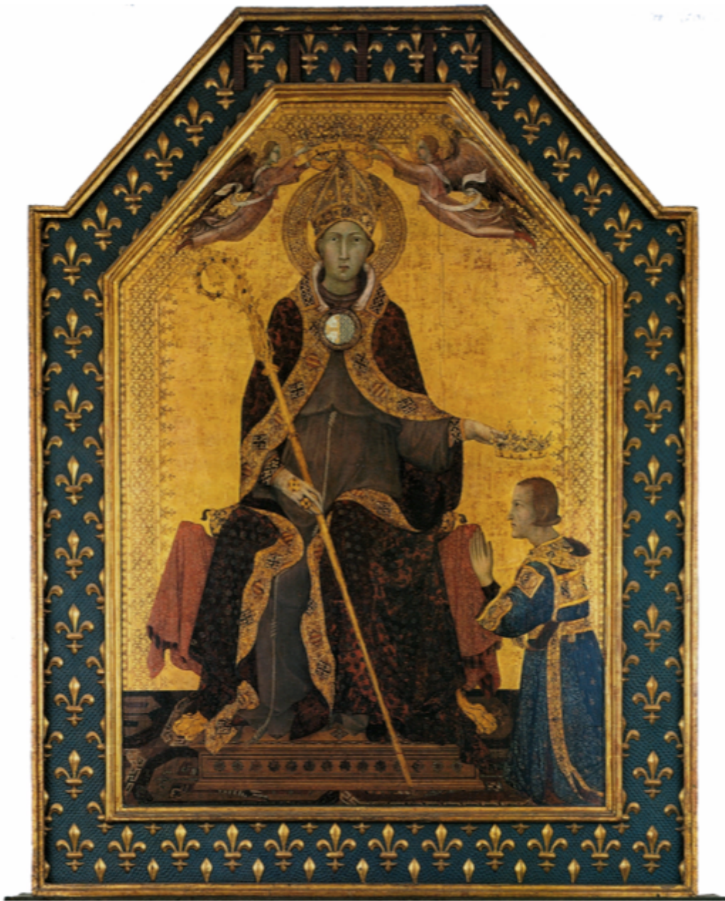
San Ludovico da Tolosa incorona il fratello Roberto d'Angiò, tempera su tavola, 138x200 cm, al Museo di Capodimonte dal 1921.

Ritrasse Roberto di profilo – com'era d'uso in antico sulle monete romane per gli imperatori – il naso aristocratico leggermente adunco e la bocca breve dalla piega amara, lo sguardo, distante e quasi distaccato, rivolto verso un punto indefinito. Lo raffigurò a mani giunte, inginocchiato ai piedi del fratello, in attesa che questi gli ponesse sul capo la corona regale, come un cavaliere che, ligio al rituale cavalleresco, attendesse l'investitura dal proprio signore.