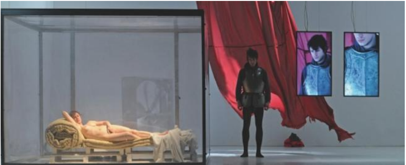
Anagoor tempesta.

Cosa può essere accaduto in questi ultimi tempi? Cosa può aver scosso così in profondità quella che si presentava a tutti gli effetti come una nuova fioritura del teatro italiano? E cosa sta accadendo ora, che tutti parlando di crisi?