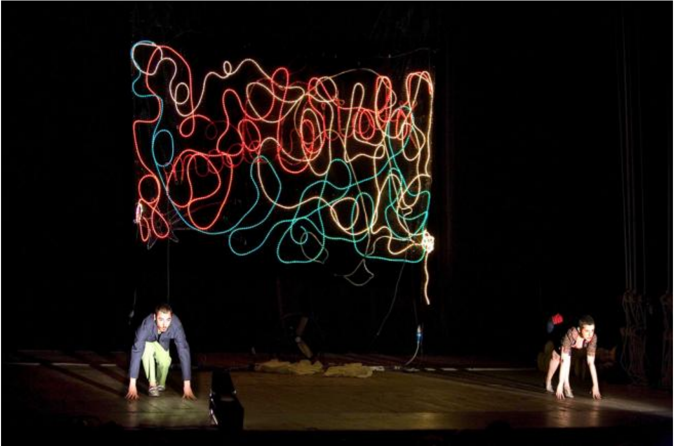
Babilonia teatri made in italy.

drammaturgica in senso stretto, la dimensione installativa con afflato pop che facevano i conti con la cultura mass-mediatica, i riferimenti teatrali con quelli artistico-visivi, musicali, cinematografici, ecc. La sensazione era quella di un'irriducibilità senza pari, con gruppi, artisti, percorsi e spettacoli che sembravano dribblare ogni tentativo di inquadramento, categorizzazione, sfuggendo a qualsiasi etichetta o linea di tendenza.