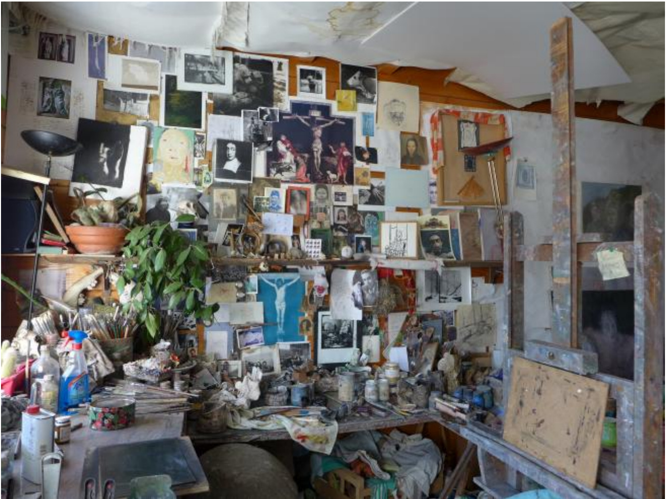
Quincy. L'atelier di Yves Berger.