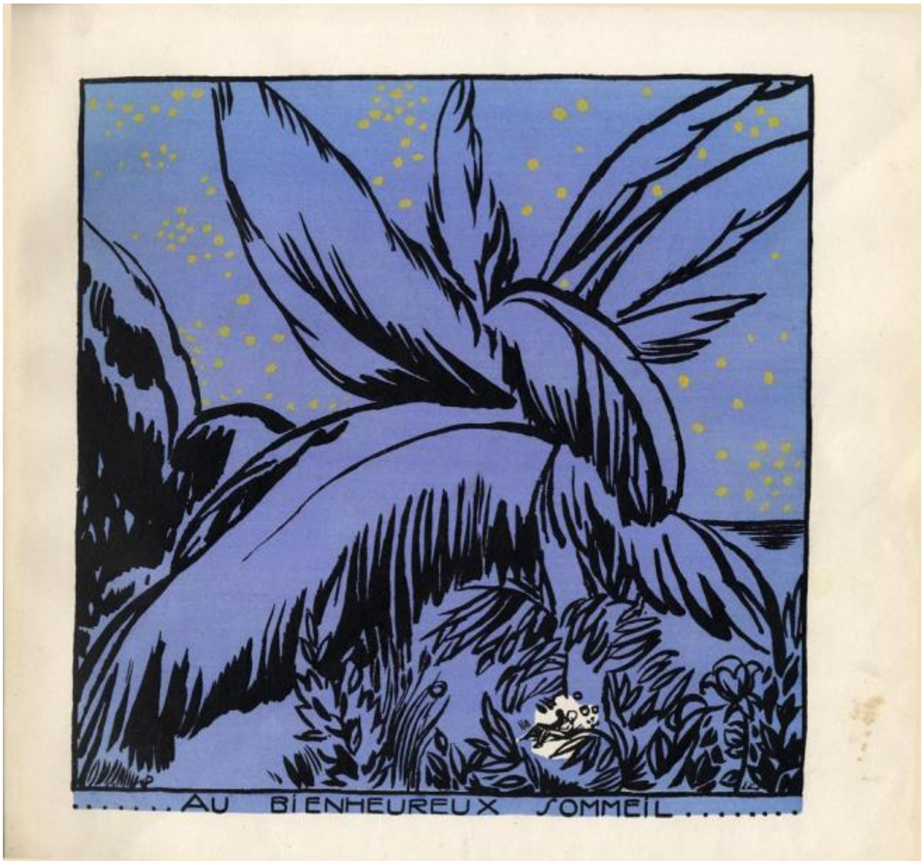
Macao et Cosmage. Ou l'expérience du bonheur, 1919

Anzi di un racconto sulla bellezza minacciata, come mostrano le illustrazioni della seconda parte del libro, dove l'unità armonica delle prime pagine che descrivono lo stato edenico in cui vivono Macao e Cosmage si frantuma nelle pagine sulla colonizzazione, dove immagini e parole non trovano più accordo, gremite all'inverosimile, non dalla pienezza della materia vivente, ma dalla proliferazione esponenziale di un progresso che spinge ogni cosa ai margini dello spazio, e del foglio, quindi, assegnando a ogni cosa spazi piccolissimi, affollati all'inverosimile o deserti, dominati comunque da un ordine sterile e artificiale.