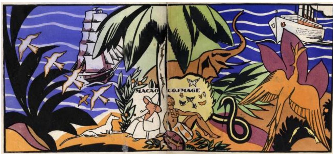
Macao et Cosmage. Ou l'expérience du bonheur, 1919, Editions de La Nouvelle revue Française

“Bambino, nelle pagine seguenti ogni colore, ogni minimo oggetto, i più piccoli animali hanno una ragione d’essere... Tocca a te scoprirla. Guarda attentamente... non racconto altro che la storia di Macao e Cosmage. Questa storia sarebbe triste, se non fossi persuaso che, oggi, loro sono felici... Il solo mistero della vita è svelato, quando sappiamo dove risiede la felicità... Il tuo amico Edy Legrand.”