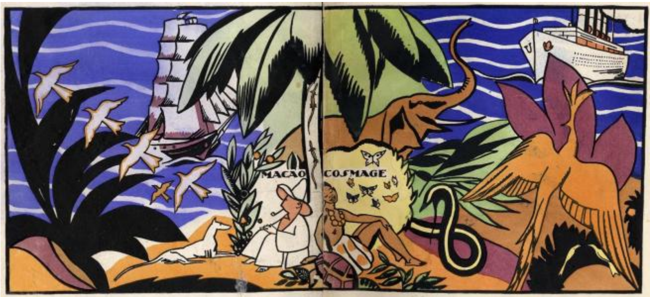
Macao et Cosmage. Ou l'expérience du bonheur, 1919, Editions de La Nouvelle revue Française

“Bambino, nelle pagine seguenti ogni colore, ogni minimo oggetto, i più piccoli animali hanno una ragione d’essere... Tocca a te scoprirla. Guarda attentamente... non racconto altro che la storia di Macao e Cosmage. Questa storia sarebbe triste, se non fossi persuaso che, oggi, loro sono felici... Il solo mistero della vita è svelato, quando sappiamo dove risiede la felicità... Il tuo amico Edy Legrand.”