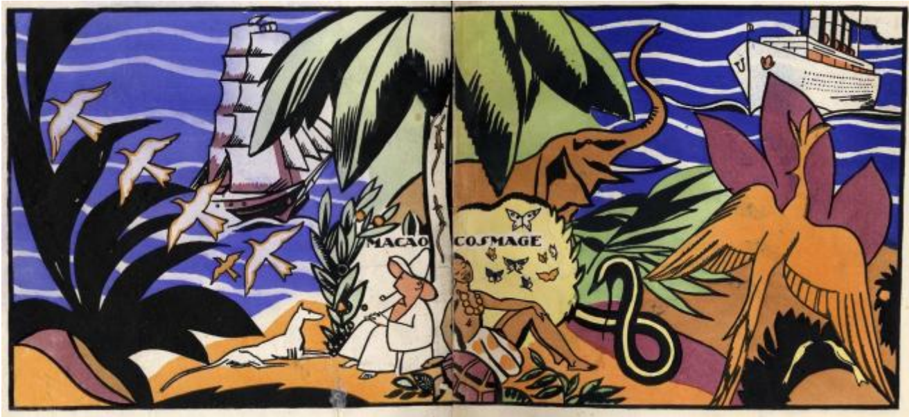
Macao et Cosmage. Ou l'expérience du bonheur, 1919. Risuardo

Che quasi cento anni fa, un autore abbia pensato di rivolgersi al lettore bambino con questo incipit, un invito a guardare attentamente le immagini, per scoprire “la ragione d'essere” di ogni cosa è straordinario, tanto più se si pensa quanto ancora oggi le illustrazioni nei libri per bambini siano, per molti adulti, anche colti, un accessorio didascalico o puramente decorativo (tant'è che si parla di aniconia, ovvero analfabetismo iconico, incapacità di leggere le immagini e quindi di riconoscerne il senso, la specificità di linguaggio, al di là del giudizio istintivo e immediato mi piace/non mi piace). Al contrario, le immagini hanno un'importanza fondamentale sia nella comunicazione umana, perché attraverso i loro codici ci orientiamo ogni giorno nello spazio e nel tempo, sia nello sviluppo cognitivo ed emotivo dei bambini, in particolare quelle dei libri con cui entrano in relazione, perché nelle narrazioni, le immagini, come le parole, sono parte integrante di processi logici, di senso, di lettura e di trasmissione culturale.