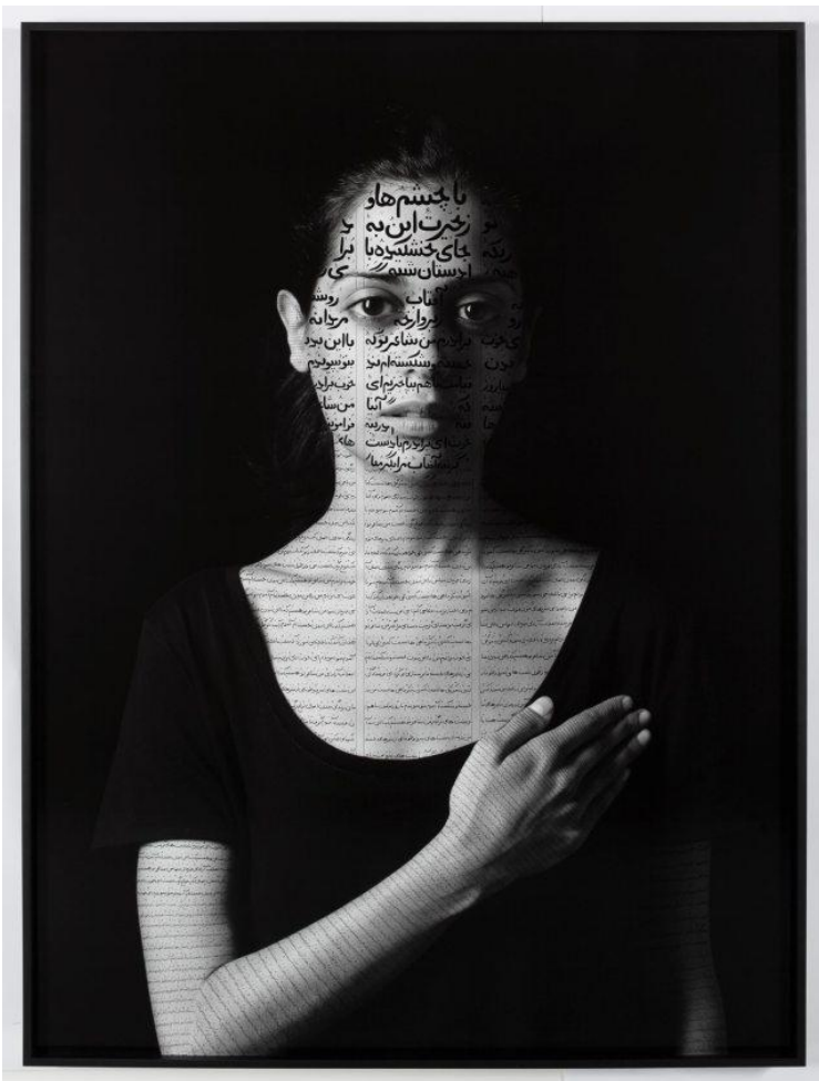
Shirin Neshat. Il Libro dei Re

La stessa cosa è avvenuta a Piazza Tahrir e in Tunisia. Un mondo che ha vissuto la caduta dei dittatori come opportunità di fare emergere l'individuo e la sua autonomia, non solo di pensiero, ma anche economica, in un contesto islamico che ha sempre umiliato e reso impossibile questo sviluppo. La partita che si gioca in questi giorni in Egitto e Tunisia ha questo in ballo e per questo la gente non ha accettato il ruolo di Ennahda o dei Fratelli Musulmani, perché vi ha visto lo stesso blocco sociale che impediva alla piccola borghesia e agli individui che ne fanno parte di esprimersi e di sopravvivere. Di questo mondo fa parte anche la manovalanza intellettuale, gli artisti, i musicisti, quelli che fanno teatro, i cineasti e tutto il mondo giovanile che vuole avere un posto nella società di domani ma che soprattutto vuole "essere lasciata in pace".