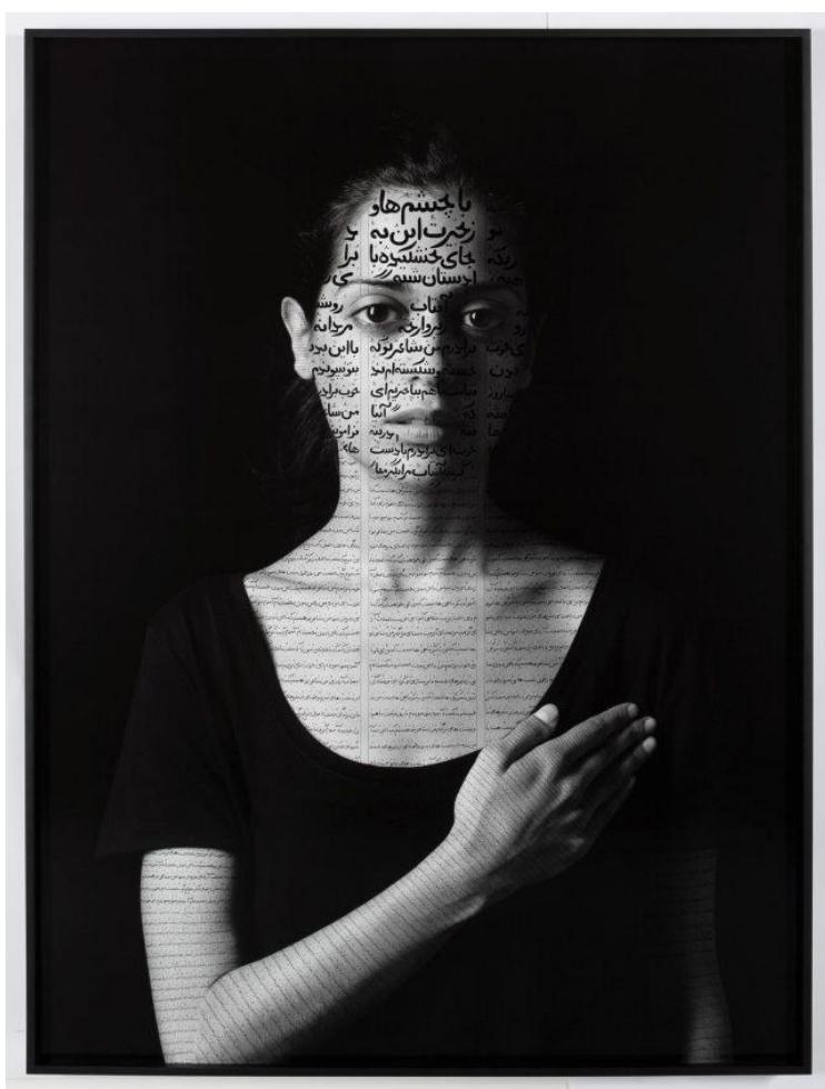
Shirin Neshat. Il Libro dei Re

Autonomia minacciata come non mai dalla piega che hanno preso le economie post-globalizzate di questi ultimi anni. Lo studente, l’insegnante delle scuole primarie e secondarie, il piccolo commerciante, la segretaria di uno studio di architettura turco, ma anche il piccolo commerciante, l’artigiano, l’elettricista non sono previsti nel futuro della economia globalizzata: vadano a friggere patatine in un macdonald normale o islamico halal, o vadano ad ingrossare le fila dei call center. È questa piccola borghesia che ha capito di correre il rischio di essere spazzata via e si è mobilitata. Non la mitica “middle-class” che ha un margine ampio prima della caduta e che gode di alleanze e di compromissioni col potere politico e amministrativo.