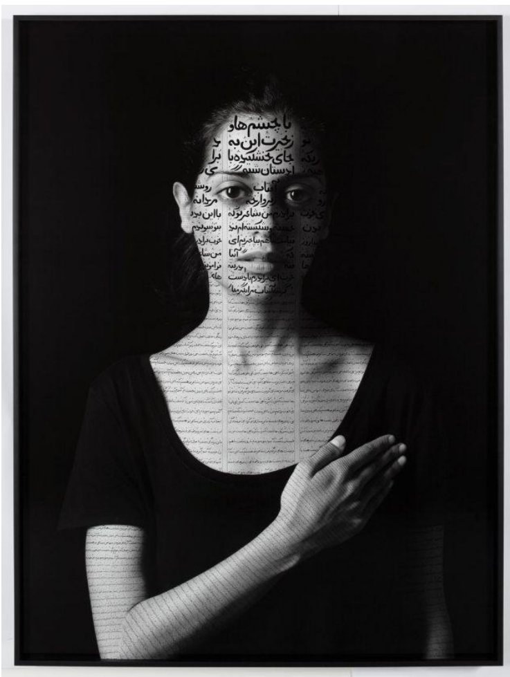
Shirin Neshat. Il Libro dei Re

Autonomia minacciata come non mai dalla piega che hanno preso le economie post-globalizzate di questi ultimi anni. Lo studente, l’insegnante delle scuole primarie e secondarie, il piccolo commerciante, la segretaria di uno studio di architettura turco, ma anche il piccolo commerciante, l’artigiano, l’elettricista non sono previsti nel futuro della economia globalizzata: vadano a friggere patatine in un macdonald normale o islamico halal, o vadano ad ingrossare le fila dei call center. È questa piccola borghesia che ha capito di correre il rischio di essere spazzata via e si è mobilitata. Non la mitica “middle-class” che ha un margine ampio prima della caduta e che gode di alleanze e di compromissioni col potere politico e amministrativo.