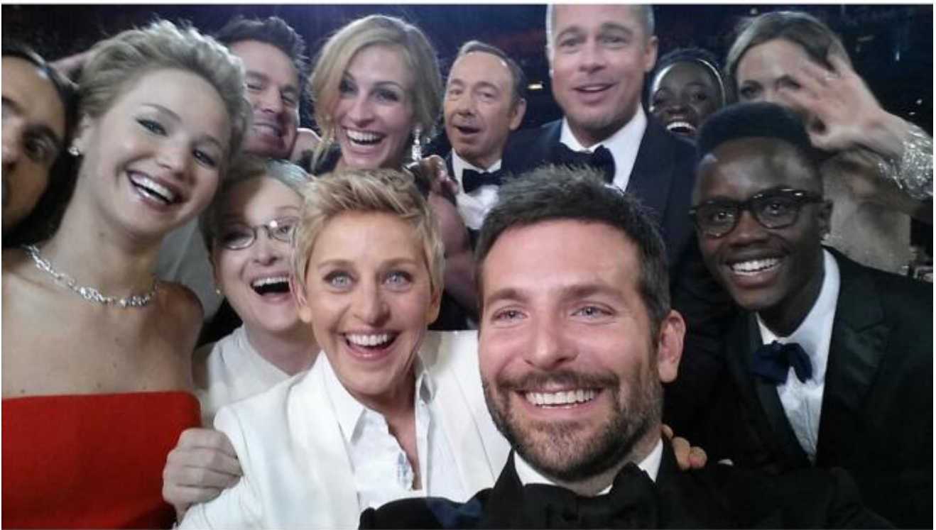
Ellen DeGeneres, selfie notte degli Oscar 2014

indulgere in una semplificazione – due essenziali giudizi: da una parte la condanna senza se e senza ma nei confronti di un’invasione della privacy crudele e violenta; dall’altra la considerazione che, se quelle foto non fossero state caricate su uno spazio online o, anche meglio, se non fossero state scattate, non sarebbe stato possibile trafugarle e tantomeno pubblicarle.