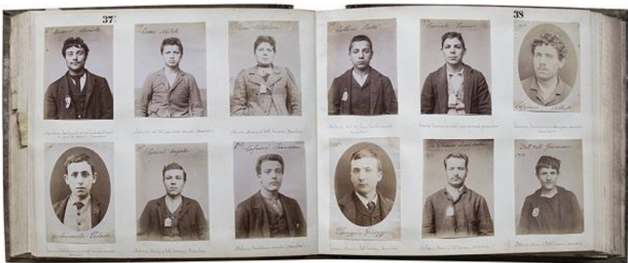
Fotografia – Festival Internazionale di Roma » Anarchici dall'Archivio di Stato

Bisogna pertanto confrontarsi con questa stanchezza dello sguardo che inizia ad emergere, inevitabile in una società basata sulla bulimia visiva; una spossatezza che inscritta nel contesto delle relazioni umane pregiudica la capacità di conoscere veramente l'Altro, investiti come siamo dall'enorme numero di facce che pretendono di raccontare le proprie storie, di essere riconosciute, o almeno registrate momentaneamente nella retina di chi guarda. Se una lezione si apprende dal festival diretto da Marco Delogu è che il concetto di ritratto perde valore se esibito nella sua nuda essenza quale “riproduzione figurativa o fotografica delle sembianze di una persona” (dal Dizionario della Lingua Italiana Devoto-Oli): è la forma impressa a questa rappresentazione che può aprire il varco attraverso il quale l'esperienza visiva diviene un esercizio di apprendimento.