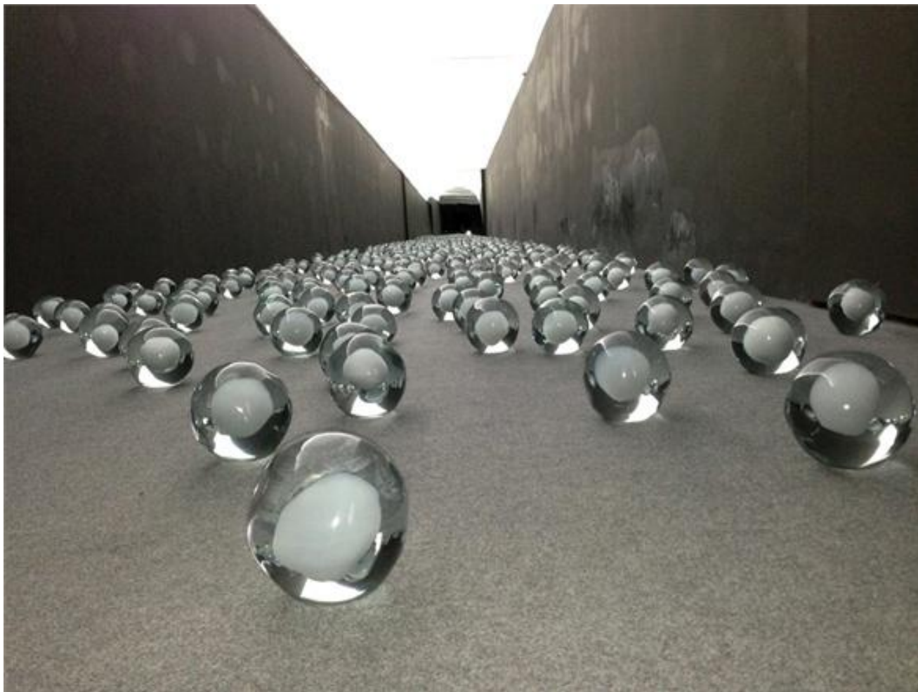
Not Vital, 700 Snowballs

Ma Sloterdijk è stato anche, proprio a ridosso della pubblicazione del primo volume della trilogia di Sfere (traendo da ciò non poca visibilità – Sloterdijk è anche un abile promotore di se stesso), colui che ha detto al grande padre filosofico della cultura tedesca del dopoguerra, Jürgen Habermas, che “la teoria critica è morta”, sulla scia di una feroce polemica culturale che aveva visto Habermas attaccare (infondatamente, bisogna dire) Sloterdijk per presunte tesi para-eugeniste, che egli avrebbe sostenuto nel breve saggio Regole per il parco umano , uno dei lavori più interessanti di Sloterdijk dal punto di vista teoretico.