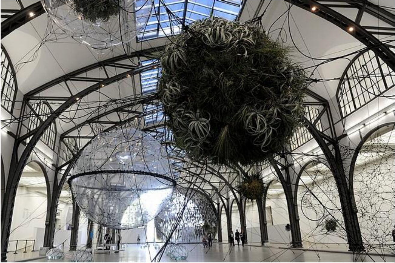
Hamburger Bahnhof, Berlino, Città trasparenti

La storia di come le immagini del mondo metafisiche abbiano creato una Macrosfera inclusiva, e di come questa sia tramontata, sono riassunte da Sloterdijk nell'illuminante capitolo VIII del testo (dal titolo L'ultima sfera. Breve storia filosofica della globalizzazione , che fu, come capitolo a se stante, il primo testo tradotto di Sloterdijk in italiano, alla fine degli anni '90 per l'editore Carocci, che alimentò l'equivoco, in parte non ancora dissipato, che Sloterdijk fosse un filosofo della globalizzazione, cosa che non è affatto).