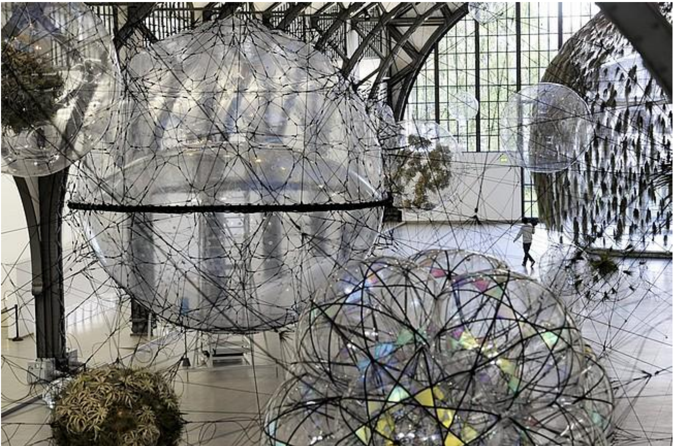
Hamburger Bahnhof, Berlino, Città trasparenti

Queste immagini del mondo avrebbero però subito un sorpasso cognitivo, una sconfitta, da parte delle metafisiche dell'inclusività, che avranno la loro massima teorizzazione nell'ontologia filosofica greca e nella metafisica religiosa cristiana; la sfera ontologica parmenidea, e la sfera teologico-inclusiva del cristianesimo avranno secondo Sloterdijk il loro successo millenario perché in grado di dare una spiegazione immunologica particolarmente soddisfacente del reale, una spiegazione in cui il tasso d'inclusività è assoluto: la sfera cosmica sarebbe, secondo tale visione, la macro-parete che rende il genere umano unito nella grande casa datagli da Dio.