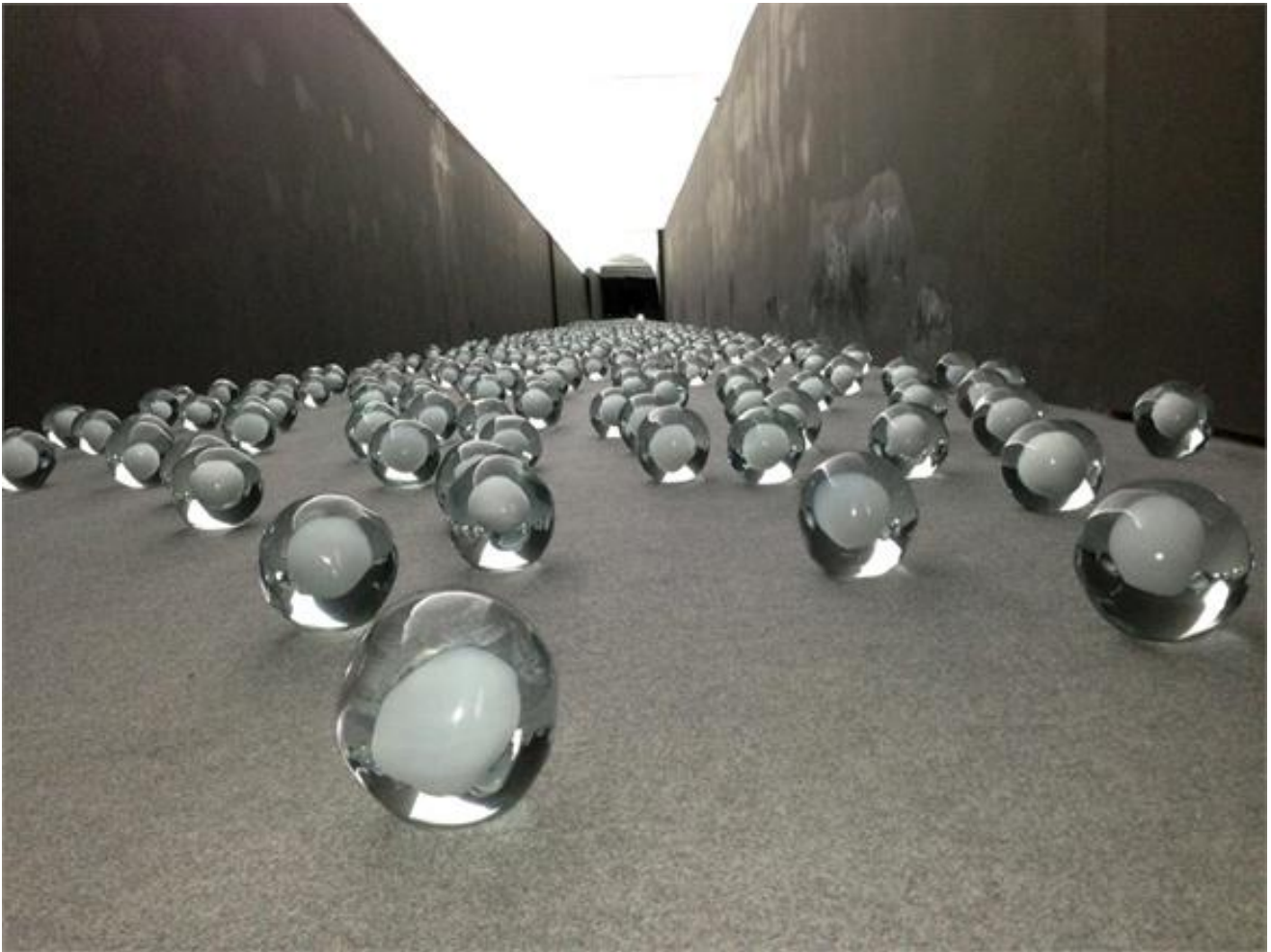
Not Vital, 700 Snowballs