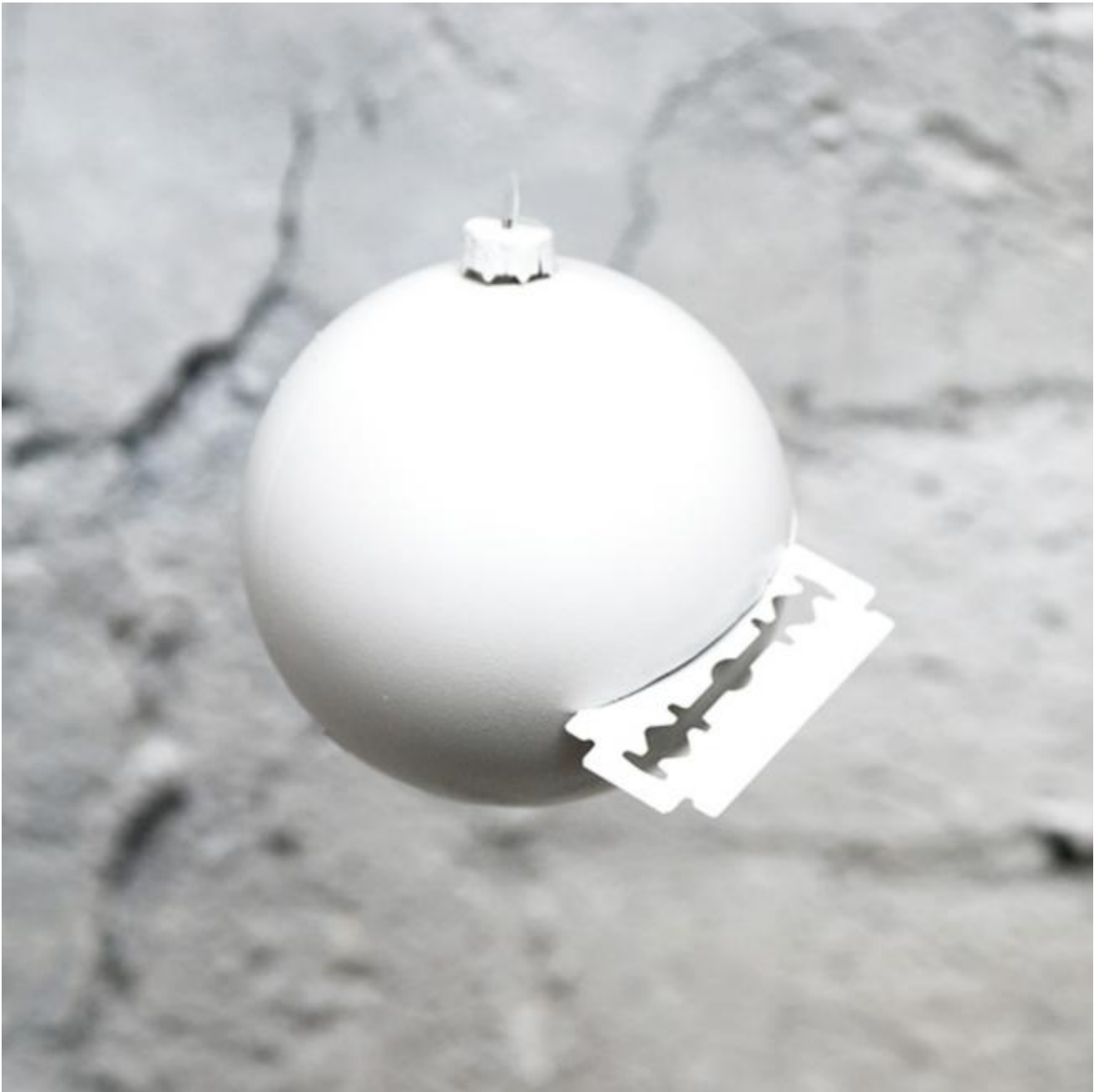
Roberto Cicchinè - untitled 2009