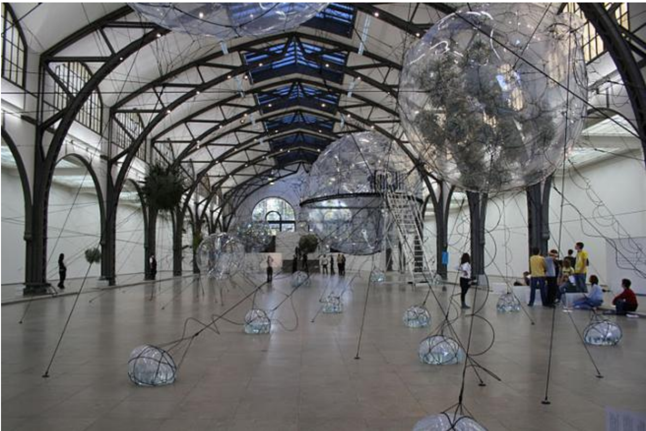
Hamburger Bahnhof, Berlino, Città trasparenti

Globalizzazione elettronica: è quella che si svolge attualmente nel mondo contemporaneo. Nell'ultimo stadio della globalizzazione i media non sono più tanto fisici (navi, galeoni) quanto telematici ed elettronici (onde radio, sistemi satellitari, televisione, internet, aerei).