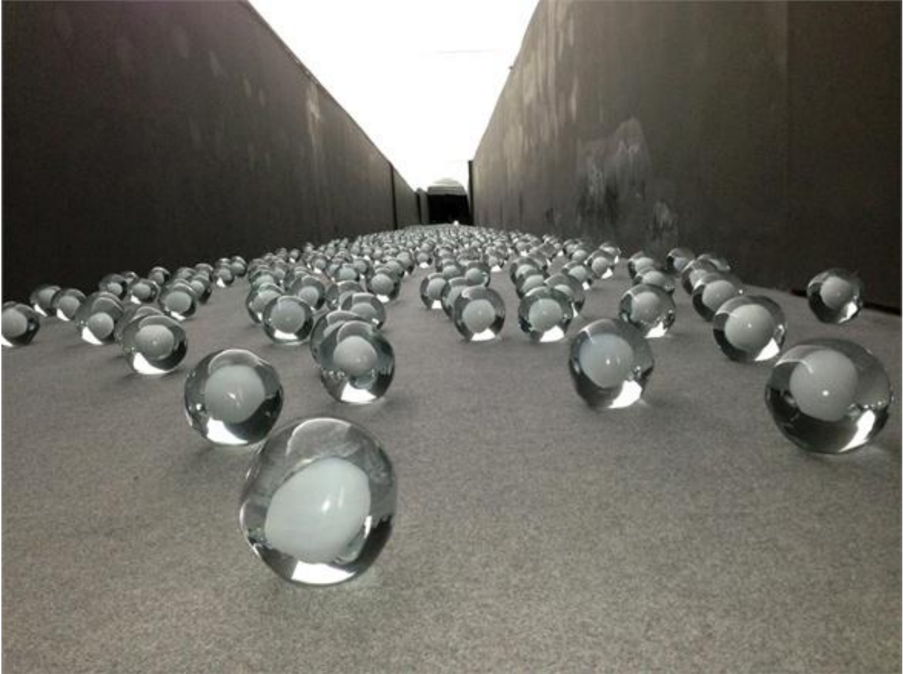
Not Vital, 700 Snowballs

Ma Sloterdijk è stato anche, proprio a ridosso della pubblicazione del primo volume della trilogia di Sfere (traendo da ciò non poca visibilità – Sloterdijk è anche un abile promotore di se stesso), colui che ha detto al grande padre filosofico della cultura tedesca del dopoguerra, Jürgen Habermas, che “la teoria critica è morta”, sulla scia di una feroce polemica culturale che aveva visto Habermas attaccare (infondatamente, bisogna dire) Sloterdijk per presunte tesi para-eugeniste, che egli avrebbe sostenuto nel breve saggio Regole per il parco umano , uno dei lavori più interessanti di Sloterdijk dal punto di vista teoretico.