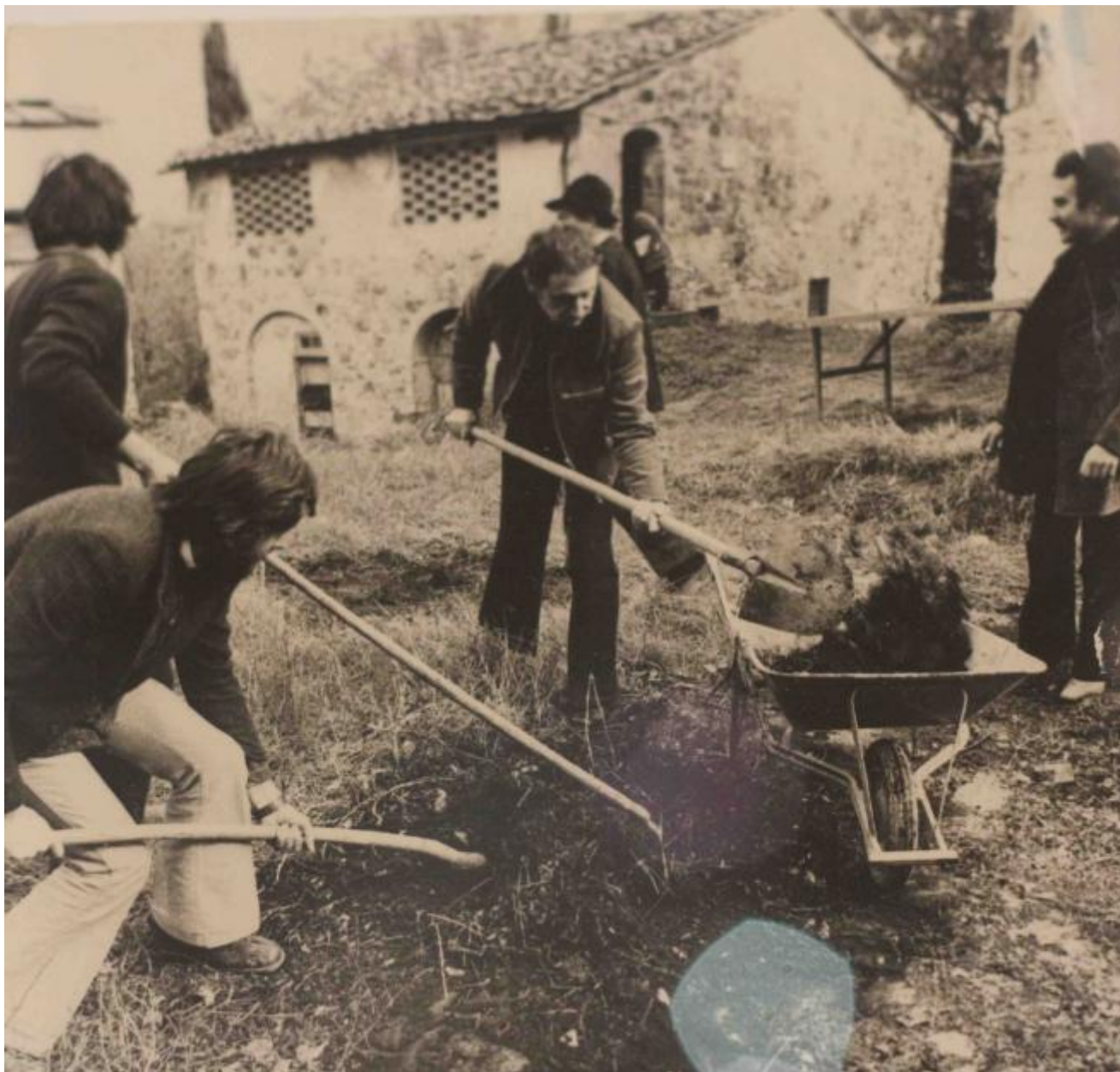
Ettore Sottsass spalatore

qualità scenografica volutamente ridotta in risposta ai viaggi in India di Ettore Sottsass.