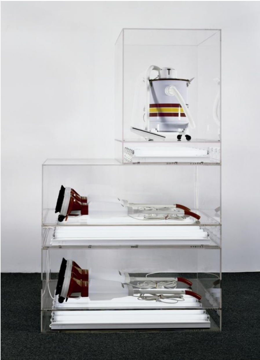
New Hoover Deluxe Shampoo Polishers, New Shelton Wet/Dry 10-Gallon Displaced Tripledecker, 1981-87

Entro nella prima sala e resto strabiliato dalle bellissime sculture post-minimaliste degli aspirapolvere nuovi di zecca, il contrario delle figurine di cioccolato di Paul McCarthy. Che si tratti di un canotto o dell'incredibile Hulk, i readymade di Koons impongono in modo perentorio la loro presenza. E capisco che Jeff non è un uomo come noi. È un aspirapolvere. Un aspirapolvere cui non hanno mai attaccato la corrente, intonso, col tubo, il sacco e l'ugello lindi.