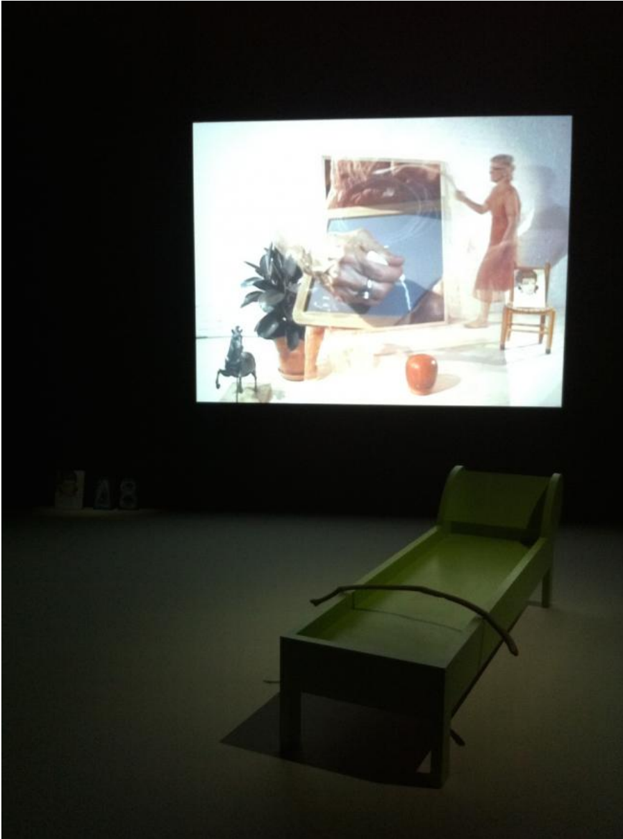
Lines in the sand 2002

Presto si realizza come il percorso si snodi attorno a tre nuclei di lavori, Lines in the Sand , Revolted by the Thought of Known Place... , Sweeney Astray , Volcano Saga , dove narrazione, racconto epico e storia si intrecciano, nascono personaggi e il paesaggio diventa protagonista.