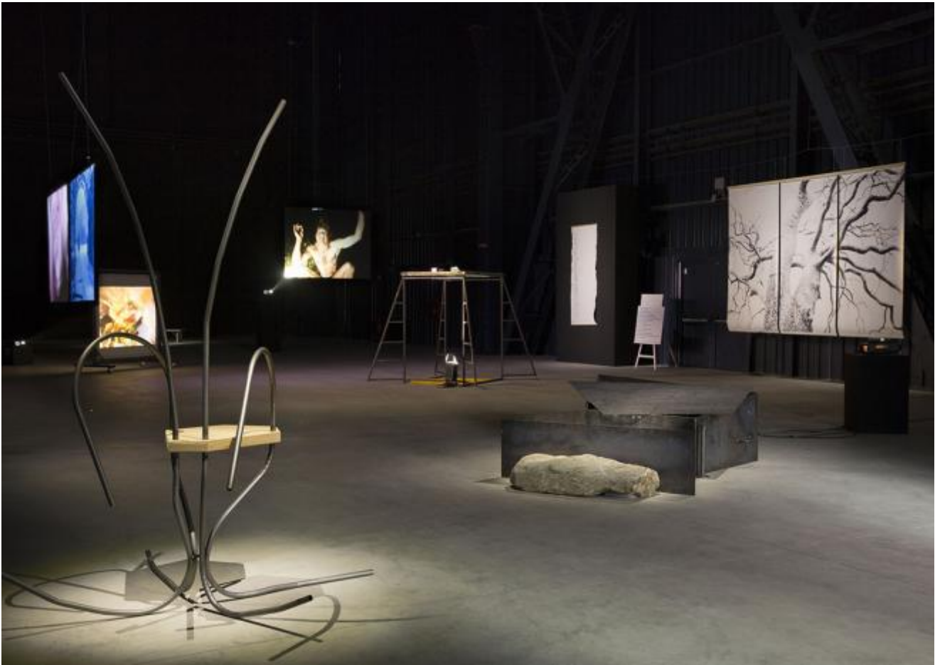
Revolted by the thought of known place...Sweeny Astray, 1992