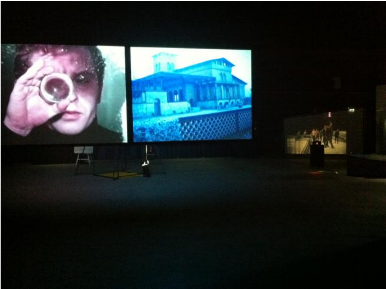
Veduta dell'installazione, Light Time Tales , Hangar Bicocca, 2014