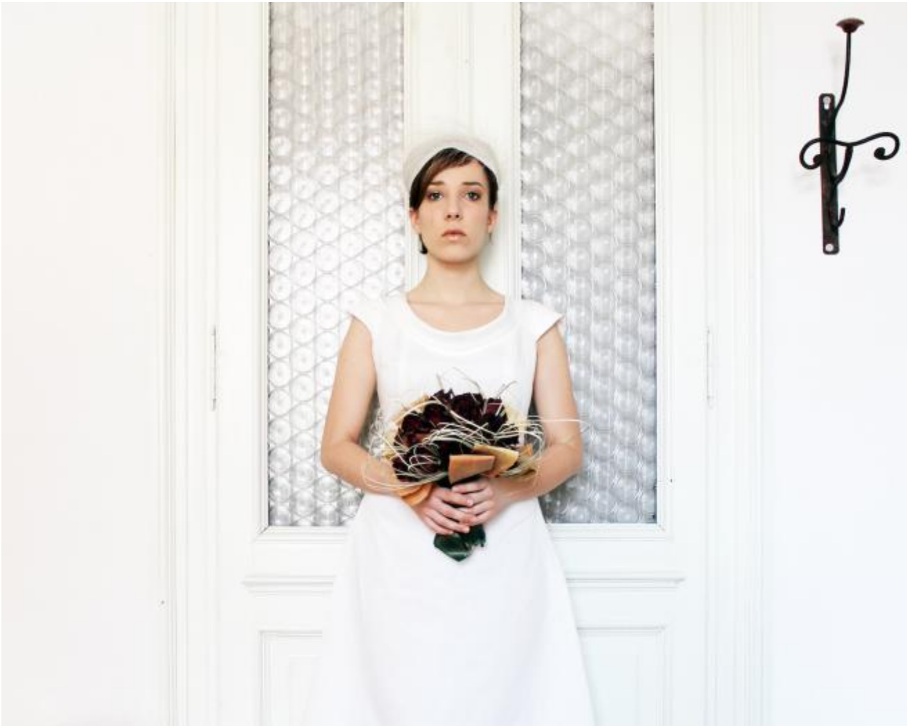
Winterreise, Die Bankbraut (da Winterreise)