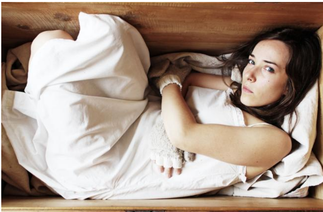
Winterreise, Erstarrung (da Winterreise)

Elfriede Jelinek nasce nel 1946 a Mürzzuschlag nella Stiria, ma cresce a Vienna, capitale della musica. La madre incoraggia con un certo accanimento i suoi studi musicali e a soli 13 anni Jelinek viene ammessa al Conservatorio di Vienna, dove studia organo, pianoforte e composizione, contemporaneamente dedicandosi al flauto dolce e alla viola in una scuola civica musicale. Parallelamente frequenta le scuole pubbliche e dopo la maturità studia Scienze teatrali e Storia dell'arte all'Università di Vienna, ma è costretta ad abbandonare gli studi universitari per via dei frequenti attacchi di panico (per un anno resta chiusa in casa in completo isolamento: è questa l'epoca in cui inizia a scrivere) ed è al Conservatorio che porta quindi a termine gli studi nel 1971, diplomandosi come organista sotto la guida di Leopold Marksteiner. Musicista, quindi, prima ancora che scrittrice. Non per niente la motivazione del Nobel recita “per il flusso musicale di voci e controvoci” e non per niente una grandissima parte della sua produzione è strettamente legata alla musica.