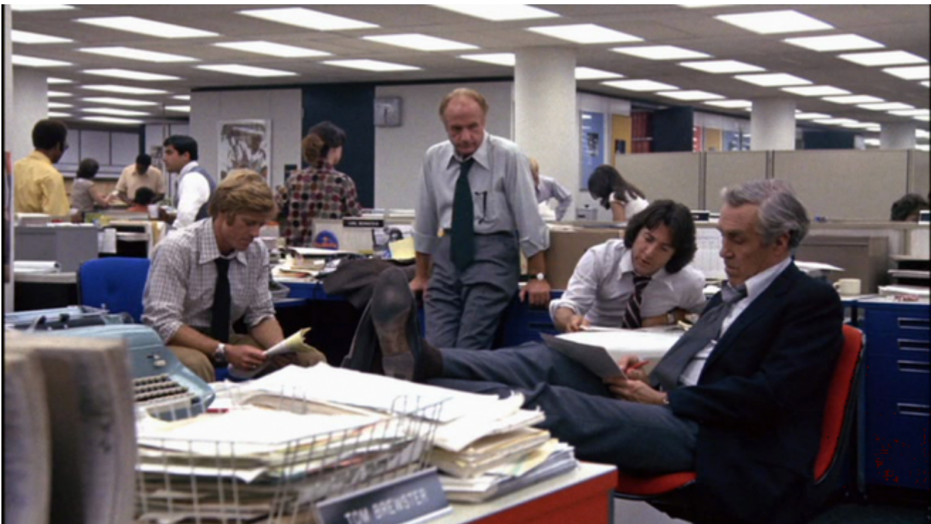
Tutti gli uomini del presidente, 1976. Regia Alan Pakula

E lo sguardo finale di McAvoy, nella quiete finalmente ritrovata della redazione (siamo alla fine, ed è l'unico momento di serenità e calma lavorativa in tre stagioni), non può che essere il segnale più aperto e democratico di una nazione che si offre invece di imporsi, che combatte ma non impone il proprio punto di vista. Guarda noi spettatori, McAvoy, a differenza della moglie di Kyle, che invece guarda il male.