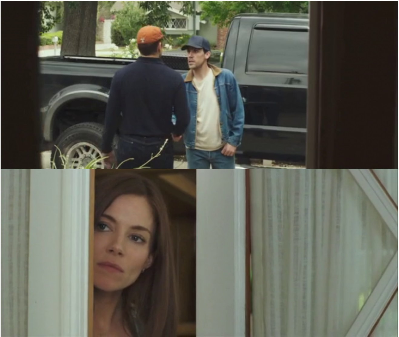
American Sniper, frame dal film

(E se ci si chiede per caso dove vada a finire il fratello di Kyle, che a un certo punto si vede su una pista d'atterraggio in Iraq, soldato pure lui, ma stanco della guerra e desideroso di tornare a casa, per poi sparire inspiegabilmente dal film, credo proprio che vada a finire lì, nello sguardo del reduce malato di stress post-traumatico, cosa che rende l'uccisione di Chris Kyle una sorta di fratricidio biblico ribaltato di segno, il debole che uccide il forte, l'agnellino che sbrana il cane pastore...).