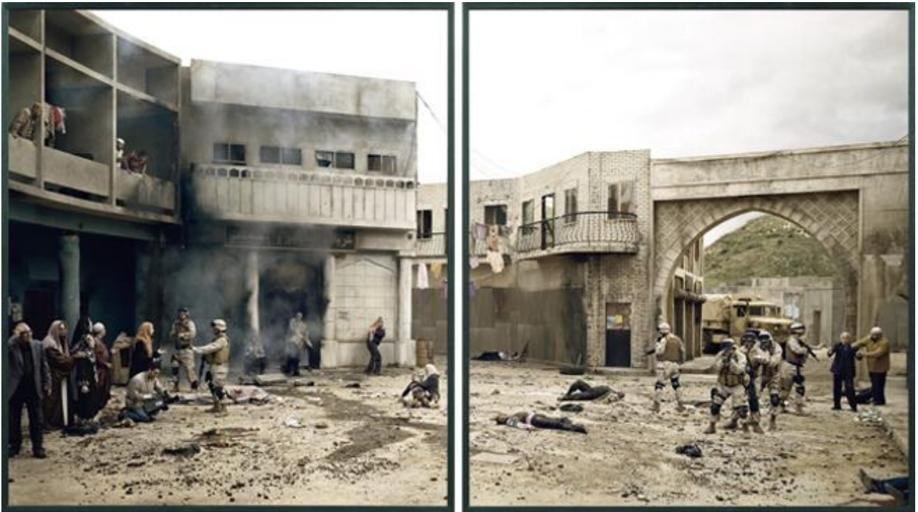
Eric Baudelaire | THE DREADFUL DETAILS , 2006 | c-print, diasec, 209 x 375 cm (dittico) | The Pinnel Collection