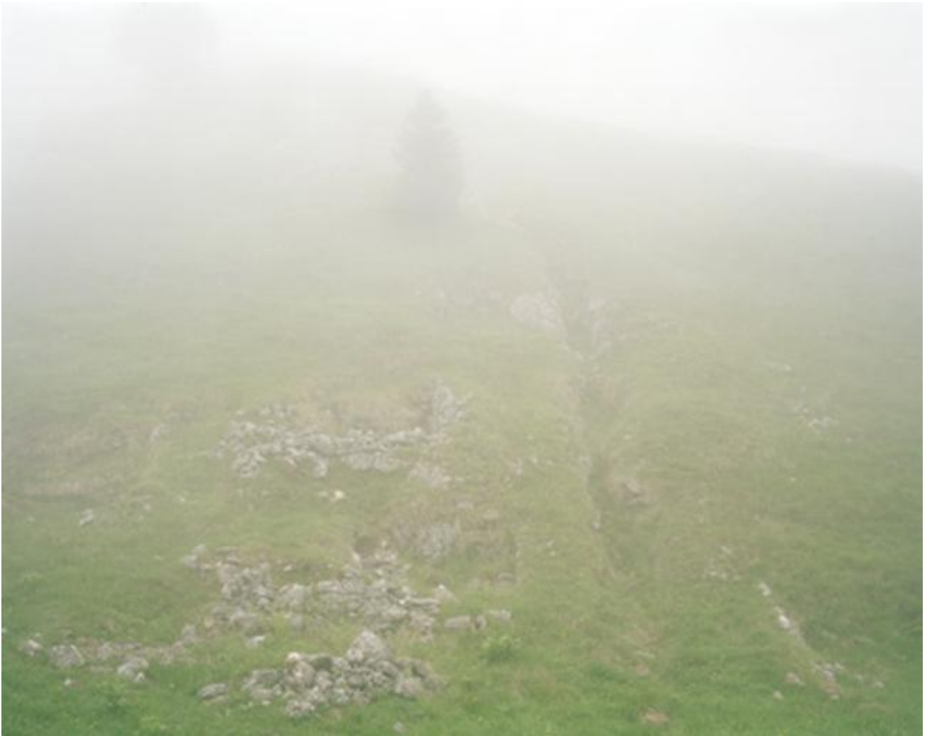
Paola De Pietri | CASON D'ARIOSA, MONTE GRAPPA (dalla serie To face), 2009 | stampa digitale ai pigmenti su carta cotone, 129 x 156 cm

de Prévaux: il quale, all'epoca contrammiraglio nella marina rimasta preda di Vichy, entra nella Resistenza nel luglio del '41 e passa informazioni segrete agli Alleati sino a quando viene arrestato dalla Gestapo, e fucilato insieme alla moglie Lotka: a Bron, vicino Lione, il 19 agosto 1944: a due settimane dalla Liberazione, cioè.)