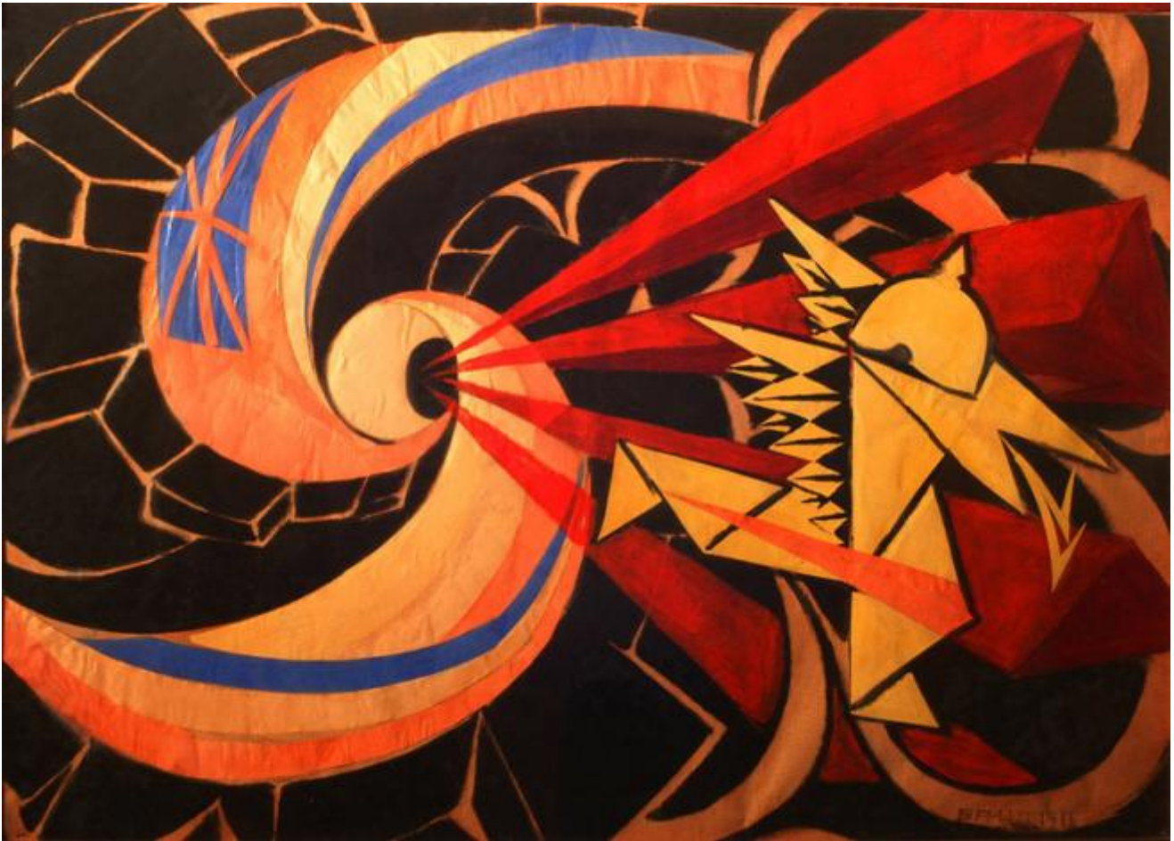
Giacomo Balla | LA GUERRA, 1916 | olio e collage di carte colorate su cartone, 64 x 94 cm | Unicredit Art Collection

Esemplare, fra tutte le opere in mostra al Mart, è in questo senso la serie House Beautiful: Bringing the War Home , realizzata fra il 1967 e il '72 da Martha Rosler (ma significativamente dalla stessa riproposta nel 1991 e poi nel 2004 e nel 2008, in occasione delle nuove guerre americane in Iraq e in Afghanistan): «montaggi in cui immagini tratte dalle notizie della guerra in Vietnam contaminano la dimensione protettiva e rassicurante di interni domestici da pubblicità», scrive Gabi Scardi. La sostanza traumatica della guerra invade così il fronte interno, che vive imperturbato il suo sogno consumistico borghese: «come a dire», prosegue Scardi, «che qualsiasi immagine può essere neutralizzata da una società che consuma tutto». Ma è altresì vero che il collage decontestualizzante di Rosler, se non sortisce l'effetto di «produrre l'accesso ad un'altra realtà», può «porre in evidenza rapporti occultati della nostra realtà» (Cincinelli): può farci riconoscere , cioè, la sostanza traumatica della nostra "pace" . Con strumenti diversi e intenti in apparenza opposti, si colloca a ben vedere in questa dimensione il lavoro di Eric Baudelaire, The Dreadful Detail del 2006. Un dittico fotografico di grande formato (209 x 375 cm) pare riprodurre "documentariamente" una "tipica" scena di