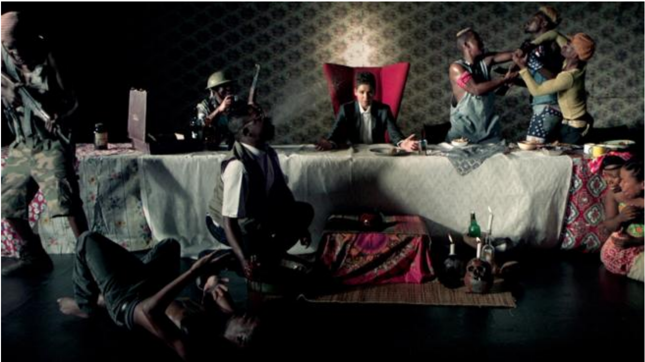
Kudzanai Chiurai, Iyeza, 2012

Kudzanai Chiurai: La religione e l'etica sono argomenti centrali nella mia pratica. Li ho spesso usati come espressione del tempo. Il trascorrere del tempo, attraverso le esperienze vissute, è un modo di comprendere la religione e l'etica, quindi, le esperienze vissute determineranno in quale regno finisci e per quanto tempo ci resterai.