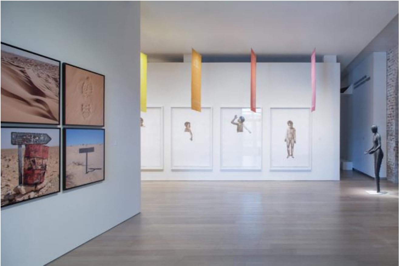
The Divine Comedy, veduta della mostra

soggettivi e sfaccettati dei singoli artisti che si sono confrontati con l'opera di Dante. È un racconto corale del progetto e della sua complessità, un progetto che mescola mondi e percezioni, in movimento tra paesi, pubblici, culture, individuo e collettività.