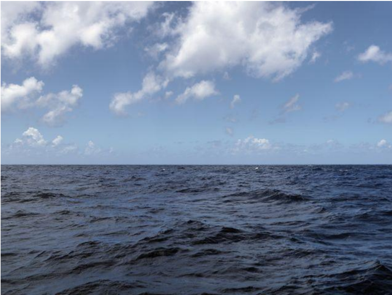
Guy Tillim, Near Huahine , 2011

Guy Tillim: Ho alcune idee circa la mia pratica artistica e trovo echi della poesia di Dante attraverso la mia esperienza con la macchina fotografica, che è impregnata di una certa auto-riflessione e contribuisce a una sorta di rivelazione in questo modo: la scena di fronte a me parla attraverso di me, o almeno io dovrei aspirare a questo stato. L'invisibilità del sé è desiderabile perché è mediata.