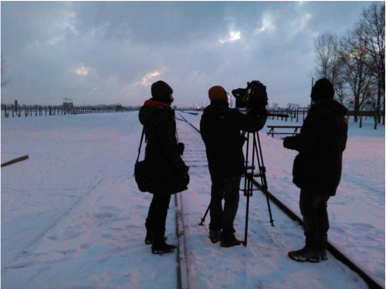
Birkenau, gennaio 2015

all'indietro, non facciamo altro che pronunciare il pronome "noi", ossessivamente: «in fondo» - ha scritto l'antropologo Francesco Remotti, «l'identità è l'ultima risorsa che rimane quando c'è penuria di strumenti per immaginare un futuro diverso» [1] . Cosa hanno fatto i nostri connazionali? Che impatto hanno avuto le loro azioni? Questa storia riguarda veramente noi ?