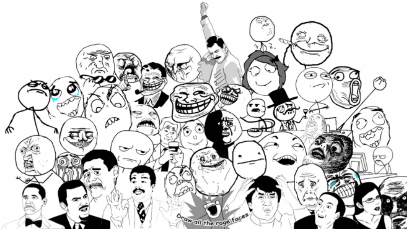
Una raccolta di Rage faces (e altre icone del mondo dei meme).

Rage faces , personaggi realizzati con Microsoft Paint dalle espressioni buffe e grottesche nati come fumetti su 4chan (la culla della sottocultura nerd contemporanea), uno degli esempi più tipici di Internet meme, oggi non fanno altro che “doppiare” funzioni e usi tipici delle emoticon: le “facce arrabbiate” vengono usate per esprimere emozioni, sentimenti, stati d’animo o per commentare e giudicare una data affermazione o situazione (in termini di social media marketing si parlerebbe di sentiment ).