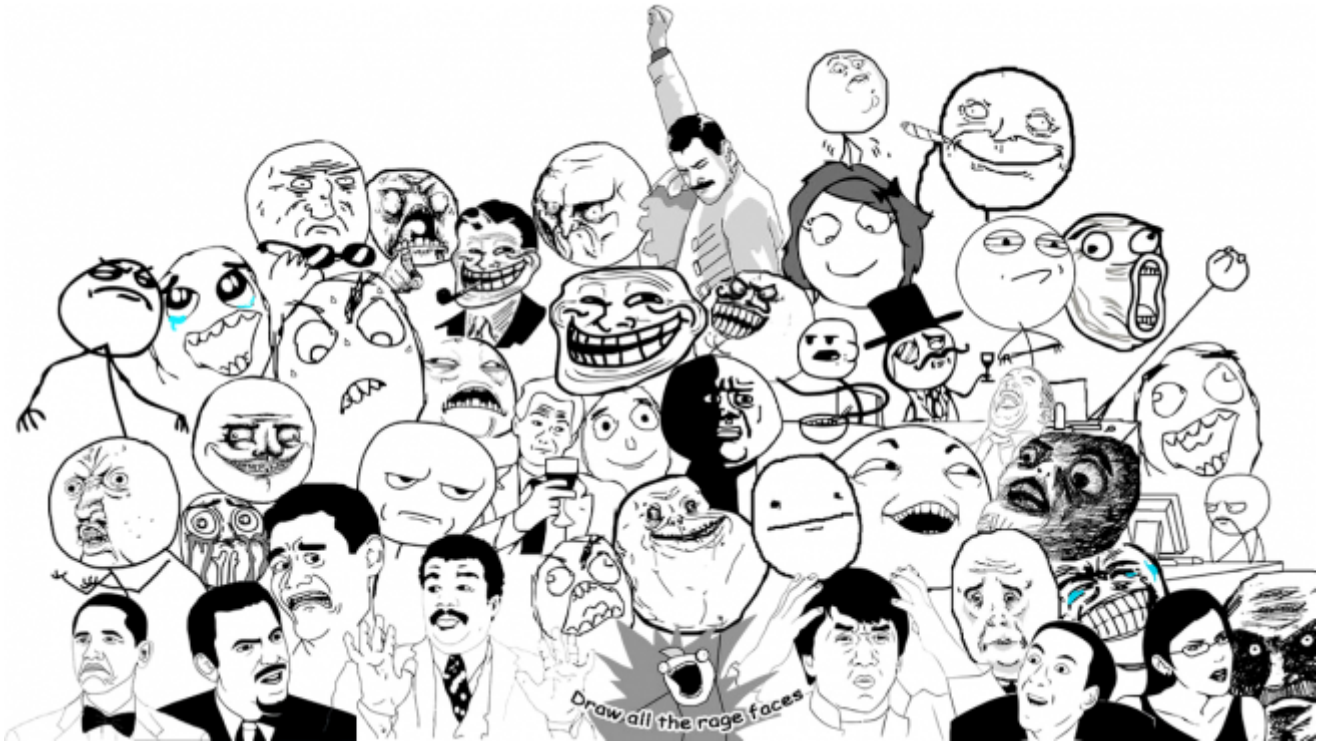
Una raccolta di Rage faces (e altre icone del mondo dei meme).

personaggi realizzati con Microsoft Paint dalle espressioni buffe e grottesche nati come fumetti su 4chan (la culla della sottocultura nerd contemporanea), uno degli esempi più tipici di Internet meme, oggi non fanno altro che “doppiare” funzioni e usi tipici delle emoticon: le “facce arrabbiate” vengono usate per esprimere emozioni, sentimenti, stati d’animo o per commentare e giudicare una data affermazione o situazione (in termini di social media marketing si parlerebbe di sentiment ).