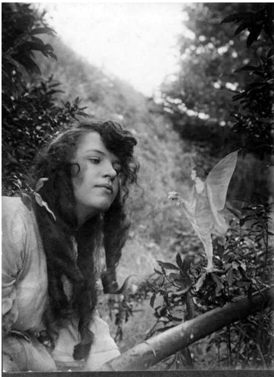
Fate di Cottingely