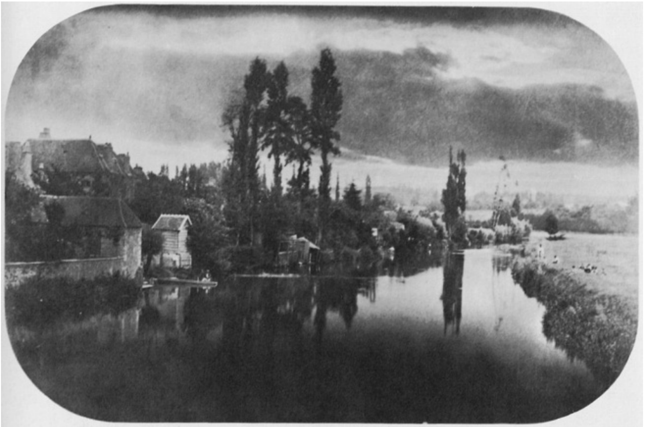
ph. Camille Silvy

È quando nel 1990 Adobe decise di commercializzarlo, che nacque il nome con il quale adesso è conosciuto in tutto il mondo. In esso già allora s'intravedeva una sua vocazione a diventare qualcos'altro, a sconfinare. Rispetto al coevo Deluxe PhotoLab , per esempio, battezzandosi "Photoshop" la creazione di Knoll suggeriva un approccio alle immagini meno tecnico e da iniziati, per nulla laboratoriale. Al contrario, si presentava come partner disimpegnato, ludico, quasi mercuriale. Il messaggio era chiaro: ora puoi affrontare l'immagine fotografica con leggerezza e casualità, perché Photoshop ti rende libero di farne quel che vuoi. Come quando fai shopping. In effetti, Photoshop si fa largo da subito proprio perché si rivolge a tutti. Questa sua primaria rivoluzione - l'elaborazione della fotografia condotta fuori dai "lab" - ha fatto di un software, unico tra i fenomeni del digitale democratico, una virtuale star. Non a caso l'avvento di Photoshop è stato accompagnato da espressioni magiche fin lì patrimonio della letteratura fantastica. Basta consultare i testi apparentemente "neutri" della manualistica per leggere di prodigi quali Combinare e modificare le forme, trasformare le immagini, creare un'ombra (in Photoshop CS5 - Guida Completa , a cura di Edimatica, Apogeo, 2010). Volontà antiche, alchemiche, all'incrocio tra scienza e mito, quasi un'eco del Faust di Marlowe: "Costringerò le ombre a darmi tutto ciò che desidero?".