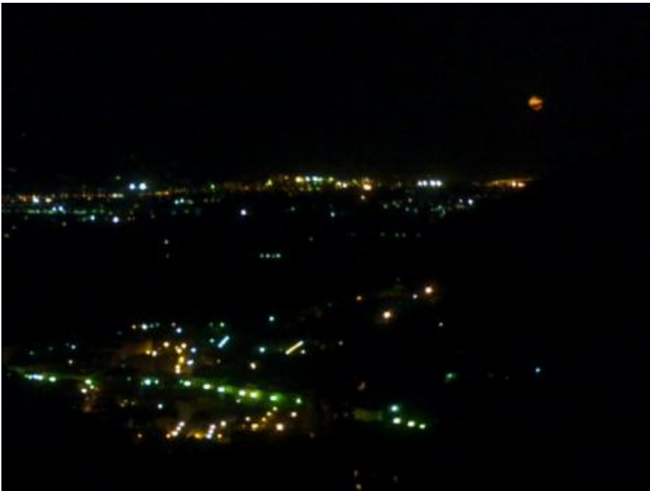
Magra di notte.