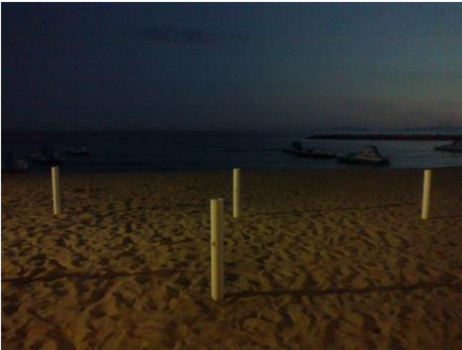
Ombrelloni a Follonica.