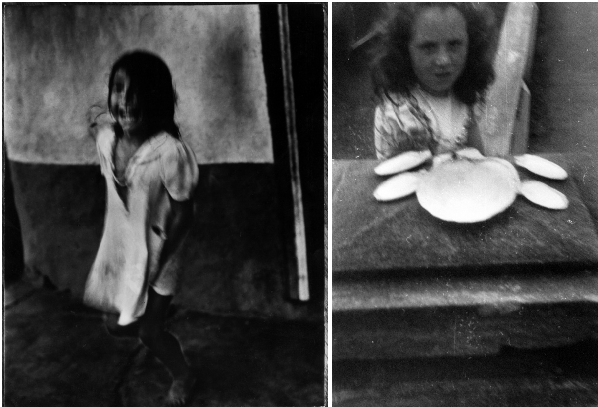
Da sinistra: Jumping girl, Panama, 1944-45 ; Girl with seashells, 1953 , ph. Sid Grossman (per gentile concessione della Howard Greenberg Gallery , New York)

Si veda la “ragazzina che salta” del 1944-45, un’ombra bianca disegnata su un muro, liquida e incostante come un’impronta sul punto di svanire, un puro segno. O la “bambina con conchiglie” del 1953, presenza evanescente, sopraffatta dal biancore abbagliante dei gusci vuoti in primo piano. O ancora i “gabbiani sull’acqua a Provincetown” del 1953, vorticoso gioco di luci e riflessi che ribalta i piani prospettici, producendo un misterioso scivolamento del dentro nel fuori, del sotto nel sopra.