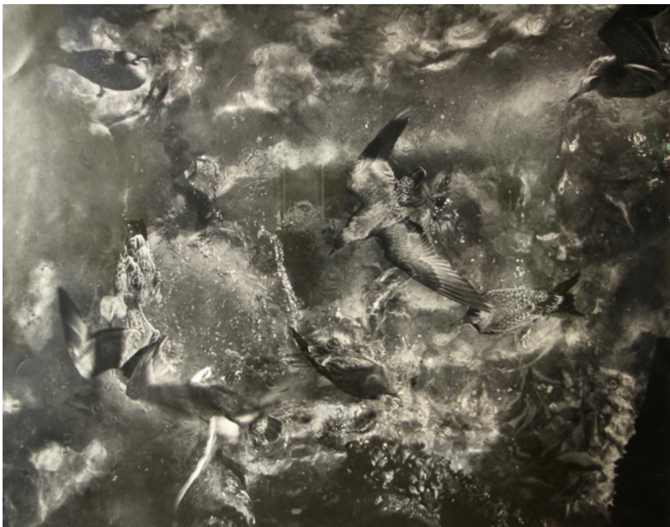
Gulls over water in Provincetown, 1952, ph. Sid Grossman (per gentile concessione della Howard Greenberg Gallery , New York)