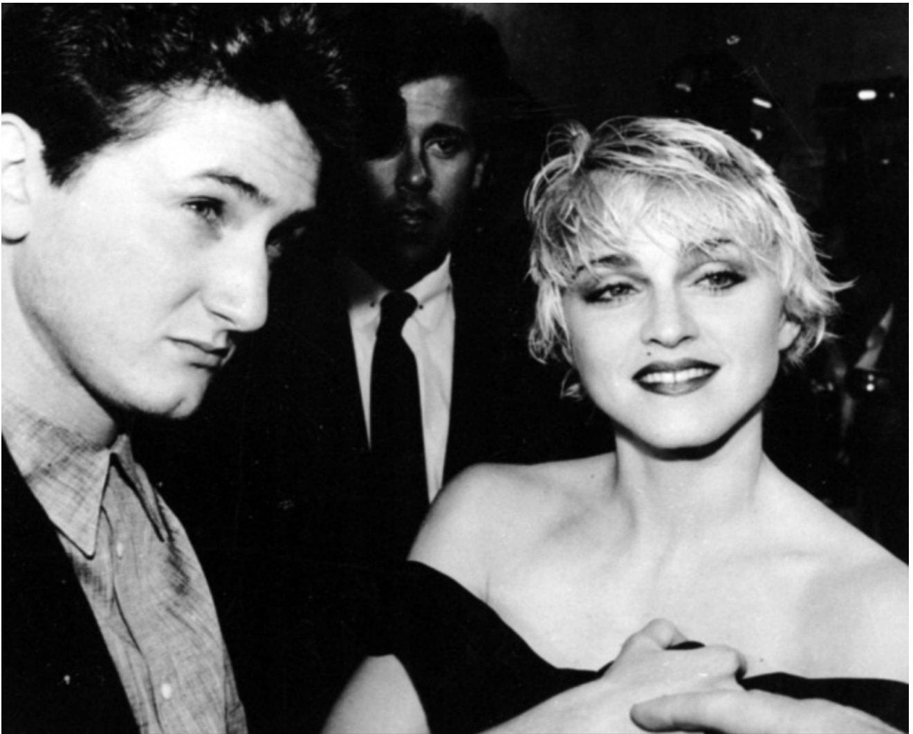
Madonna e Sean Penn, 1986

Non credo che possa durare molto quella sovranità che danno investimenti multipli. Perché per l'innamorato c'è un momento in cui la cosa si cristallizza.