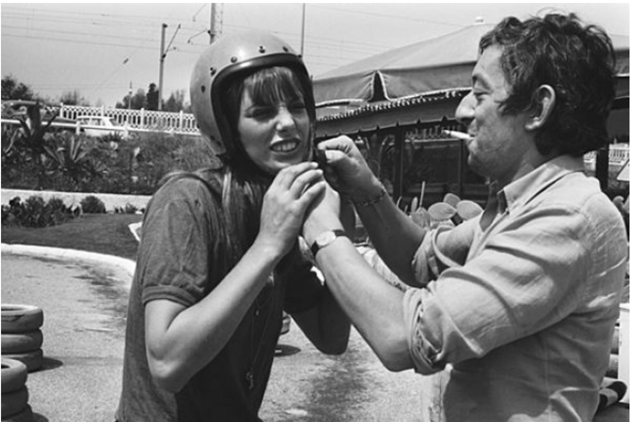
Jane Birkin e Serge Gainsbourg

C'è anche un sentimento popolare che si esprime nelle osservazioni, negli scherzi, nelle battute salaci. Questi svalutano il soggetto innamorato che viene assimilato a un lunare, a un folle. Bisogna però dire che le svalutazioni enormi di cui soffre l'amore sono quelle imposte dai linguaggi teorici. O non ne parlano affatto, come il linguaggio politico, il linguaggio marxista, o ne parlano con sottigliezza, ma in maniera riduttiva, come la psicoanalisi. Che cos'è questa "svalutazione" di cui oggi soffre l'amore? L'amore-passione (quello di cui ho parlato) non è "ben visto"; lo si considera come una malattia di cui bisogna guarire; non gli si attribuisce, come una volta, un potere di arricchimento.