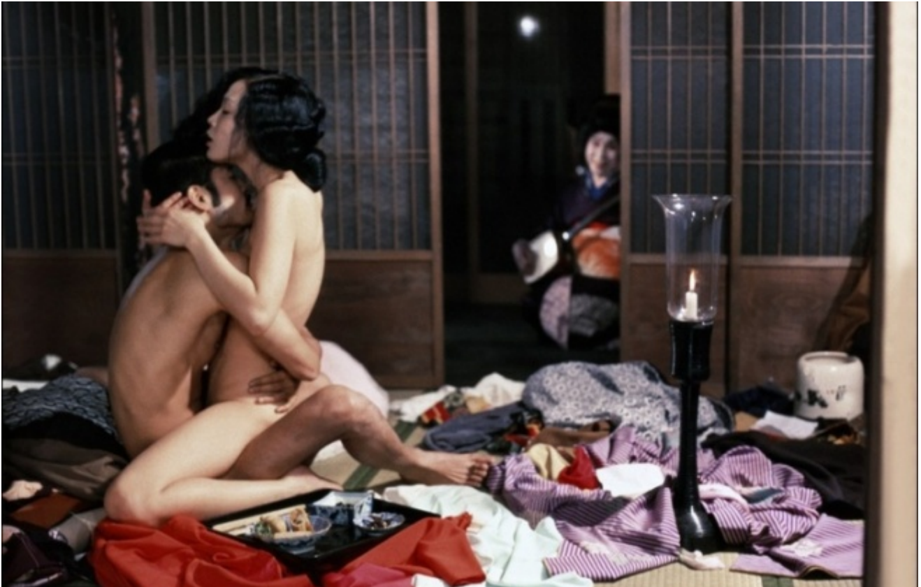
Ecco l'Impero dei sensi, regia di Nagisa Ōshima, 1976