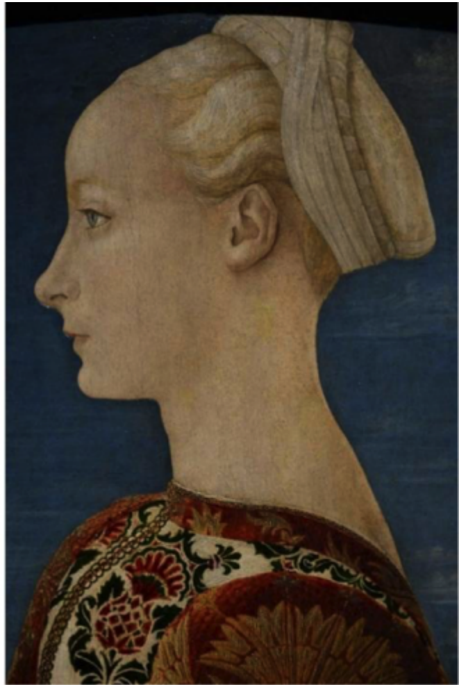
Da sinistra: Piero del Pollaiuolo, Ritratto di donna di profilo (New York, The Metropolitan Museum of Art , Bequest of Edward Harkness, 1940); Piero del Pollaiuolo, Ritratto di donna di profilo (Berlino, Staatliche Museen , Preußischer Kulturbesitz , Gemäldegalerie )

Milano, 20 gennaio 1858, Corsia del Giardino, residenza dei nobili Poldi Pezzoli,