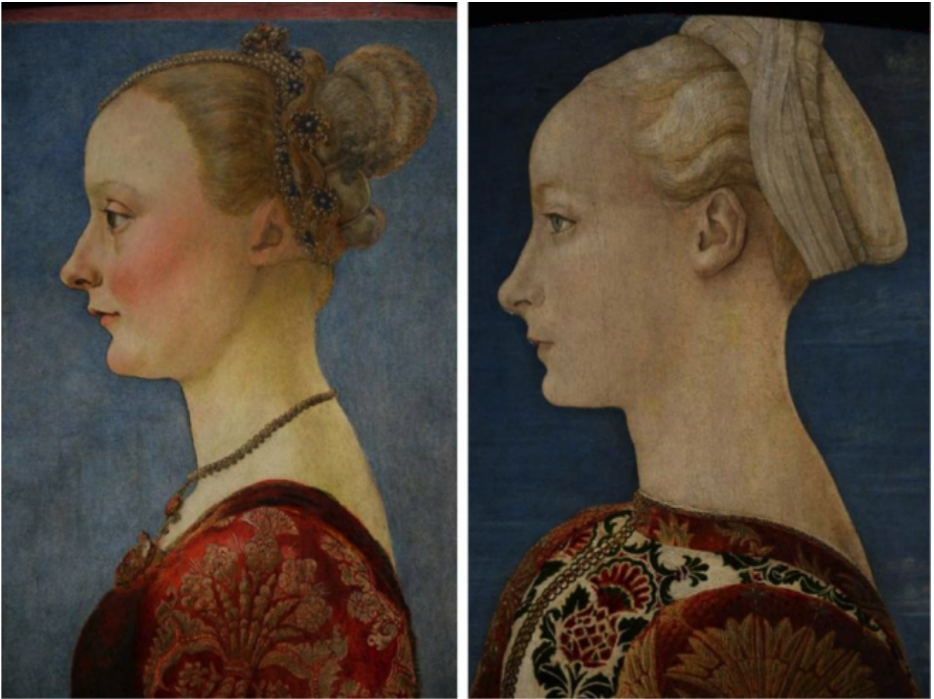
Da sinistra: Piero del Pollaiuolo, Ritratto di donna di profilo (New York, The Metropolitan Museum of Art, Bequest of Edward Harkness, 1940); Piero del Pollaiuolo, Ritratto di donna di profilo (Berlino, Staatliche Museen, Preußischer Kulturbesitz, Gemäldegalerie)

Milano, 20 gennaio 1858, Corsia del Giardino, residenza dei nobili Poldi Pezzoli,