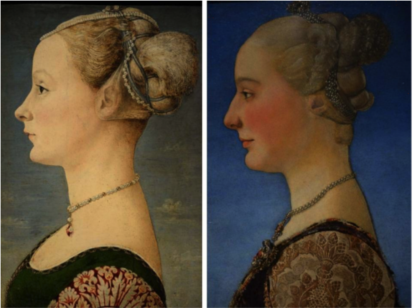
Da sinistra: Piero del Pollaiuolo, Ritratto di donna di profilo (Milano, Museo Poldi Pezzoli); Piero del Pollaiuolo, Ritratto di donna di profilo (Firenze, Galleria degli Uffizi)

a coprirle le orecchie, quasi invisibile perché della medesima tonalità del suo incarnato pallido.