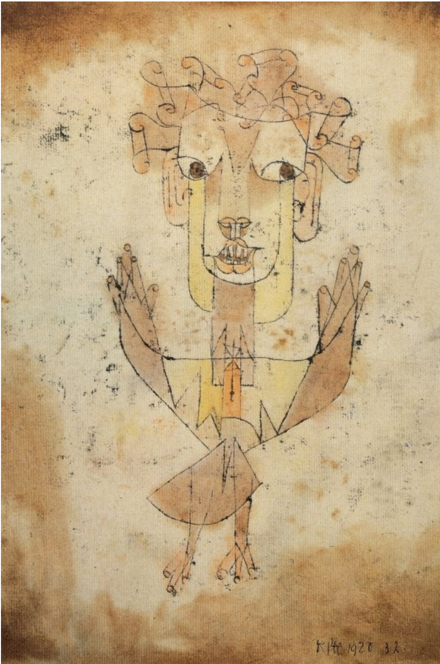
Paul Klee, Angelus Novus , 1920