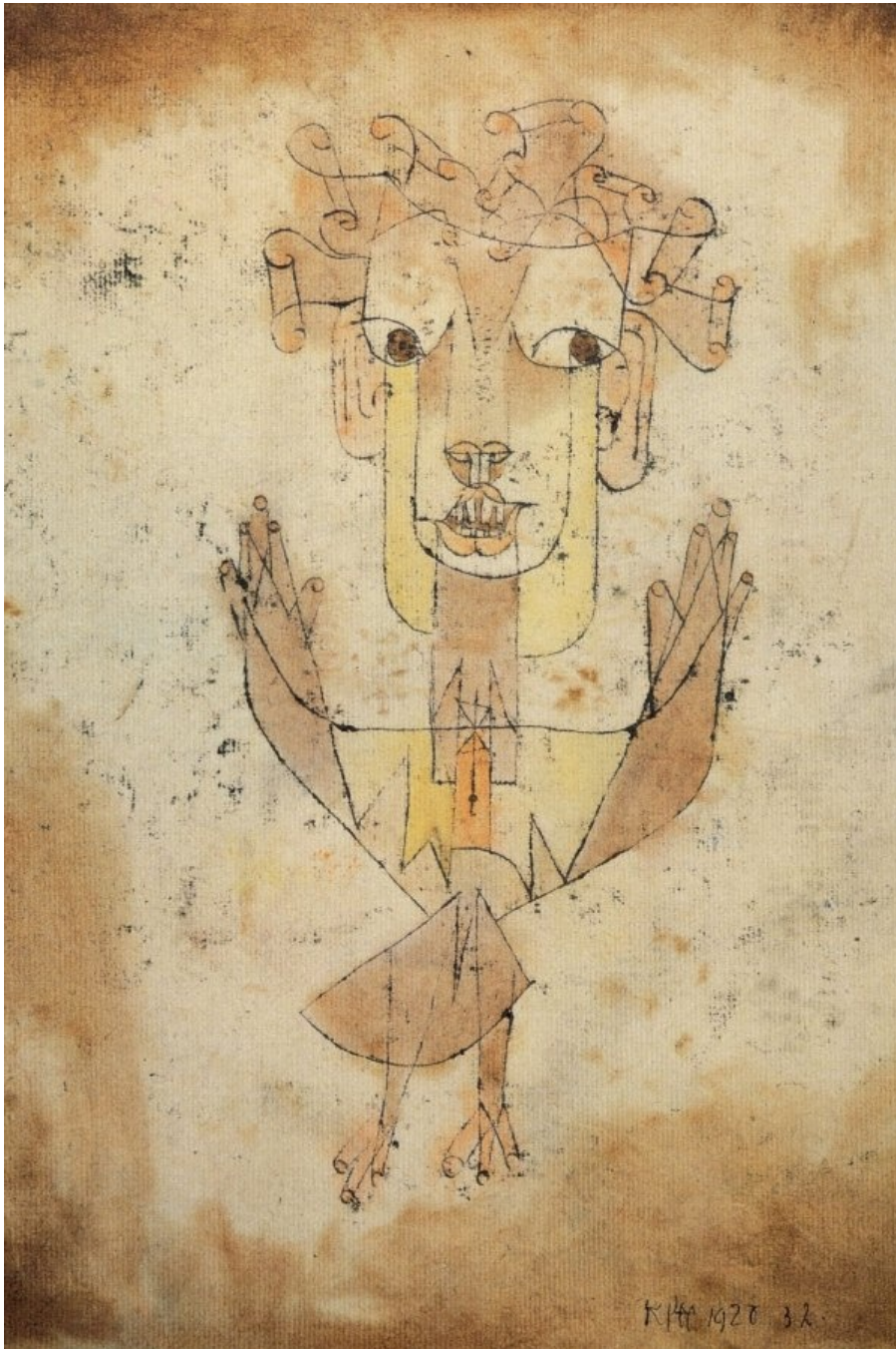
Paul Klee, Angelus Novus , 1920