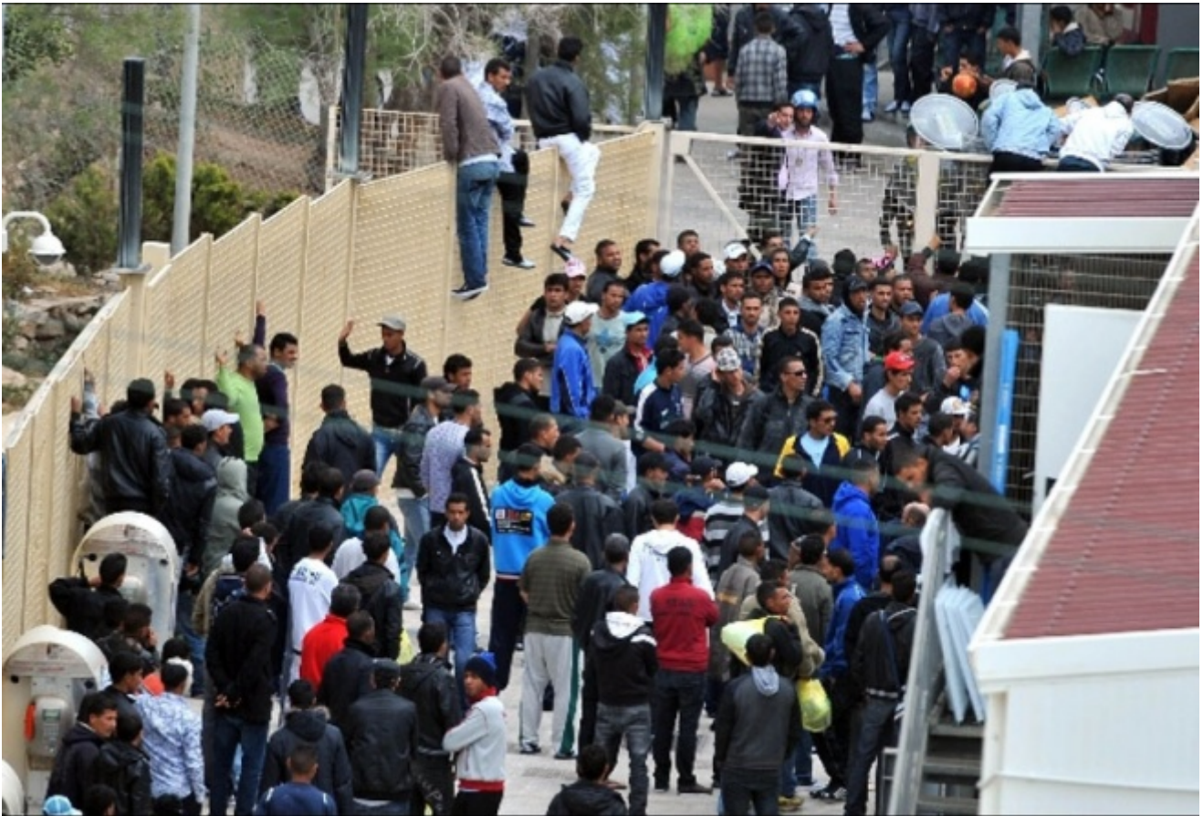
Centro d'accoglienza Porto empedocle