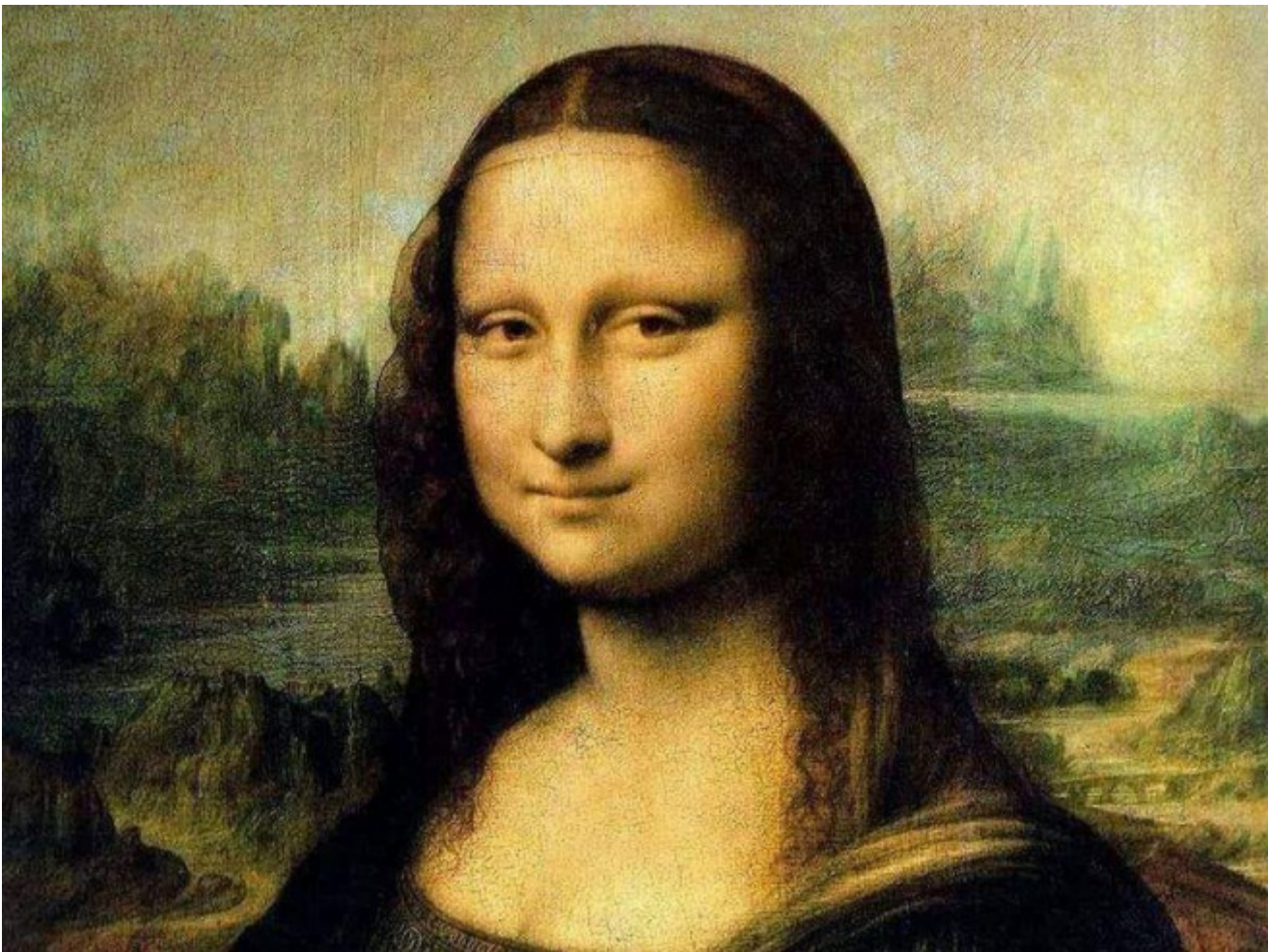
Leonardo da Vinci, La Gioconda , particolare, 1503-1517