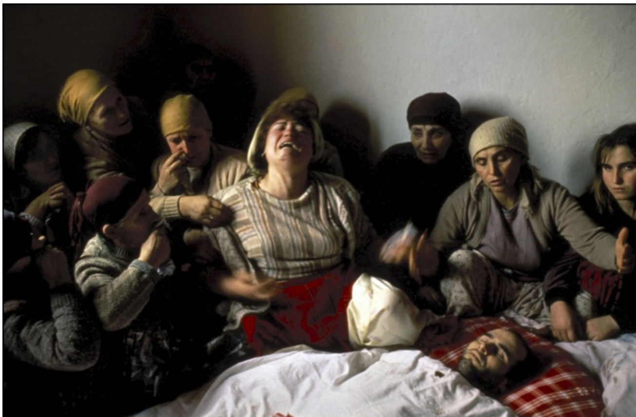
Georges Méryllon, Pietà del Kosovo , 1990

storico, anacronia o eterocronia . L'anacronismo sarà allora la conoscenza necessaria di tale complessità e degli intrecci temporali. Davanti ad un'immagine non bisogna solamente domandarsi quale storia essa documenti e di quale storia è contemporanea, ma anche quale memoria sedimenta e di quale rimosso essa è il ritorno.