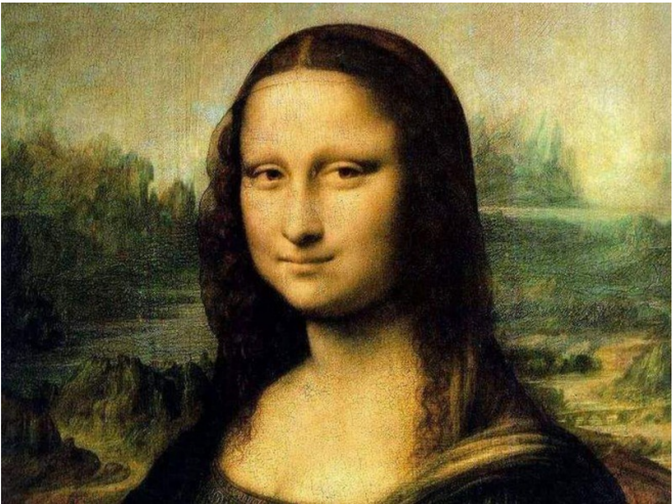
Leonardo da Vinci, La Gioconda , particolare, 1503-1517