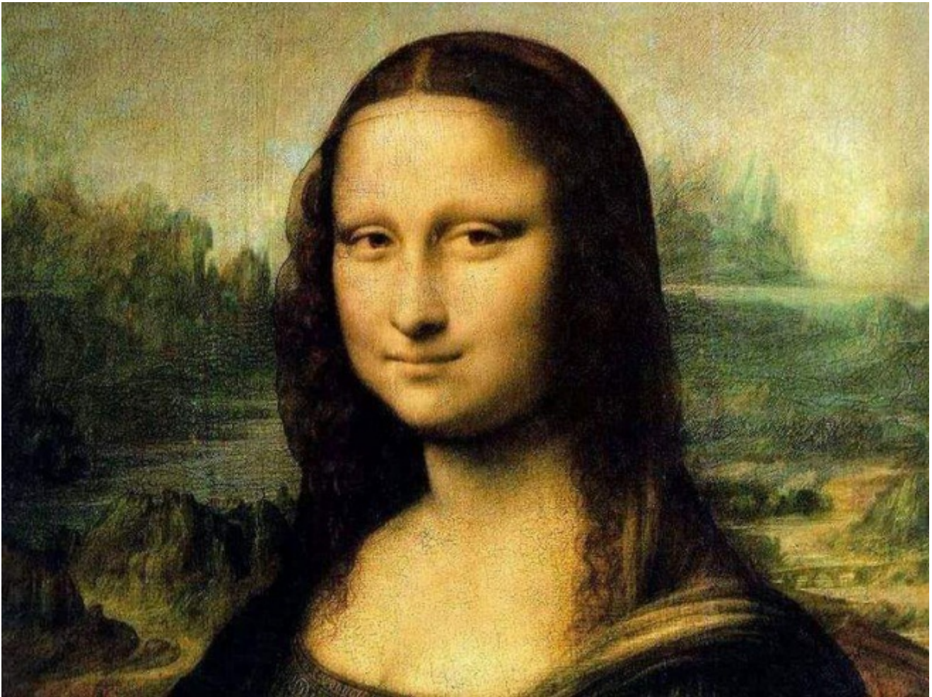
Leonardo da Vinci, La Gioconda , particolare, 1503-1517