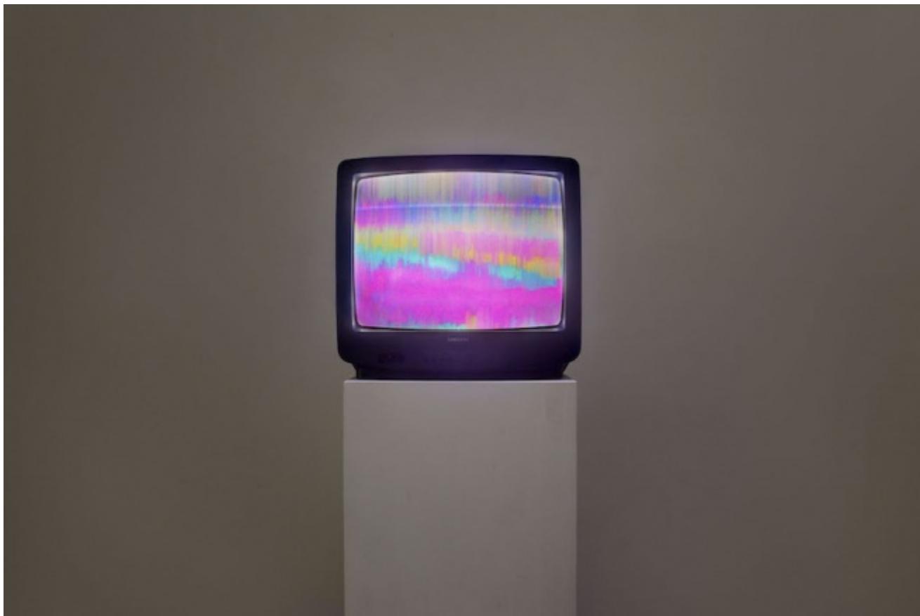
William E. Jones - Installation view. Ph. Lorenzo Palmieri. Courtesy the artist, Galleria Raffaella Cortese

sorta di trip oggettivo , un'allucinazione che appartiene solo all'immagine stessa e traduce le vicende convulsive attraversate dal suo supporto fisico manipolato. Una "sequenza di file digitali", e non semplicemente un video, perché il materiale originario, un nastro VHS ottenuto dai National Archives statunitensi, è stato acquisito e decomposto digitalmente da Jones, i frame selezionati e passati attraverso numerosi filtri di Photoshop fino a perdere ogni apparenza figurativa. Per gran parte della proiezione il quadro è in preda a una continua turbolenza di bande colorate, pattern geometrici, onde sfrangiate: un persistente rumore visivo in cui di tanto in tanto riusciamo a distinguere qualche elemento, anch'esso disturbato dal deterioramento dell'originale. Il sonoro giunge invece nitido ed è questo che permette di risalire al materiale di partenza, di capire quindi cosa Jones stia facendo a questo nastro, di cui troviamo le tracce sfigurate anche nell'altro lavoro in mostra, esibito in un piccolo monitor, Mission Mind Control .