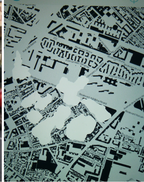
Da sinistra: In situ, Malakoff; dettaglio della mappa di Malakoff