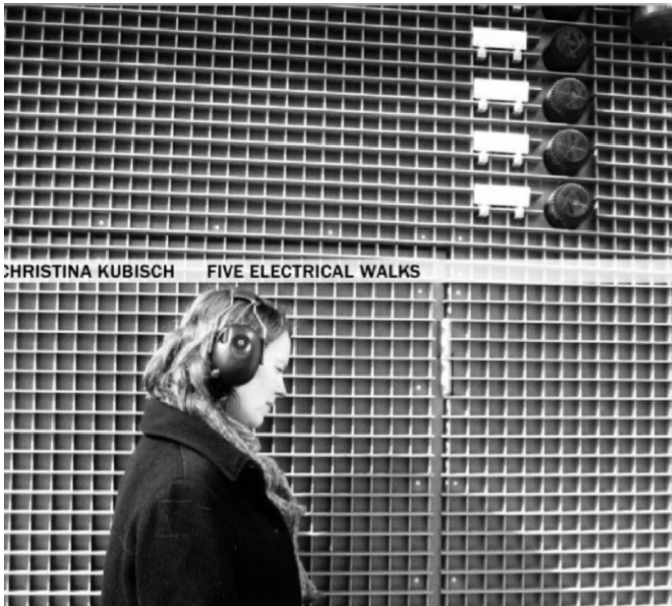
Five Electrical Walks, 2007

Solo negli anni novanta questo tipo d'esperienza d'ascolto esce dalla galleria d'arte per espandersi nelle città fino a diventare una pratica quasi esclusiva del suo lavoro artistico, tanto che il suo sito recensisce, tra il 2004 e il 2013, ben 47 Electrical Walks . Anche all'aperto il principio rimane lo stesso. Camminare per le strade della città prestando attenzione, ascoltando, le manifestazioni elettromagnetiche che le particolari cuffie sulle orecchie ci permettono di percepire e scoprire.