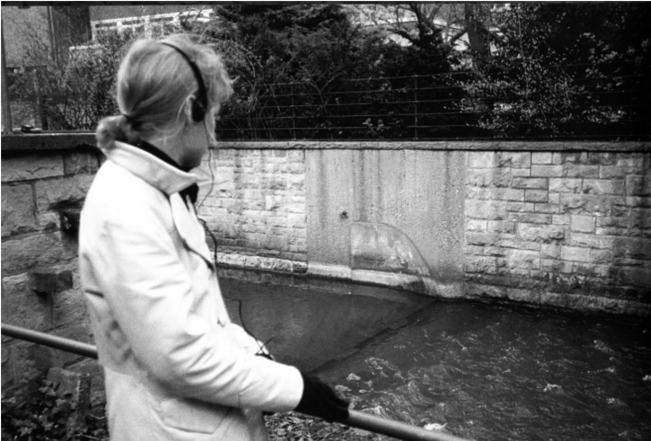
Janet Cardiff in ascolto, Münster 1997