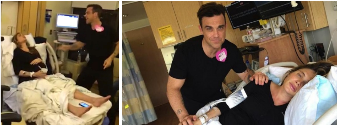
Robbie Williams durante e dopo il parto della moglie

È importante che anche i padri vengano addestrati al «come si fa», perché di fatto anche loro prenderanno parte all'accudimento del figlio, spesso sostituendosi alle mamme in modo assolutamente intercambiabile. Non è ormai raro, infatti, né inconsueto, vederli alle prese con biberon e pannolini e aggirarsi per le strade travestiti da «marsupiali», con indosso delle modernissime attrezzature che servono per portare in giro il bambino, tenendolo avvolto e stretto a sé, come se fosse ancora nel grembo materno. Questa nuova possibilità culturale che oggi gli uomini hanno di poter prendere parte all'accudimento dei bambini è condizionata da diversi fattori.